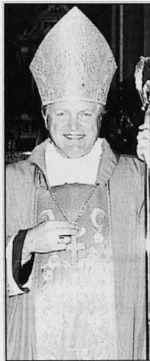
1985 posvečen v škofa. Kot škof je najprej služboval v kraju Zuglio Carnico, od leta 1990 do leta 1996 pa je bil