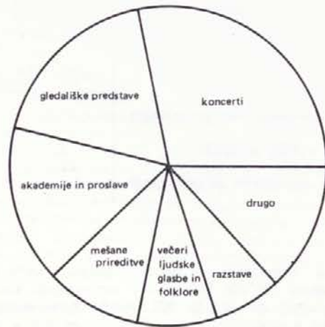
SLIKA 2. Predstave kulturno-umetniških društev 1985/86

Ljubitelji so v društvih priredili 7 736 predstav, gledalo pa jih je skoraj 2 milijona obiskovalcev. V primerjavi z gledališko sezono 1980/81 ob predzadnjem popisu je delovalo 1985/86 6 društev več, ljubiteljev je bilo 13,5% več, predstav je bilo za 8,5% več, obiskovalcev pa za 10,6% manj.