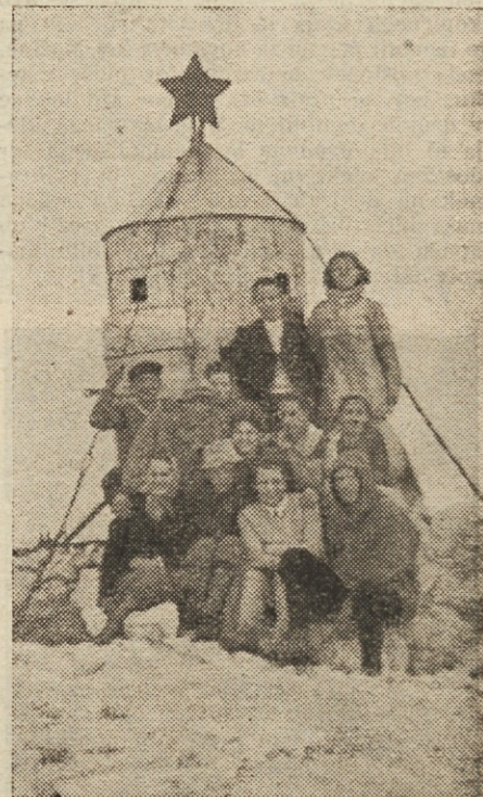
Lani smo se povzpeli tudi na Triglav.

Šah: prvenstvo podružnice. Udeležba 14 članov, prvenstvo grafičarjev v Celju in sindikalno prvenstvo Ljubljane (moška in ženska ekipa).