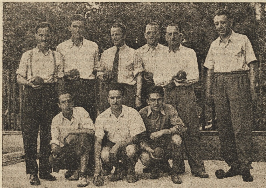
Tudi skupina naših ballnearjev se je vneto udejstvovala v svoji panogi.

Pokažimo z udeležbo na občnem zboru, da se začčenja odločen prelom v našem sindikalnem delu!