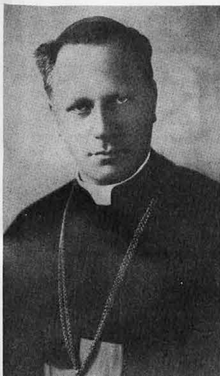
Škof dr. Gregorij Rožman na začetku svoje križev škofovske poti

Ce bi ljubljanski škof dr. Gregorij Rožman še živel, bi te dni obhajal stoletnico rojstva, saj se je rodil v Šmihelu na Koroškem 9. marca 1883. Ne vem, če se bodo v njegovi nekdanji škofiji spomnili tega jubileja. Saj je ime »škof Rožman« še vedno na proskripcijski listi v njegovi domovini in si ga le redkokdaj upajo v javnosti izreči. Tu v svobodnem zamejstvu pa nimamo takih obzirov in zato lahko mirno praznujemo ta jubilej, četudi dr. Rožman ni bil naš goriški škof. Prav pa je, da se nanj spomnimo zaradi vezi, ki so se spletle med njim in nami po drugi svetovni vojni.