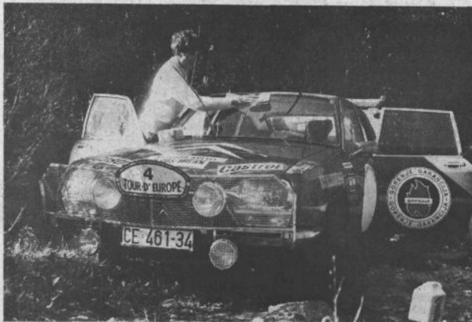
Ustavila sta se le za kratek čas, da sta opravila najnujnejše