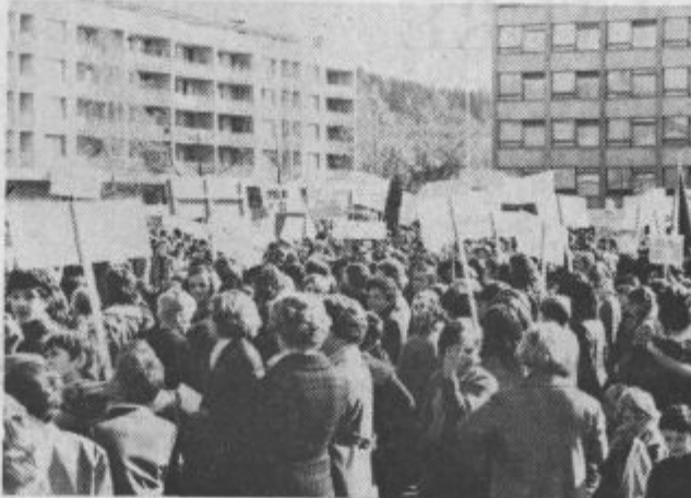
Protest zoper nasilje nad Slovenci na avstrijskem Koroškem

venščine v javnosti in javnih ustanovah in celo proti uporabi slovensčine v pogovornem jeziku med starši in otroki. Svoj vpliv uveljavljajo v kadrovski politiki, zlasti pri nameščanju uslužbencev v javnih službah (v upravi, sodstvu, šolstvu, prometu in pošti). Toda kljub prizadevanju nazadnjaških sil v Avstriji, da bi kar najhitreje sporočili svetu, da Slovencev v Avstriji ni več, se slovenski življenj trdo bori za svoj obstoj. Kot narodnostna manjšina žive Slovenci na obsejnejšem sklenjenem ozemlju Južne Koroške in v obliki majhnih otokov z nekaj vasmi v obmejnih področjih avstrijske Štajerske na meji med Avstrijo in Slovenijo. Do druge svetovne vojne so pripadali skoraj izključno kmečkemu sloju, izobraženci so bili le duhovniki. Sele v zadnjem desetletju se je izoblikoval razmeroma velik delež nekmečkega prebivalstva, ki ga sestavljajo še vedno od zemlje odvisni in nanjo čustveno vezani polkmetje.