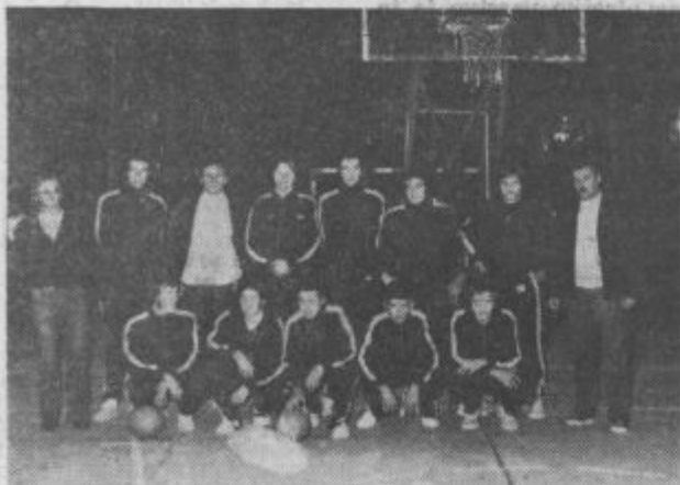
Košarkarji šoštanjske Elektre