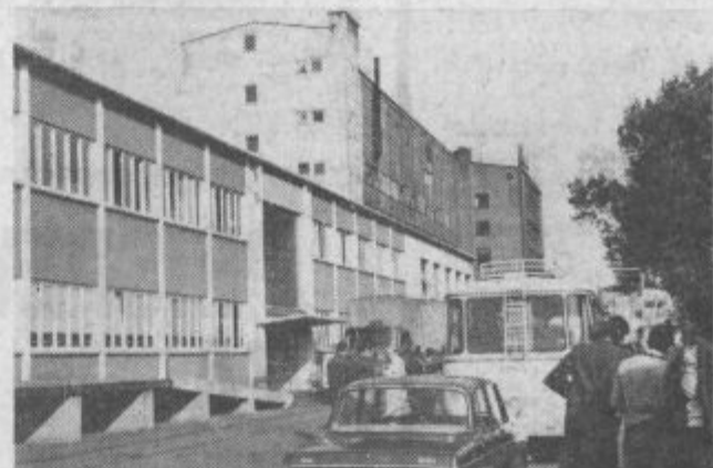
Sportniki iz Gorenja so si ogledali tovarno Bauknecht

Gostovanje je znova pokazalo, da šport zares ne pozna meja, čeprav sta podjetji Bauknecht in Gorenje konkurenčna proizvajalca bele tehnike. Hinko J.