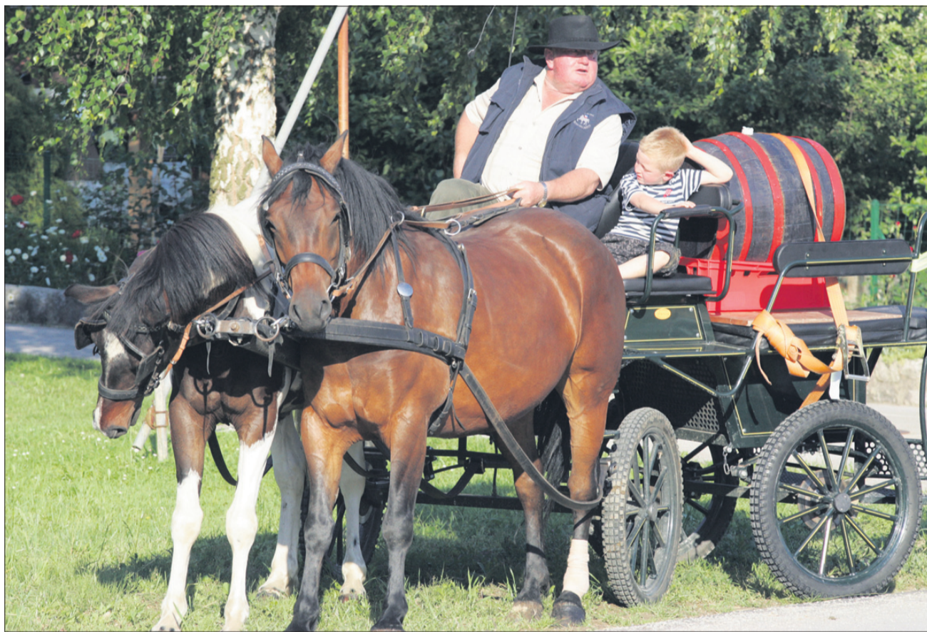
Dostava vina na tradicionalen način