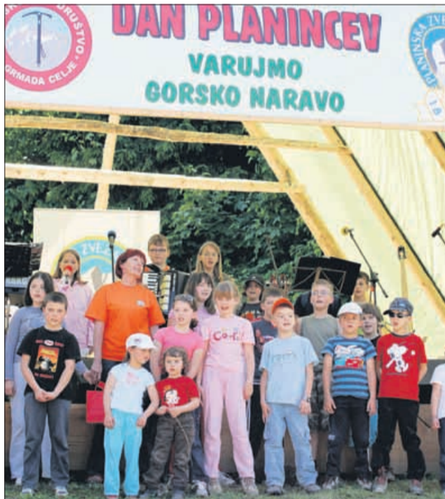
Moto letošnjega srečanja je bilo Varujmo gorsko naravo. O lepotah narave, pomembnosti varovanja okolja ter osveščanju za kvalitetno in sonaravno gibanje v gorskem svetu je potrebno začeti pri mladih.