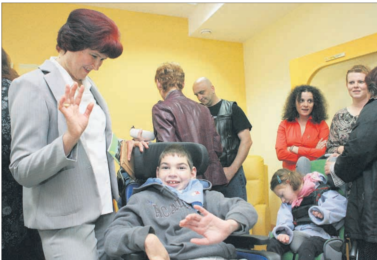
Otroci in mladostniki z motnjami v duševnem in telesnem razvoju, ki obiskujejo dnevni center v Trubarjevi ulici, so se veselili odprtja prenovljenih in razširjenih prostorov centra. V njem je prostora za 15 otrok, pri čemer jih je trenutno v centru 9.