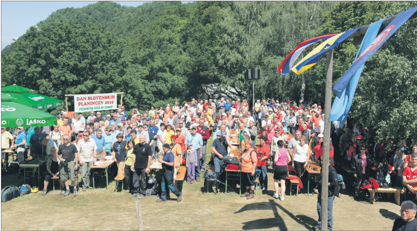
Dan planincev je vsakoletna priložnost, da se na enem kraju zberejo ljubitelji gora, izmenjajo izkušnje in skujejo načrt za obisk katerega od vrhov.