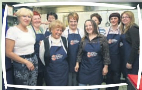
Nasmeh z razlogom - nič ne bo treba kuhat