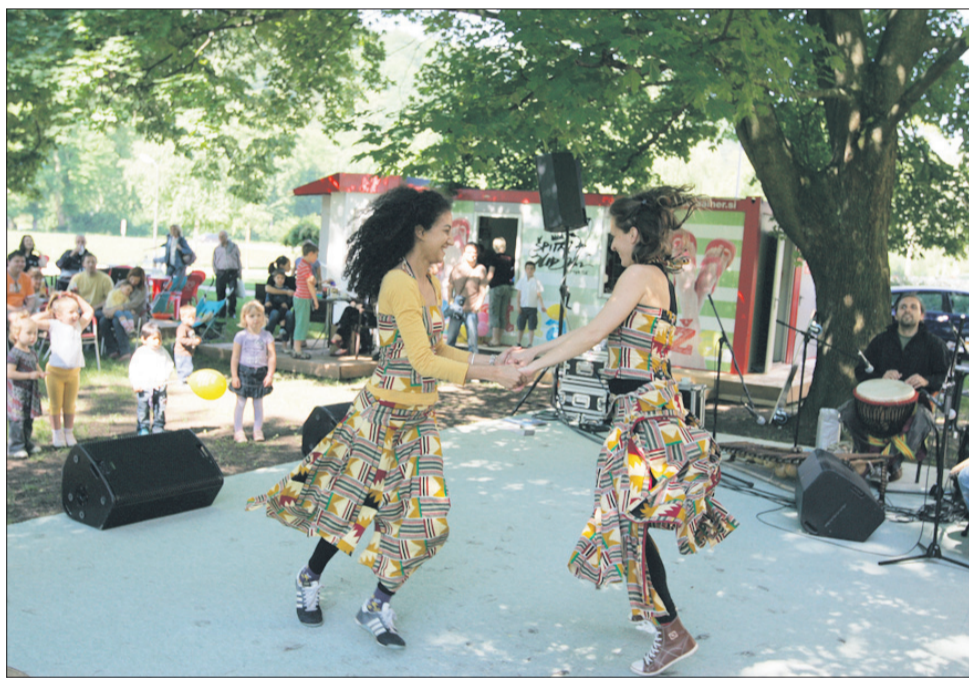
Na Mestni plaži so otroci skozi ritme, glasbo in ples spoznavali Afriko.