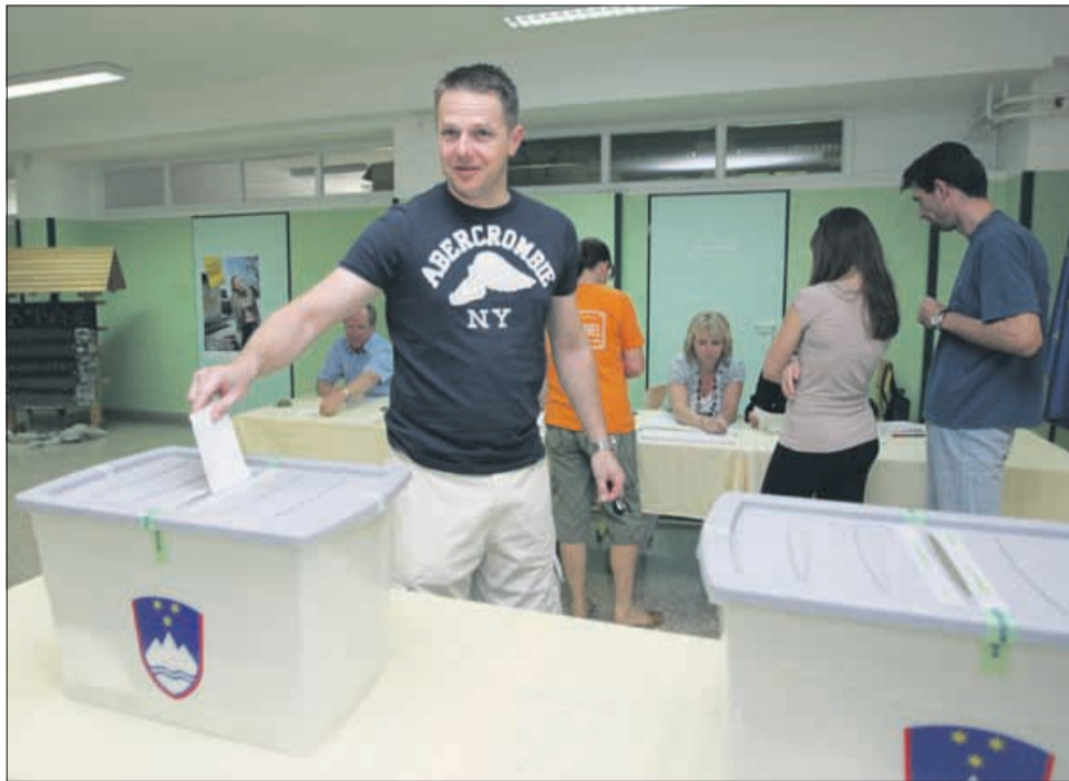
Z volišča v IV. OŠ Celje

Med osmimi volilnimi enotami so arbitražni sporazum podprli volivci v petih (Postojna, Ljubljana-Center, Ljubljana-Bežigrad, Novo mesto in Maribor), nasprotovali pa so mu v treh volilnih enotah (Kranj, Ptuj in Celje). V 5. volilni enoti s sedežem v Celju je bilo razmerje glasov za in proti ravno obratno kot na državni ravni. Največ nasprotnikov arbitražnega sporazuma je bilo v volilnem okraju Mozirje, kjer so ga zavrnili s kar 62,61 odstotka glasov, sledijo pa Slovenske Konjice in Šentjur, kjer so bili volivci prav tako več kot s 60 odstotki proti.