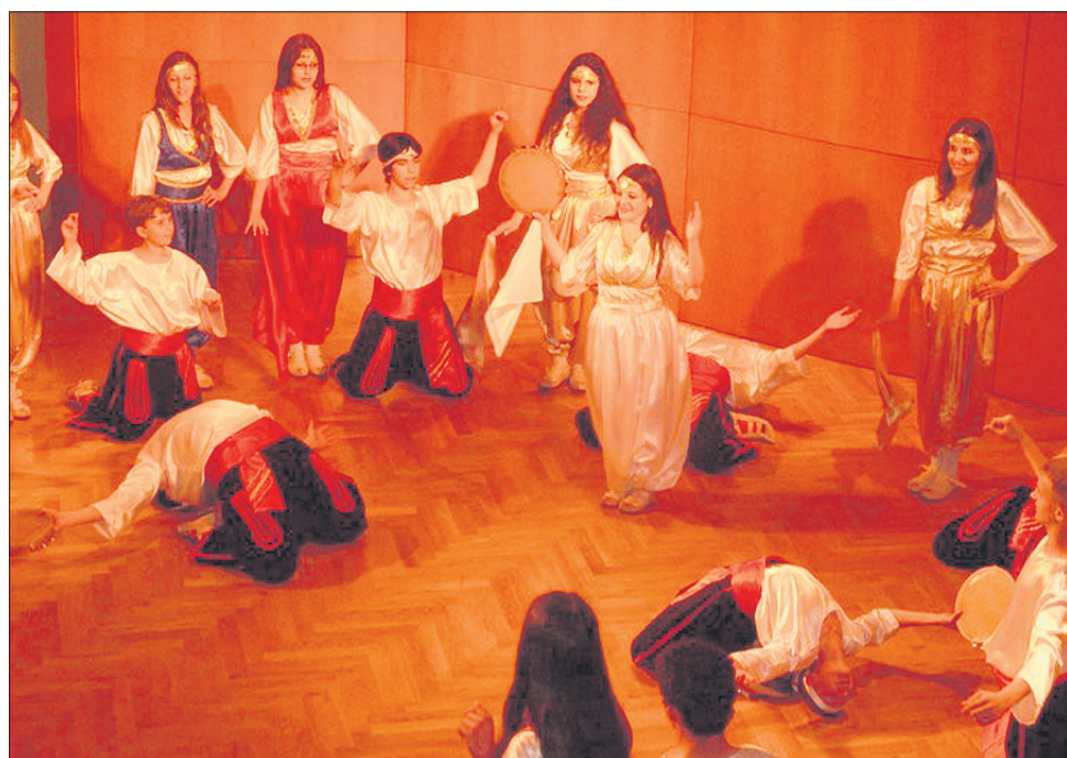
Na prireditvi je nastopila tudi folklorna skupina srbskega društva iz Celja.