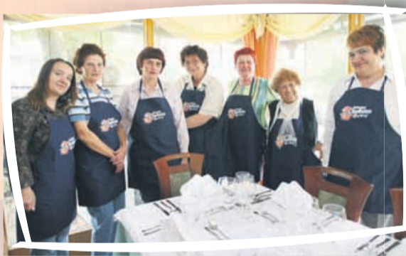
Predpasnike smo si oblekle, kaj pa zdaj?