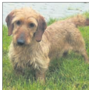
Ne, nisem nov lik iz znane risane serije, kjer nastopajoči nimajo nog. Moje so samo tako kratke, da so se skrile v travi. (7949)

sem na ulici večkrat skoraj stopila na pasji iztrebek. Pa ne na enega in le na nekaterih ulicah, ampak je bilo že na eni ulici na vsakih 10 metrov mogoče videti pasje kake. Lastniki niso pobirali iztrebkov za svojimi kužki, četudi so ti opravili potrebo kar sredi ulice ali pa na zelenici. Pa še ena stvar, ki sem jo rav-