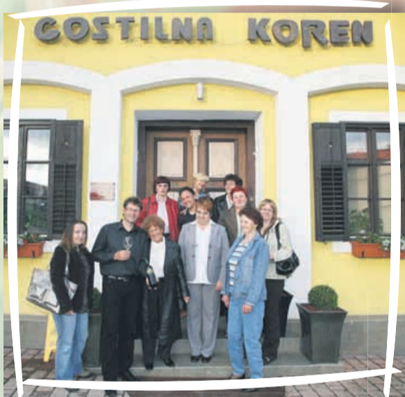
Zakuhali smo srečanje v Gostilni Koren.