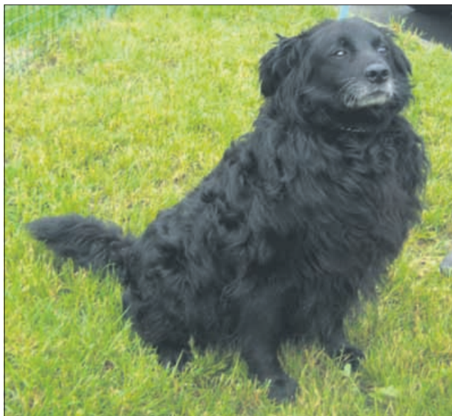
Sem ponosen lastnik tele zelene parcele, ki jo vidite, in vseh žuželk njej. Zdaj mi manjka samo še človek, ki me bo imel rad. (7931)

Naj začnem z lepšim delom vtisov, in sicer s sosedovimi psi, ki so lajali okrog hiše, v kateri sem prebivala. Najbolj zanimivo se mi je zdelo, da je imela večina sosedov po dva psa – enega velikega in enega manjšega ter, običajno, enega mešanca in enega pasemskega (no, vsaj izgledalo je tako). Ti kužki so imeli na razpolago veliko dvorišče in kup igračk. Spominim se, da je nemški ovčar vseskozi stiskal neko piskaço igračko, kar se mi je zdelo zelo zabavno. Sosedov črni mešanček je ponavadi sredi vrta grizel vrh, druga dva sosedova psa pa sta ga pri tem opazovala čez kamnito ograjo.