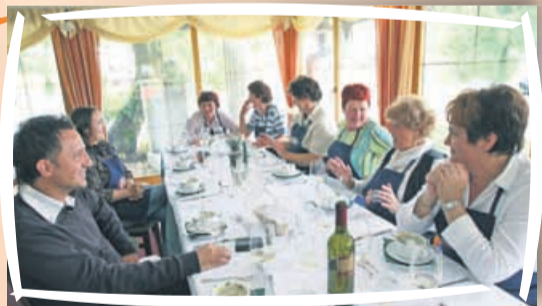
Tako nas razvajate, da sploh ne bi šle domov, so ugotovile naše izžrebanke.