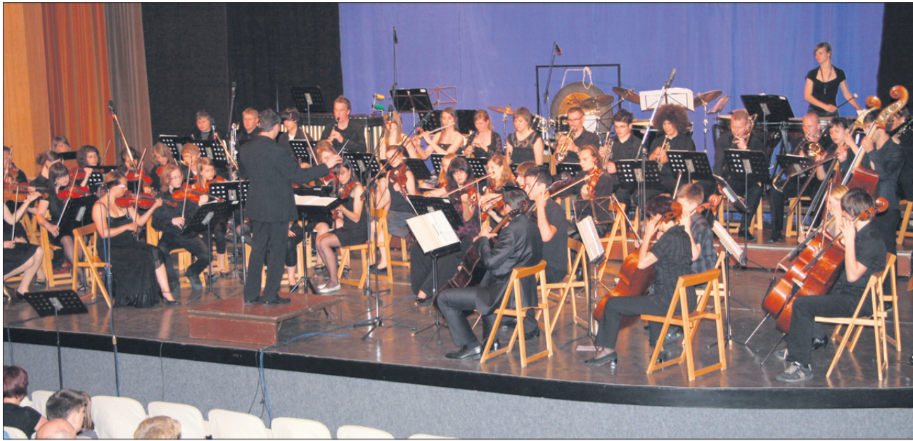
Oder v žalskem hramu kulture je bil skoraj premajhen za vse žalske simfonike.