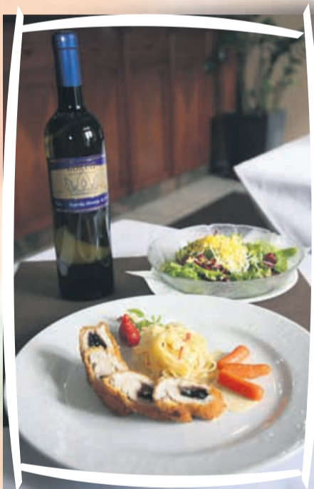
Glavna jed, paša za oči in usta

Kdor rad kuha, gotovo tudi kdaj kaj zakuha! Uredništvo Novega tednika in Radia Celje je za vas pripravilo akcijo, ki je namenjena vsem, ki imate radi dobro hrano. Ni pomembno, če vse pripravite sami ali samo veste, kje je dobra gostilna. V akciji Vedno kaj (za)kuham je tokrat sodelovalo prvih šest srečnic, ki smo jih izžrebali med prejetimi kuponi. Družile so se z mojstri kuhe v Gostilni Koren na Dobrni. Vsi drugi pa boste lahko svojo srečo pri žrebu preverili, če boste izpolnili kupon, tokrat za druženje v gostišču Bezgovšek v Laškem. V sredo med 10. in 11. uro pa si vzemite čas za poslušanje in sodelovanje v oddaji Kuhajmo skupaj Radia Celje.