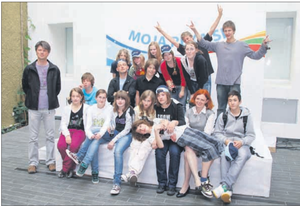
Zmagovalna ekipa s Polzele