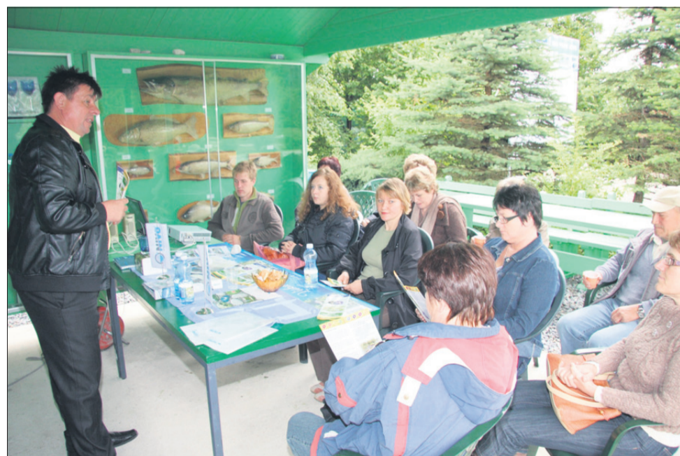
Tudi delavnice in predavanja so imeli svoje obiskovalce.

no je bilo ob ribniku Vrbje in v Bioparku Nivo, po svoje je zaživela Savinova hiša in