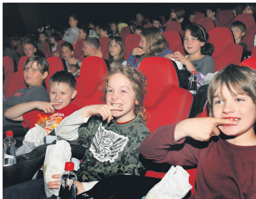
Končna nagrada so zdravi zobje. Tista vmesna, za vzpodbudo, je vsakoletna prireditev, ki jo pripravijo za otroke zmagovalnih razredov.