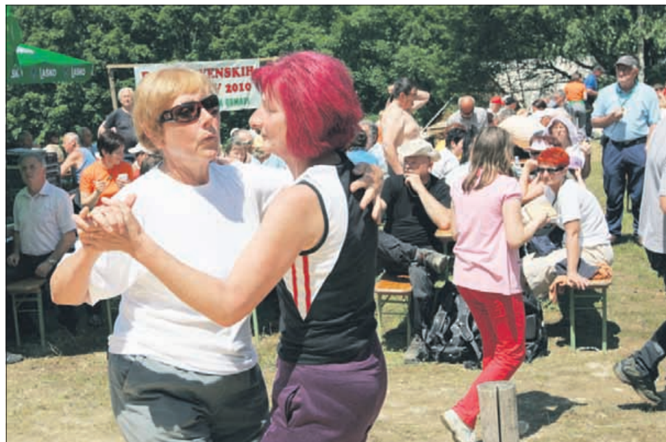
Ni pomembno, kdo koga zavrti, med planinci je pomembno veselo in pristno vzdušje.