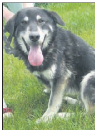
Poletje se bliža, jaz pa imam na sebi še zimsko dlako, ker sem nekje izgubil krtačo. No, in zdaj me zanima, če bi si lahko sposodil tvojo. Obljubim, da jo po uporabi vrnem. (7968)

Uradne ure: od ponedeljka do petka od 8. do 16. ure; ogledi psov: od ponedeljka do petka od 12. do 16. ure. Sprehajanja po dogovoru in predhodni najavi po telefonu, preko e-maila nina.starckel@gmail.com ali preko facebook skupine Zonzani od ponedeljka do petka od 12. do 16. ure, ob sobotah od 10. do 12. ure. Telefon: 03/749-06-00; internetni naslov www.zonzani.si