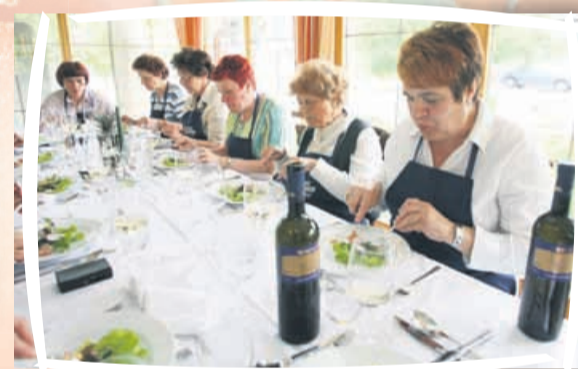
Resni začetki, predjed je otvoritev kulinarčnega razvajanja.