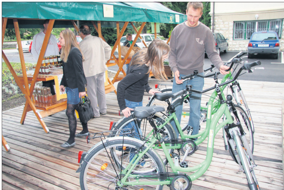
Z zelenimi kolesi v eko doživetja.

Organizatorji želijo domačinom in obiskovalcem žalske občine ponuditi radostno doživetje narave, človeka in energije v zeleni dolini. K sodelovanju so povabili ekološke pridelovalce, ki so se predstavljali na ekološki tržnici, spet drugi na bio boljšem sejmu, v ekomuzeju so se obiskovalci ustavljali na različnih delavnicah, živah-