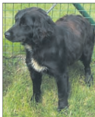
Kaj ni Bea prekrasna psička? In njen karakter je tudi krasen ... (7991)

Uradne ure: od ponedeljka do petka od 8. do 16. ure; ogledi psov: od ponedeljka do petka od 12. do 16. ure. Sprehajanja po dogovoru in predhodni najavi po telefonu, preko e-maila nina.starckel@gmail.com ali preko facebook skupine Zonzani od ponedeljka do petka od 12. do 16. ure, ob sobotah od 10. do 12. ure. Telefon: 03/749-06-00; internetni naslov www.zonzani.si