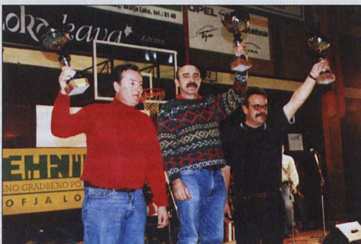
Predstavniki najboljših ekip so visoko dvignili pokale.