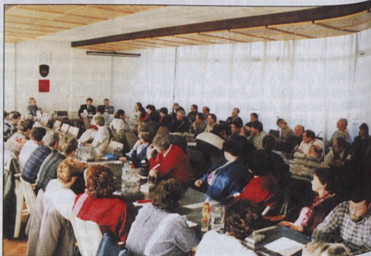
Na Bartolovo povabilo je v Dom sindikatov prišlo kakšnih 100 odpuščenih delavcev Emone Blagovni center.

Najtežje vprašanje pa je bila pravica vas odpuščenih delavcev do odpravnine. Dovedoval sem, da imajo odpuščeni to pravi-