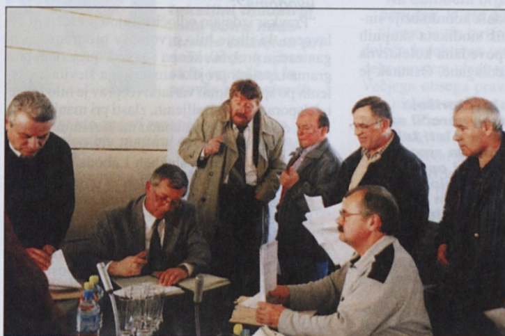
Več delavcev se je posvetovalo s predstavniki območne organizacije ZSSS Ljubljana z okolico, kjer bodo dobili pravno pomoč.