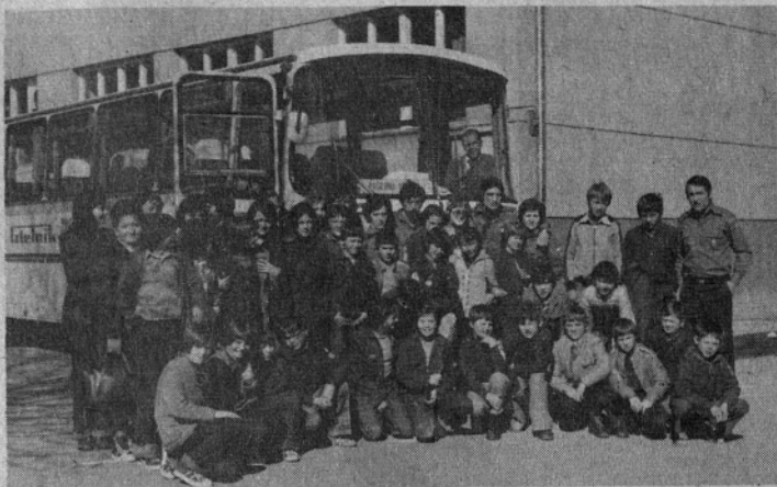
Udeleženci srečanja na Prežihovem

Konec aprila je 80 tabornikov v dveh dneh opravilo pohod po številnih krajih Gornje Savinjske doline. Skoraj povsod so bili lepo sprejeti. Obiskali so vsa spominska obeležja na svoji poti, ob katerih so jim borci domačini pripovedovali spomine, taborniki pa so jim oddolžili s spominskimi darili.