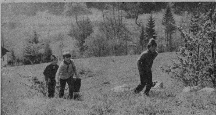
Na poti in tik pred zasedo