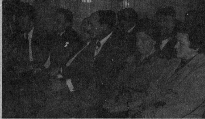
Gostje in magrajenci med sejo . . .

Takšne so bile torej razmere v komunistični partiji Jugoslavije, ko je tovariš Tito postal leta 1936 njen organizacijski že sredi leta 1937 pa generalni sekretar.