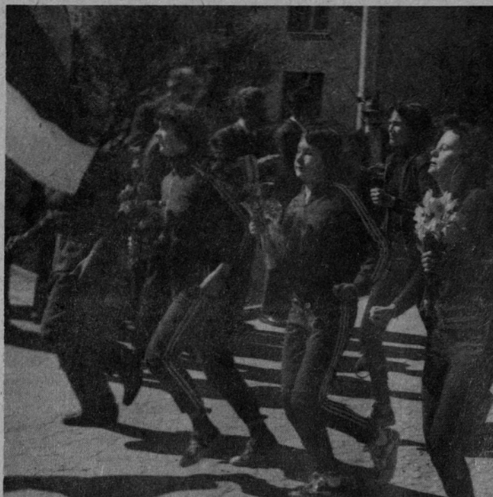
Z zastavami v rokah in z radostjo v srcu

smo tovarišu Titu poslali iz mozirske občine, tokrat po radijskih valovih. Mozirski radioklub je eden izmed 121 v Jugoslaviji in 27 v Sloveniji, ki se je vključil v UKV štafeto 1977. Štafeta je štartala ob Vlasinskem jezeru pri Leskovcu 22. maja ob 11. uri in je prispela na cilj dan pozneje ob 18. uri v Beogradu. Trajala je skupno 354 minut in v tem času „prehodila“ pot dolgo 5940 kilometrov. Mozirski radioamaterji so jo sprejeli v nedeljo ob 13.24 v osnovni šoli v Šmihelu nad Mozirjem.