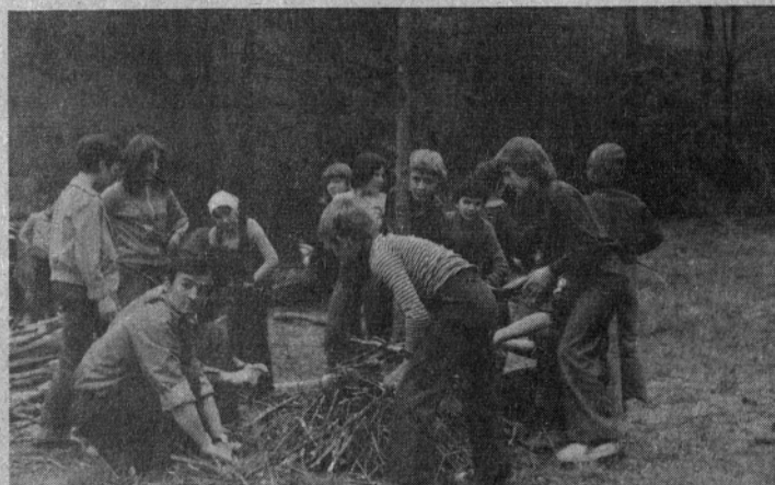
Urjenje veččin—prijetno in koristno