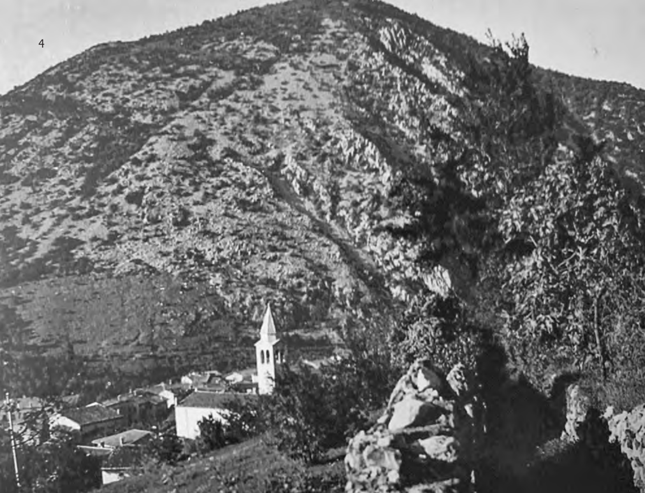
Pogled na Solkan proti Sabotinu, foto: 5. december 1937 (iz publikacije Drevo raste iz korenin , 2021).

ter družbeno življenje. Iz tega širokega vsebinskega razpona stoletij na tem mestu posebej opozarjamo le na nekaj zgodovinskih in prirodoslovnih posebnosti ter na nekatere krajevne narodopisne in jezikovne prvine, ki so soustvarjale koreniko Nove Gorice.