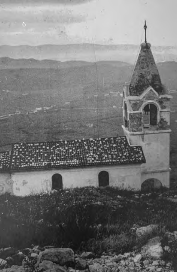
Sv. Katarina, foto: 27. december 1932 (iz publikacije Drvo raste iz korenin , 2021).