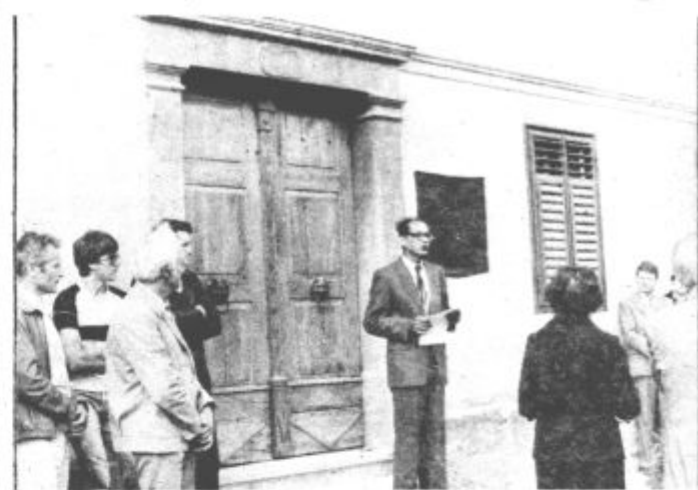
Spominska plošča prvemu slovenskemu geologu Vinku Lipoldu

vencih sorazmerno skromno obdelano področje nadrealističnega oblikovanja in videnja, vse njegovo dosedanje ustvarjanje pa kaže, da si je izbral pravilno pot.