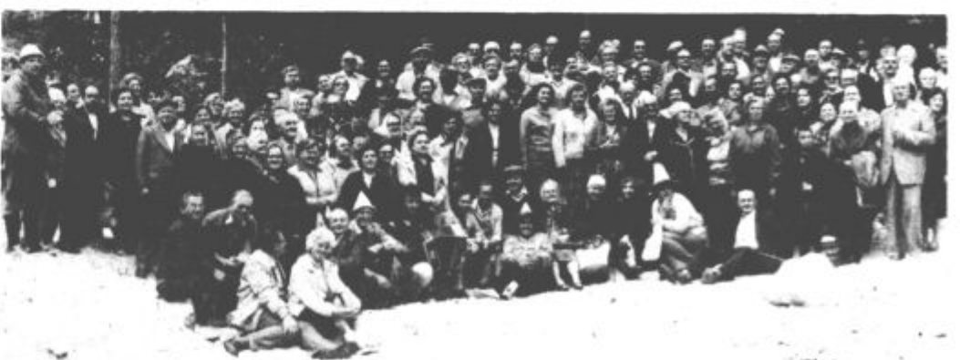
Za spomin še skupni posnetek vseh udeležencev v Logarski dolini