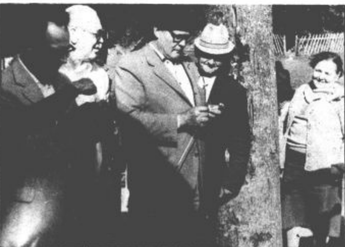
Družabne igre so bile prava paša za oči, posebej ko so moški morali pokazati kako obvladajo „ženska“ opravila

Kot smo že zapisali, so sklepno prireditev pripravili v Logarski dolini. Trije avtobusi so v soboto dopoldne krenili iz Titovega Velenja, Šoštanja in Smartnega ob Paki, z njimi pa se je v Logarsko dolino zapeljalo blizu 190 udeležencev. Kljub črnogledim napovedim, je bilo vreme lepo in kot nalašč za uresničitev bogatega programa družabnih iger. Tisti, ki se iger niso udeležili in so poleg tega vneti planinci, so krenili do slapa Rinke in celo na Okrešelj. Čas namenjen za športna srečanja je kar