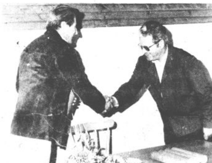
Dolgoletni delavci Savinjsko-Saleške veterinarske postaje so prejeli zaslužna priznanja

Pro svečanosti na veterinarski postaji so novo in izredno pomembno delovno zmago slavili na Zgornjesavinjski kmetijski združitvi v Mozirju. Namenu so izročili sodoben kmetijsko-preskrbovalni center, ki je za nadaljnji razvoj kmetijstva, kot prednostne panoge Gornje Savinjske doline, še kako pomemben. V novih prostorih so našli svoje mesto pokriti skladiščni prostori, uredili so tudi zunanji skladišča, poleg tega so pridobili primerne prostore za vrtnarski center, ki je že doslej zadovoljeval potrebe 62 slovenskih vrtnarjev, v novih sodobnih prostorih pa bo poslej poslovala tudi trgovina s kmetijskim reprodukcijskim materialom ter gradbenimi in kovinskimi izdelki. Povedati velja, da bodo z izgradnjo centra nadaljevali.