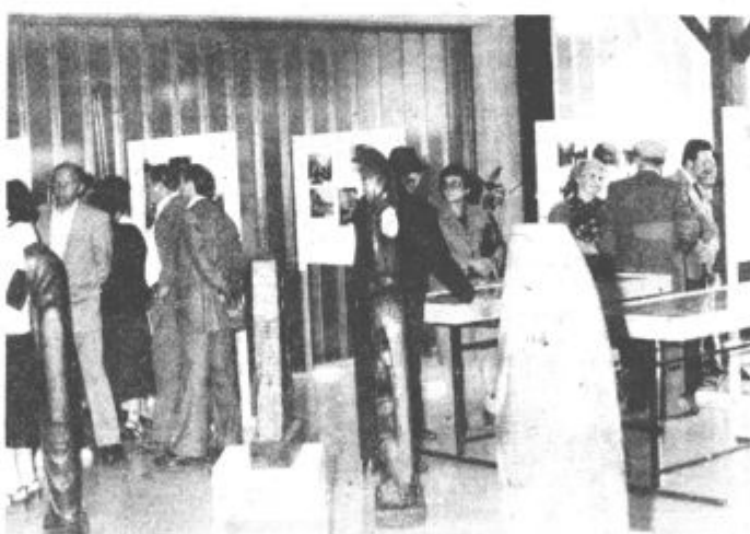
Razstava o borbeni poti Šlandrove brigade in kiparskih del Janka Dolenca je resnično vredna ogleda