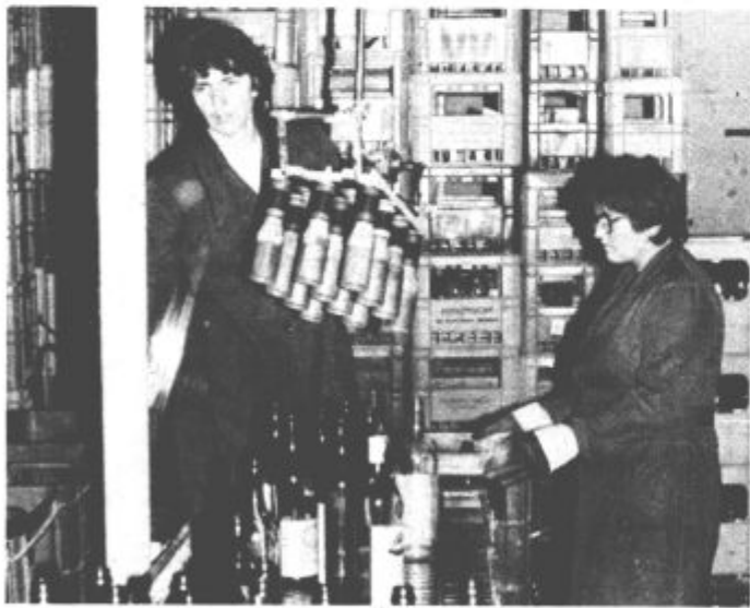
V mesecu avgustu so v svoji polnilnici uspeli napolniti 300 tisoč litrov lastnih namiznih vin brez geografskega porekla

Delovna organizacija Era, tozd Vino Šmartno ob Paki mošta oziroma grozdja ne odkupuje. Za stekleničenje lastnih vin imajo zaposleni z nekaterimi pomembnimi proizvajalci vin v Jugoslaviji sklenjene samoupravne sporazume o dolgoročnem poslovanju.