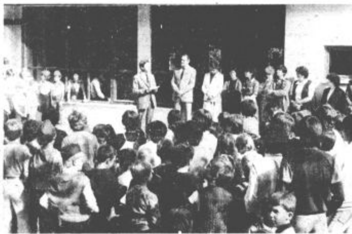
Otvoritve prenovljene šole in večnamenskega prostora so se udeležili številni gostje in domačini