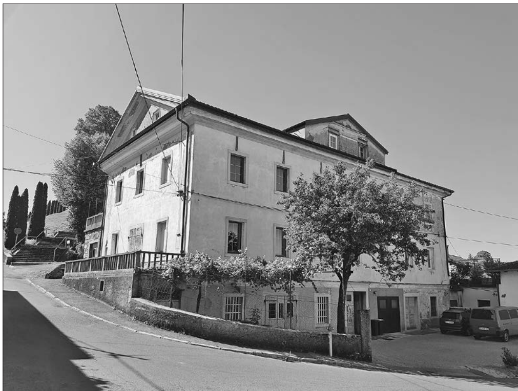
T. i. Jenkova hiša na lokaciji nekdanjega dvorca – Jurčičeva ulica 18.