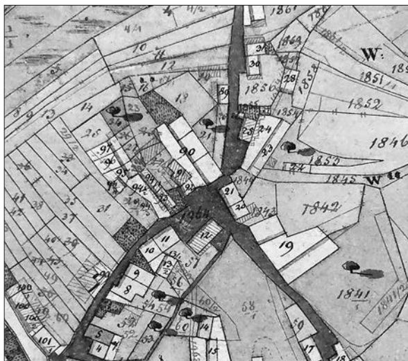
Nekdanji dvorec Trnovo ima na franciscejski katastrski mapi iz leta 1823 številko stavbne parcele 12 (SI AS 176, Franciscejski kataster za Kranjsko, A 26, k. o. Trnovo, mapni list VII).