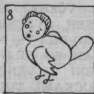
8 Tiček - Miček

PREPLAŠENI SO 1 UTIHNILI V 2, KO SO ZAGLEDALI 3. A 3 SE 1 PRAV NIČ NE SMILJO. ŽE STEGNE 4 IN SEŽE V 2. TEDAJ PA ZAČUTI 1, KAKO MU NEKAJ STEGNJENO 4 ODMAKNE OD 2 IN JO PRITISNE K TELESU. POTEM SE MU NA MAH NAREDI OKLEP IN 3 SE SPREMENI V 5. JOJ, KAKO SO SE ZAČUDILI 6, KO SO V 2 NAŠLI TUJE 5! ŠE BOLJ PA SO BILI PRESENEČENI, KO SO 5 ODPADLE 7 IN SE JE ZVALIL PREČUDNI 8.