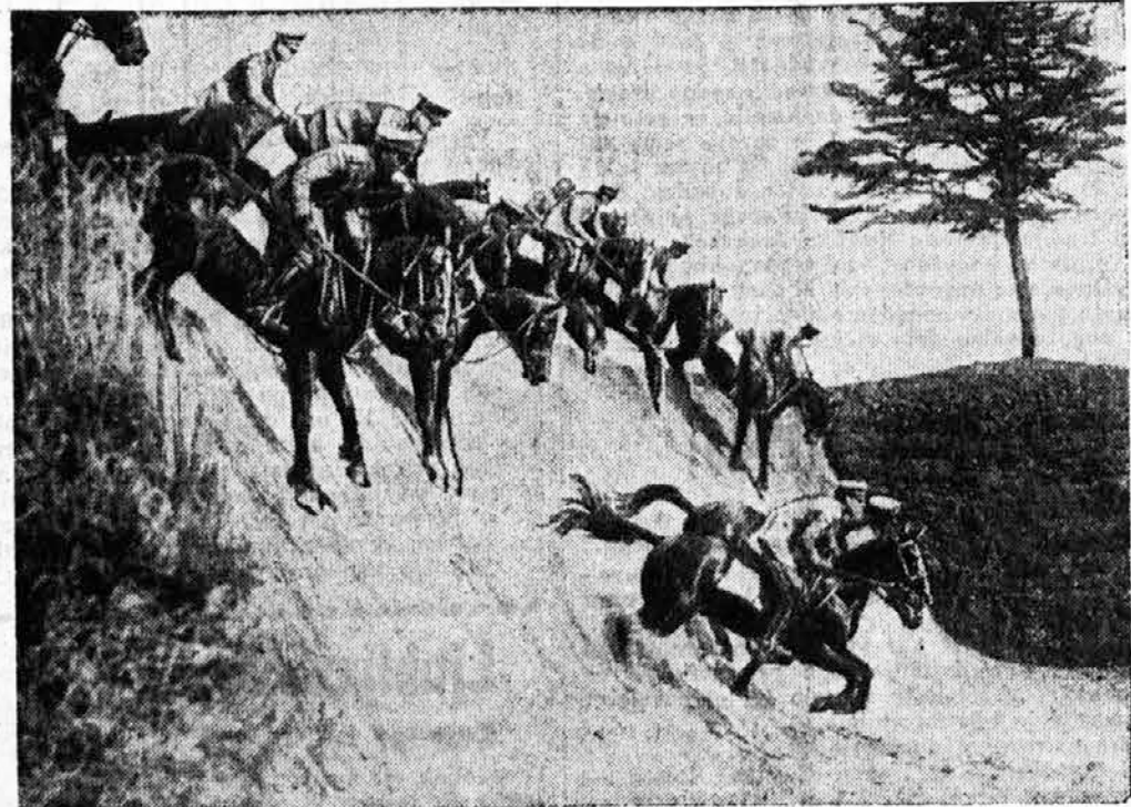
Italijanska konjeniška šola »Tor de Quintoc«.

vremenskimi spremembami, proti raznim kislinam in tudi proti še tako veliki vročini ali mrazu. Ima vse lastnosti, ki jim mora imeti snov, iz katere izdelujejo razne kipe in spomenike na prostem. Ta »trdi papir« ima pa tudi to prednost, da ga je možno stisniti v poljubno velike kose, in tudi razpada mnogo bolj počasi kot pa les, kamen ali bron. Pravijo pa, da ta nova snov zahteva boljših kiparjev, ljudi ki večje znajo ravnati s kiparskim dletom.