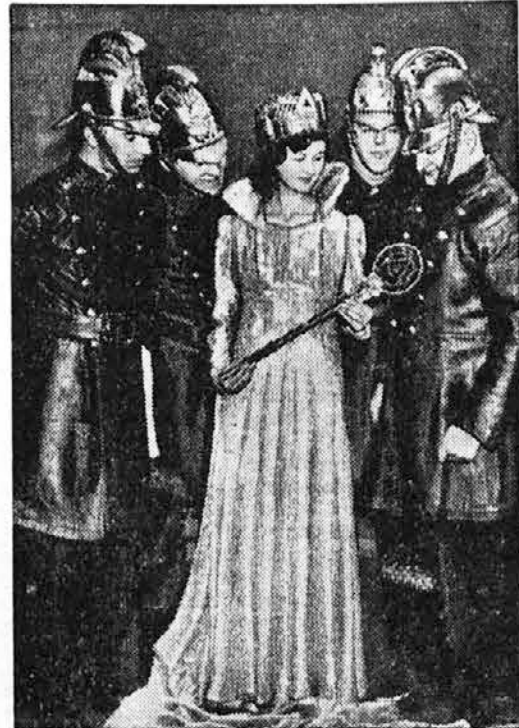
»Kraljica varnost«, kakršno so si izvolili gasilci v nekem angleškem mestu. V rokah drži svoje »kraljevsko žezlo«

13. januarja letos je poteklo ravno 100 let, odkar je bila darovana na tem ozemlju prva sv. maša. Prvi duhovnik je bil msgr. Pampellier. Danes je na tem otoku med milijon prebivalci 185.000 katoličanov, za katere skrbi 350 duhovnikov, 116 bratov in 1670 domačih misijonskih sester. Jubilej so obhajali zelo slovesno.