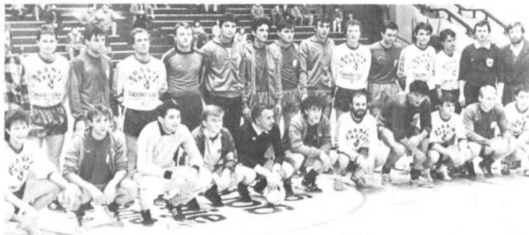
Rdeča dvorana srečna za Talce. Na sliki skupaj s tretjevrščenim Dinamom