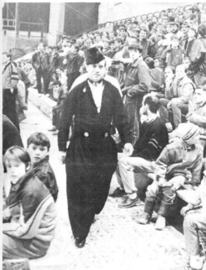
Italijanski in Nizozemski igralci so imeli tudi nekaj svojih navijačev. Na sliki navijač iz Nizozemske v njihovi značilni narodni noši