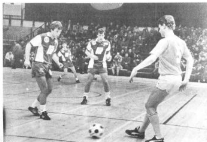
S tekme med Belgijci in Nizozemci

Najboljši so iz rok predsednika organizacijskega odbora prejeli lep pokal. Na posnetku pokal za Dinamo