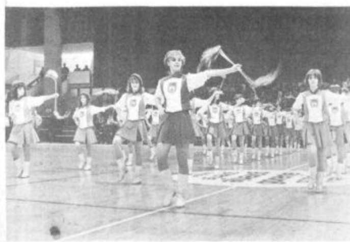
V slovesni otvoritvi turnirja so sodelovali mažuretko iz Ljubljane, Rudarska godba Velenje in skupina Kis iz Škal