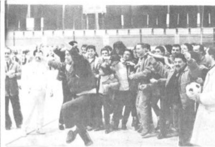
Takole so se Italijani »veselili« zadnjega mesta ...