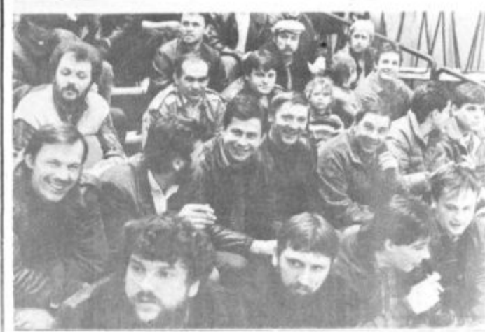
... Gledalci pa so se jim seveda smejali (S. Vovk)