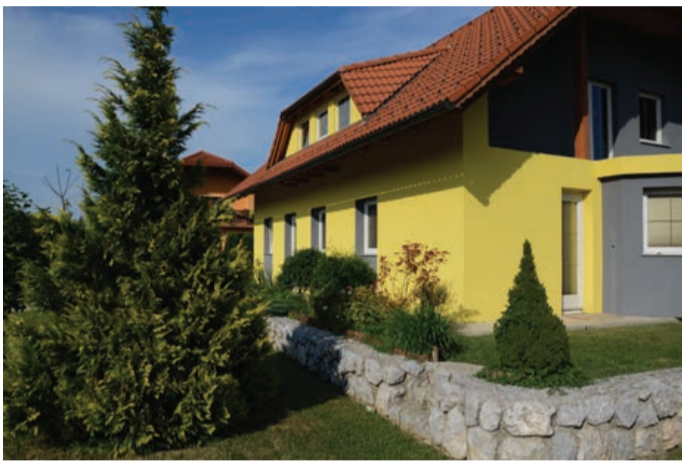
Družina Strelec iz Strelcev 12