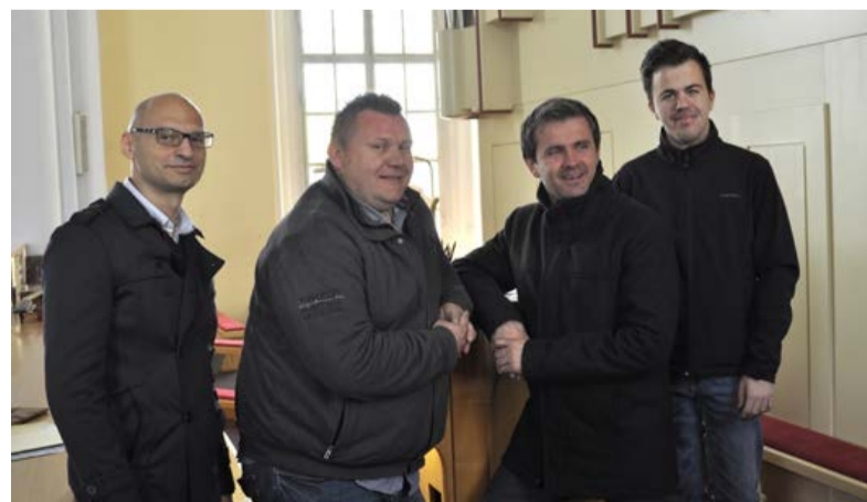
Organisti markovskih orgel

Naše orgle so orgle »Opus 91« iz Škofijske orglarske delavnice Maribor. Sestavljene so iz 1487 piščali, skupaj z jezičniki jih je v orglah 1543.