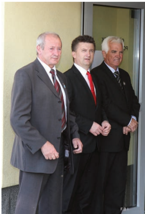
Župan in podžupana ob sprejemu