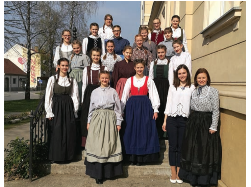
Zmaga v Požegi

Kaj naj še dodamo? Bila je izjemno zanimiva izkušnja za vse nas. Doživele smo res pestro paleto vsega – od strahu, vznemirjenja, naveličanosti, do popolnih make upov, paničnega preoblačenja,