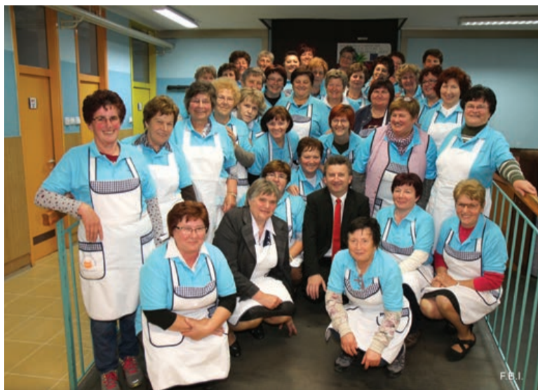
Brez naših žena pač ne gre