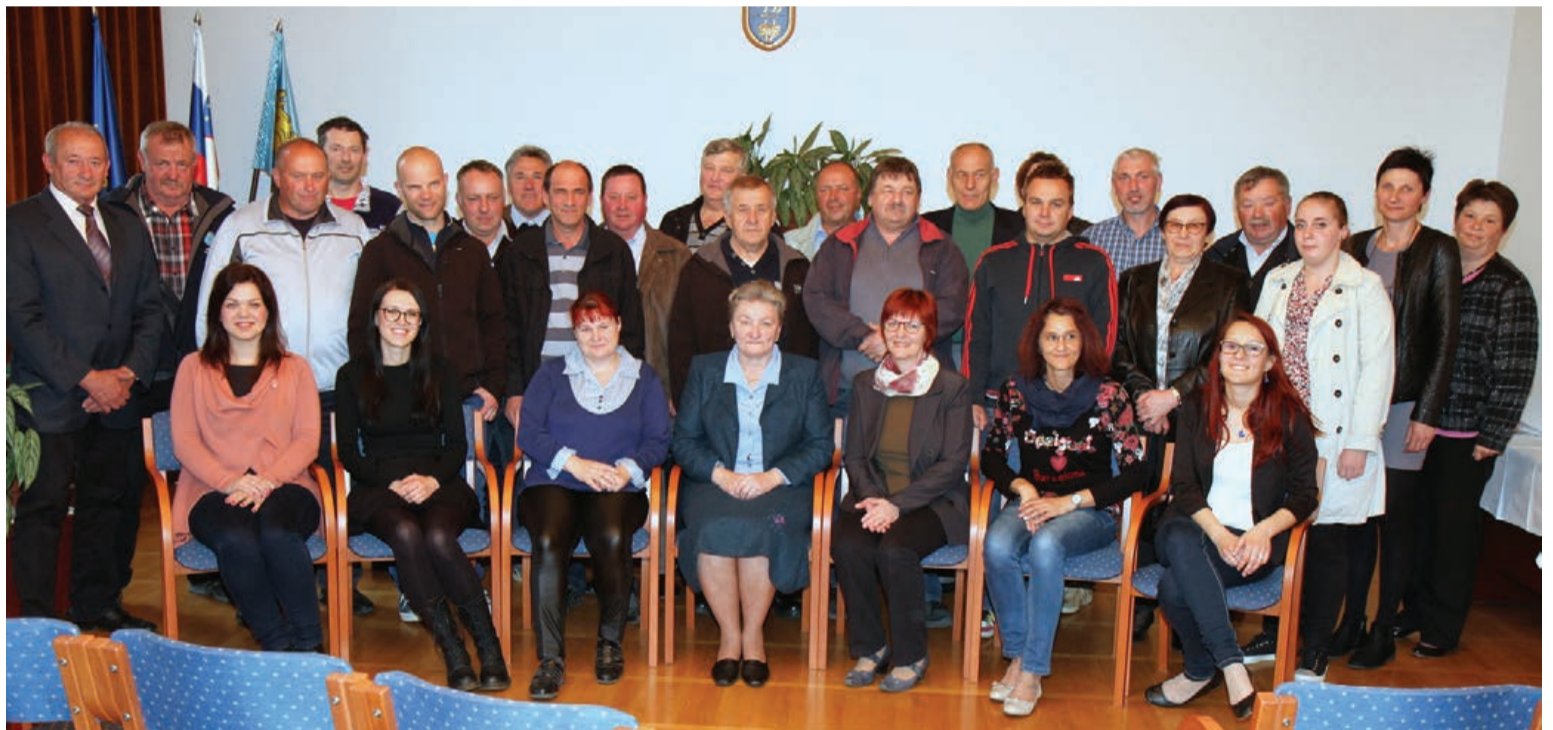
Krvodajalci so bili veseli vsakoletnega sprejema ob občinskem prazniku.