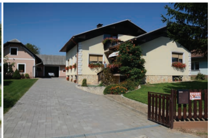
Družina Horvat iz Stojncev 55