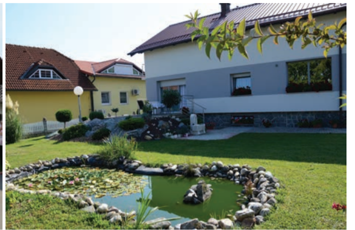
Družina Meglič iz Zabovcev 4 d