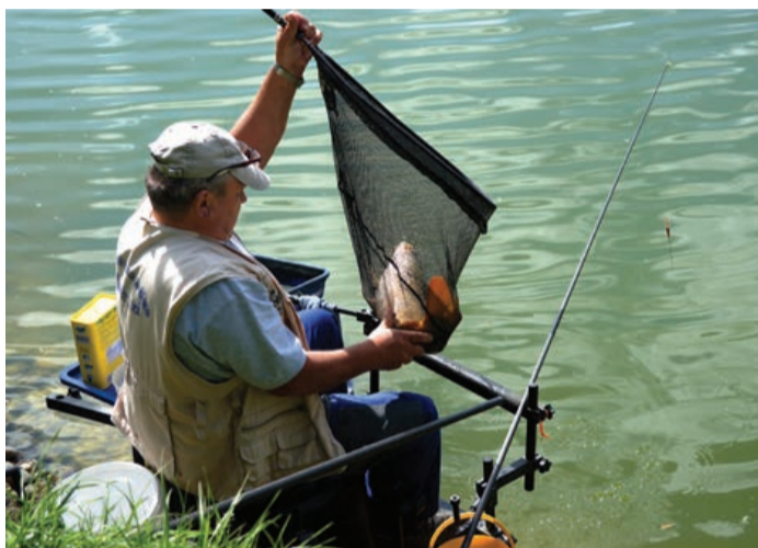
Priprave na ribolov