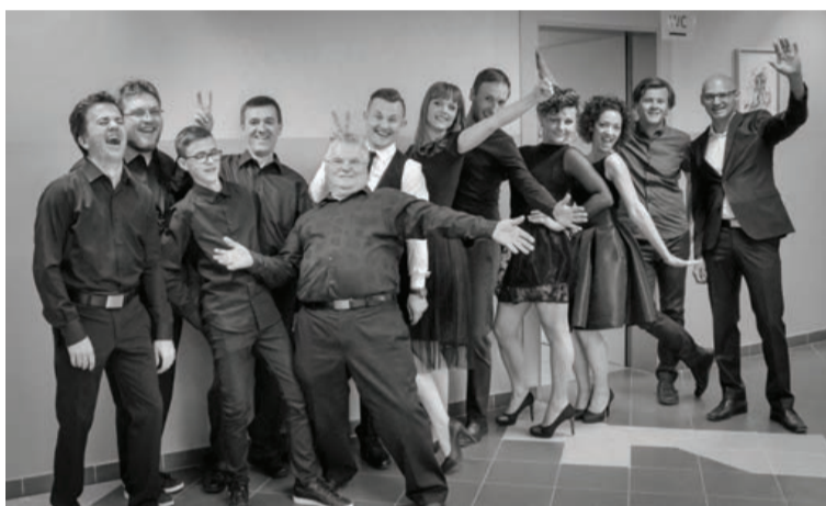
Tako veselo vzdušje je vladalo že pred nastopom.

imenu skupine PopKORn posebej zahvalili Občini Markovci za vso podporo pri pripravi, organizaciji in izvedbi koncerta kot nepozabnega skupnega darila ljubi-