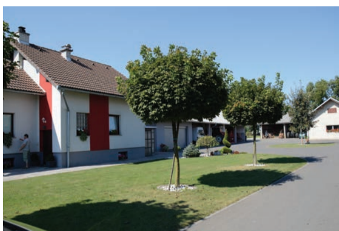
Naj kmetija je kmetija družine Slana iz Nove vasi 41.