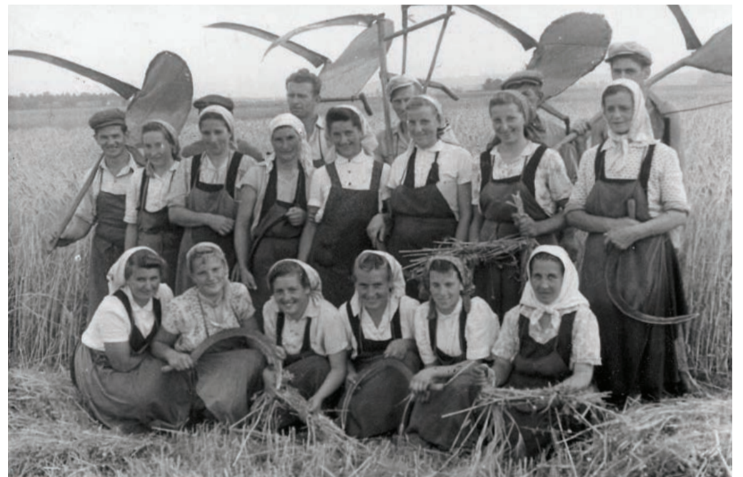
Sobotinske žanjice in kosci pšenice pri Rekonovih leta 1947.

Ob navedeni tematiki se naj dotaknem še pojma o » navezanosti « kmetov na zemljo (kmetijo). V fevdalnem obdobju, ko je kmet obdeloval in se tudi preživljal na zemlji, ki je bila last zemljiškega gospoda, je bil s pravno prisilo in tudi s prisilo tako rekoč edine možnosti za preživetje, navezan na kmetijo . Šele po zemljiški odvezi, ko je kmet po plačani odškodnini postal tudi lastnik zemlje, se je oblikovala tudi večja čustvena navezanost na zemljo . Pri tem se prepletajo tako čustveni kot gmotni nagibi. Kmetu zemlja ni pomenila le ekonomske vrednosti, temveč je bila tudi temelj ugleda