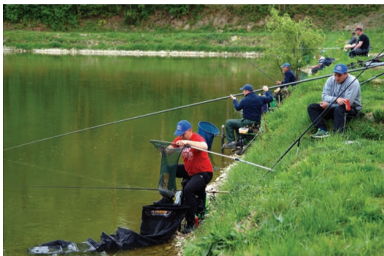
Lovljenje s plovcem za pokal občine