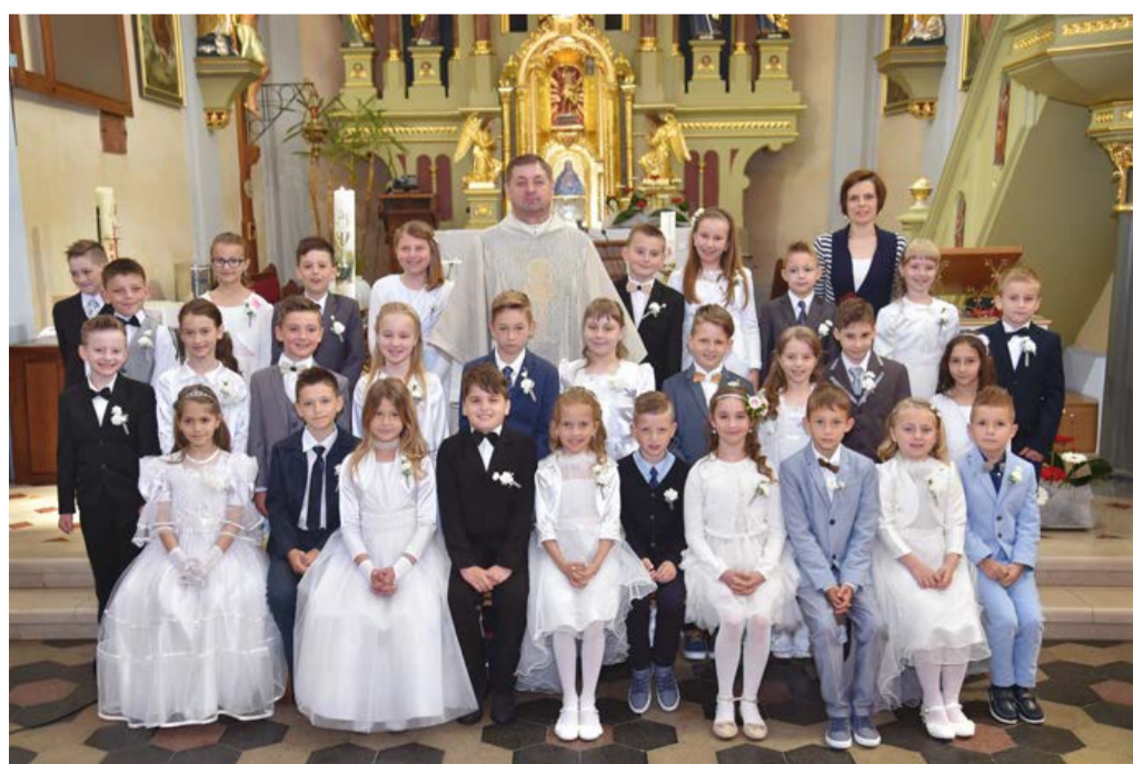
Prvo sveto obhajilo je letos prejelo 30 tretješolcev