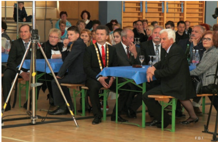
Z zanimanjem smo prisluhnili tudi kulturnemu delu programa.