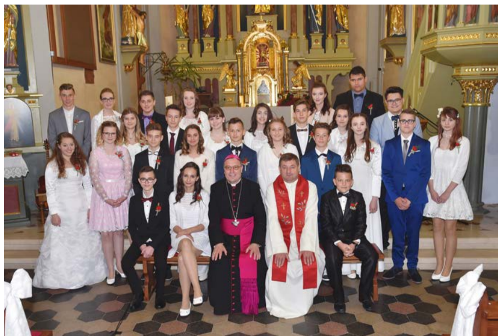
Letošnji birmanci, devetošolci