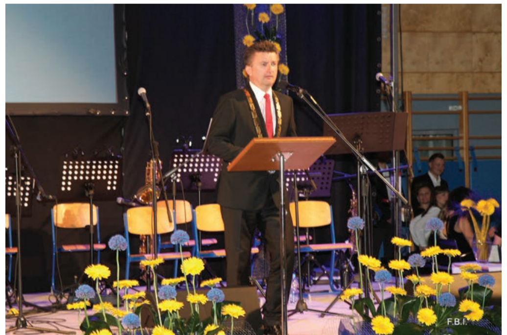
Nagovor župana Milana Gabrovca

v vrednosti 943.000,00 €, junija smo izbrali izvajalca za izgradnjo kanalizacije v Novi vasi v vrednosti 850.000,00 €, v Bukovcih in Stojncih smo menjali energetske potratne svetilke v vrednosti 14.000,00 €. Za izgradnjo in posodobitev javne razsvetljave smo namenili 28.000,00 €. Nov vodovodni priključek in fontana na pokopališču sta nas stala 18.000,00 €. Za vzdrževanje cest in zimsko službo smo namenili 140.000,00 €, poleg naštetega pa občanom subencioniramo tudi omrežnino pri vodi in smeteh ter v celoti pokrivamo odlaganje salonitnih plošč na deponijo v Markovcih ali na Čisto mesto v Gajkah. Izdatno tudi financiramo naša društva, da lahko izvajajo svoje programe in s tem prispevajo h kvalitetnemu družbeno političnemu življenju naše občine. Z nepovratnimi sredstvi podpiramo tudi kmetijstvo, obrt in drobno gospodarstvo.« Župan je v svojem nagovoru povedal tudi, da se zaveda odgovornosti, povezane z razvojem naše občine. Veliko imamo še načrtov, ki jih je potrebno izpeljati. »Eno od dveh načrtovanih krožišč se pri trgovini Špic že gradi, drugo, pri Kmetijski zadruzi, se bo začelo graditi v kratkem. V delu Markovcev želimo s prostorskim planom urediti zazidljivo območje za gradnjo individualnih objektov. Smo občina, ki skrbi za prometno