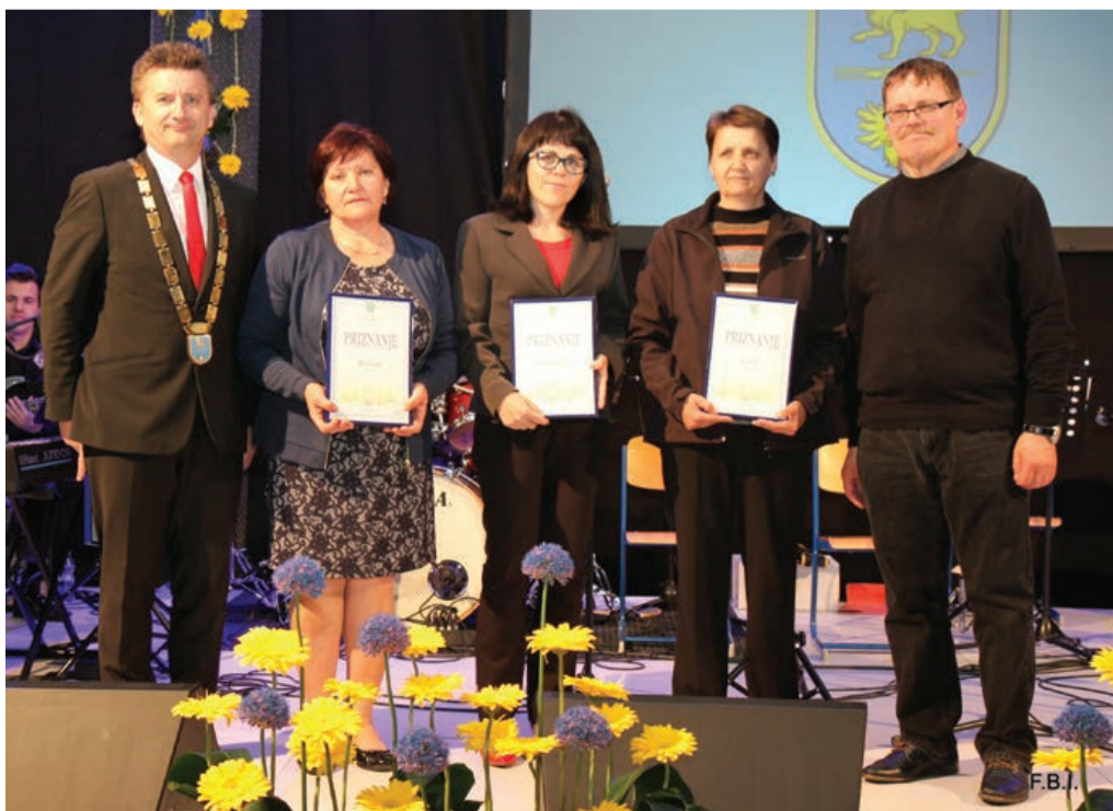
Prejemniki priznanj Turističnega društva Občine Markovci ...