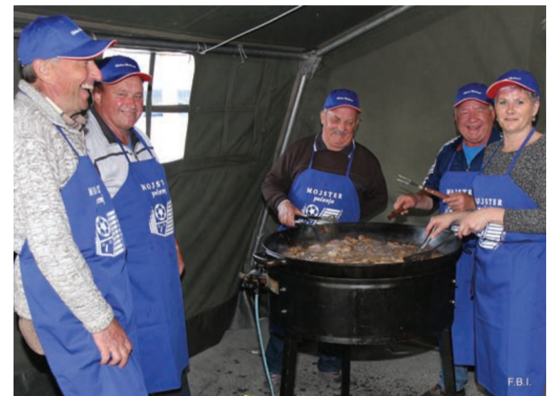
Društva so poskrbela za hrano