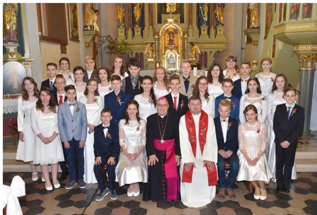
Letošnji birmanci, oba razreda osmošolcev