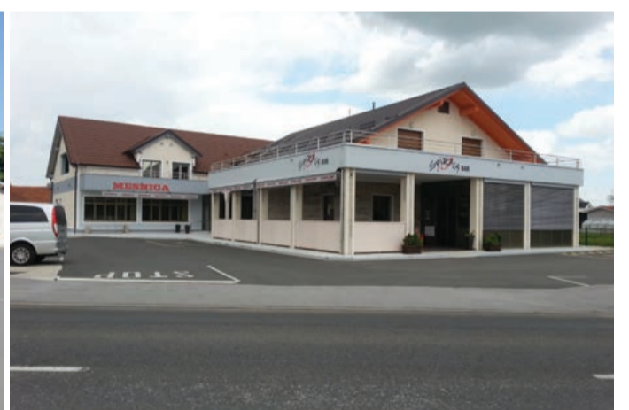
Naj objekt leta 2016 je poslovni objekt Spirala.