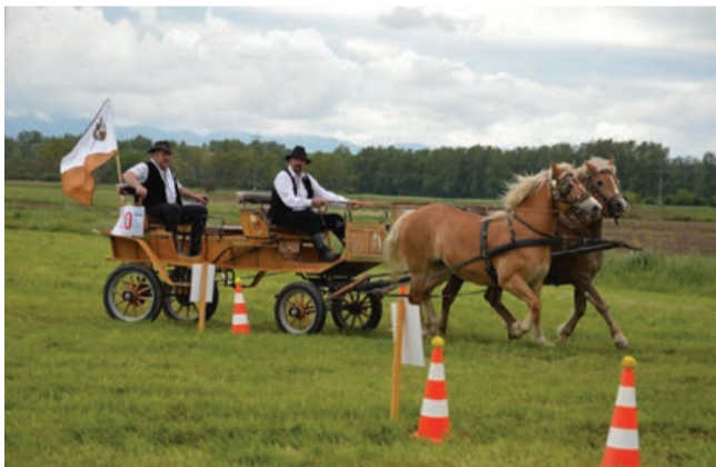
Konjeniška tekma v Središču ob Dravi