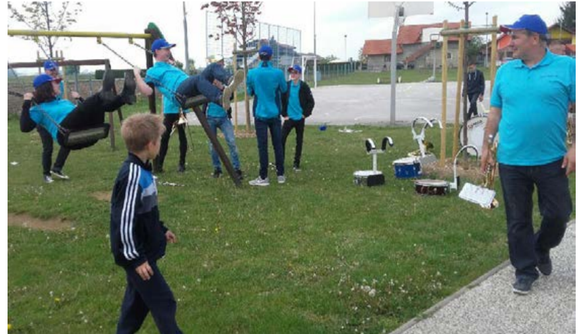
Mladi godbeniki so se po zaigrani budnici zazibali na igralih.