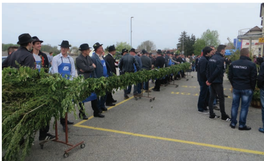
Cvetna nedelja v znamenju zelenja in vaških presmecev