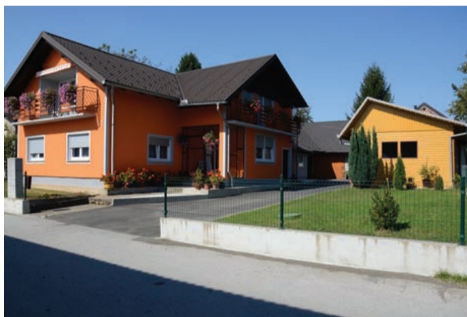
Družina Kirbiš iz Markovcev 13