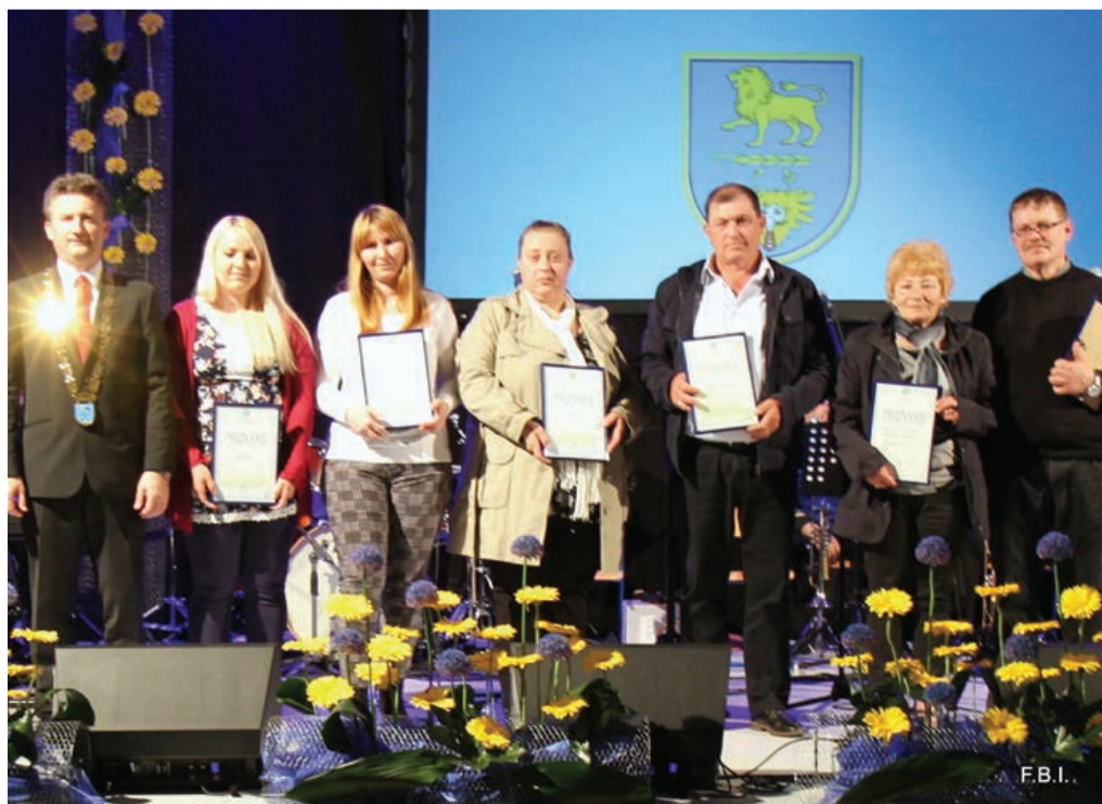
... v akciji Ocenjevanja okolja za leto 2016.