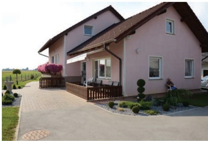
Družina Plohl iz Sobotincev 11