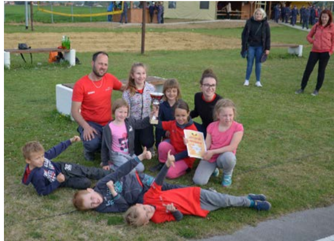
Prvenski pionirji so v Stojncih osvojili prvo mesto.

Vaški odbor je po veliki noči z novimi zastavami okrasil vas in s tem naznanil pričetek praznovanja občinskega praznika. V sklopu vseh prireditev, ki so se dogajale po celotni občini, je v Prvencih bilo organizirano tradicionalno gasilsko tekmovanje Liga 2017 v hitrostni vaji s sedmimi gasilci. Prvo mesto v moški ekipi so dosegli člani iz PGD Žamenci, drugo