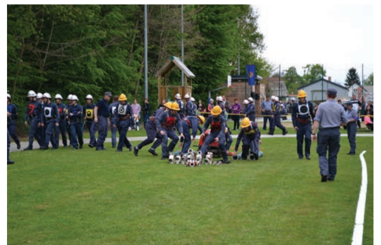
Utrinki iz praznika gasilcev ter sobotnega gasilskega tekmovanja za kipec sv. Florjana.