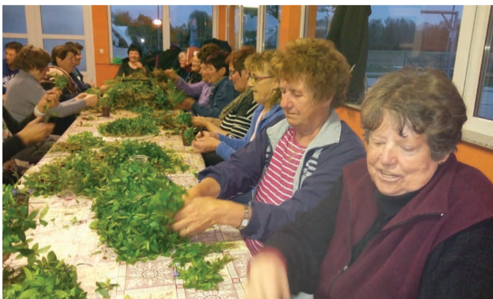
Pletli so tudi v Novi vasi.