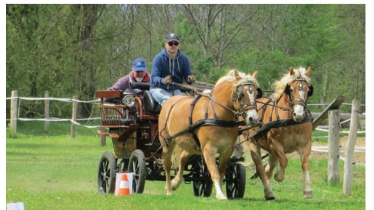
Prikaz spretnostnega jahanja in vožnje s starodobniki in konjskimi vpregami