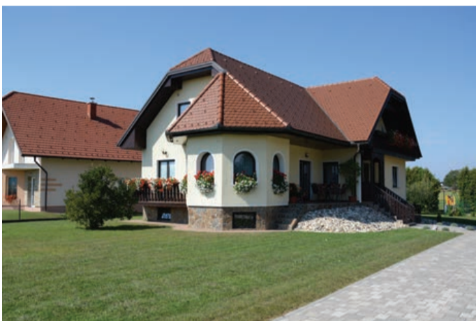
Družina Kostanjevec iz Bukovcev 98