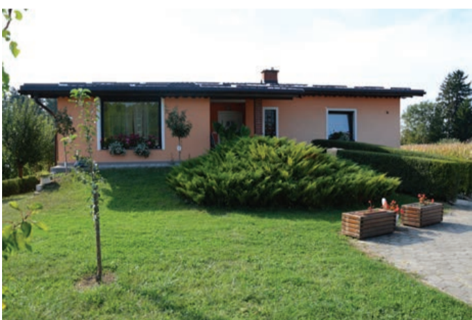
Družina Golob iz Prvencev 1b