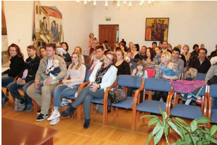
Na sprejemu se je zbralo 47 novorojencev.