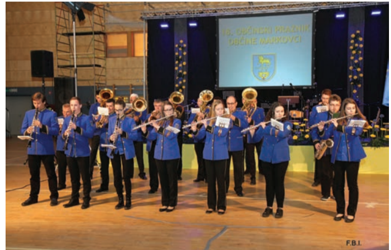
Zvoki godbe so napolnili dvorano.