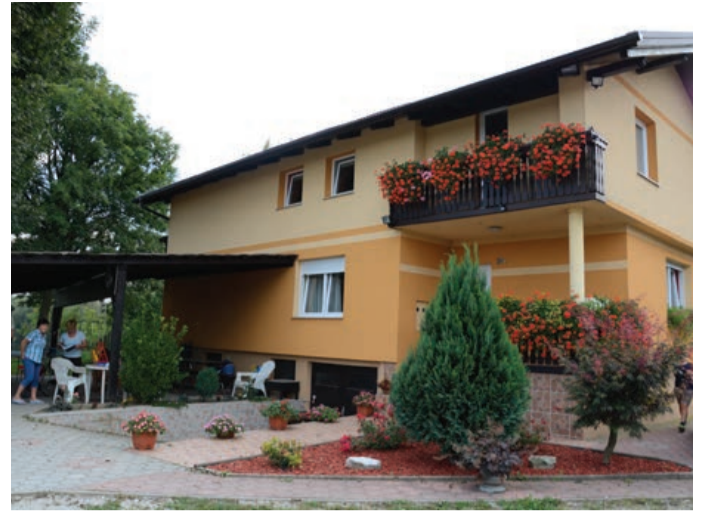
Družina Šilak iz Nove vasi 24 b