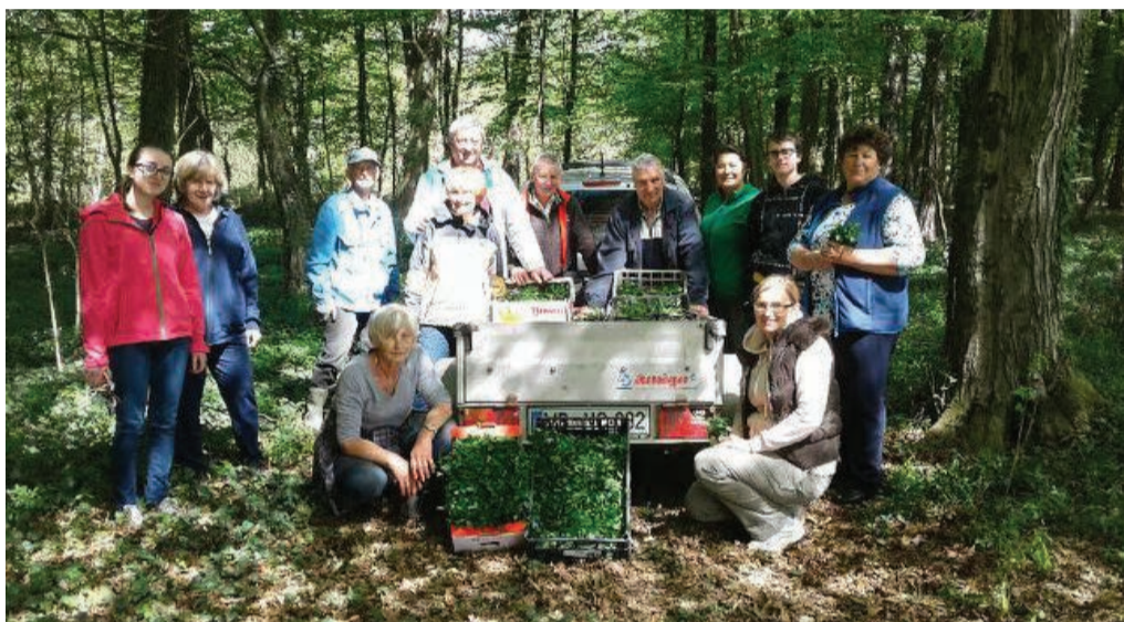
Stojncani ob nabiranju na velikonočni ponedeljek.