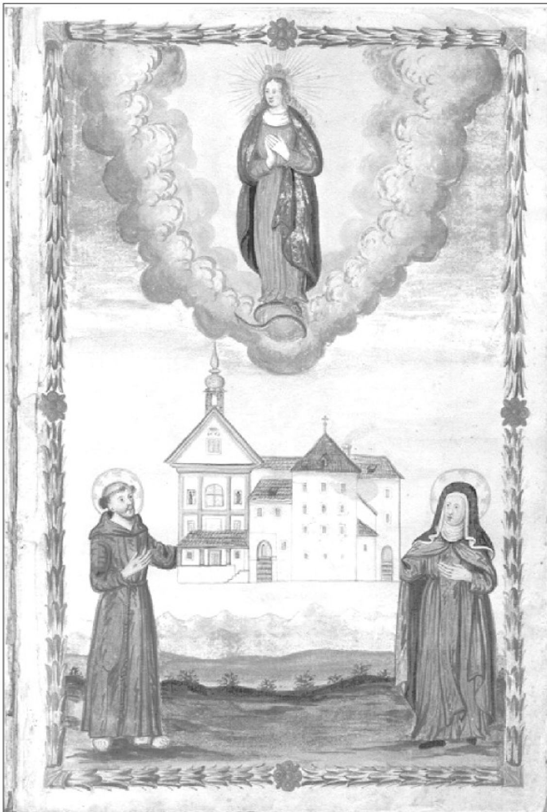
Zgodnejša upodobitev samostana klaris v Škofji Loki Arhiv uršulinskega samostana Sveti duh pri Škofji Loki