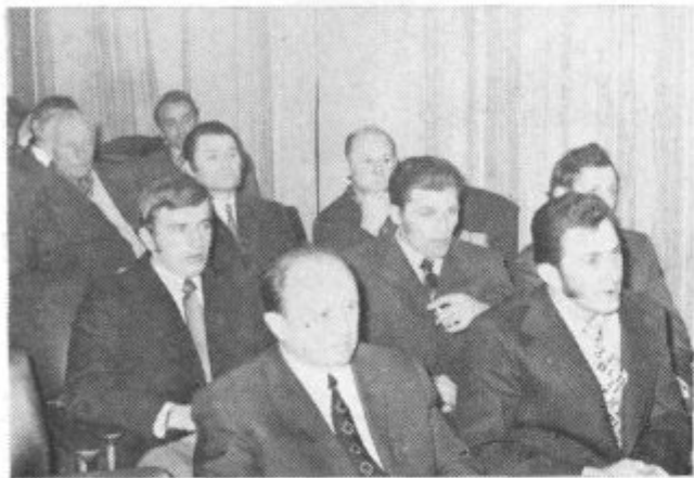
Pevci na občnem zboru