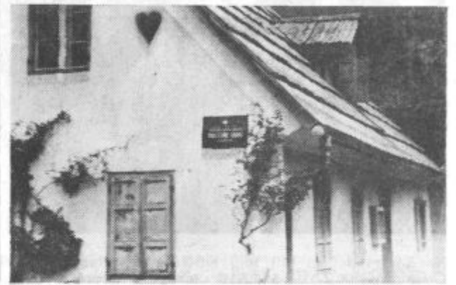
Mladoporočenci sklenejo zakonsko zvezo v oslavnostni izbiri zasebne hiše

Skratka, mladi so določeno gibalno in gonilna sila življenja v Lučah.