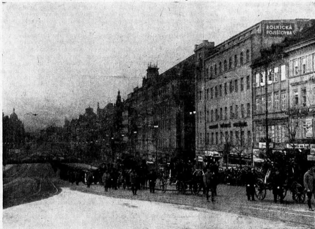
Sprovod sestre Renate Tirševe prolazi Vaclavskim namjestima