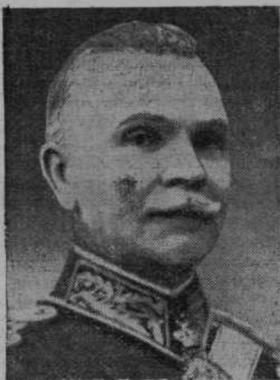
General Argesanu, predsednik nove vlade na Romunskem