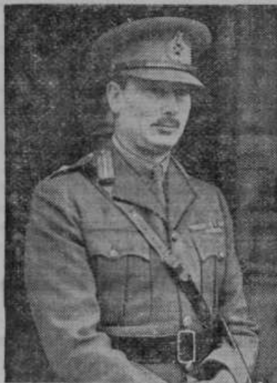
Angleški vojvoda iz Gloucestra je general Francozom na pomoč poslane angleške armade