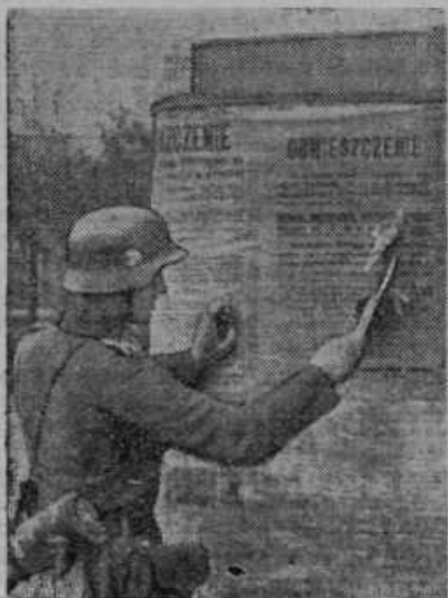
Nemški vojak čita v poljaskem pristanišču Gdinja, katerega so zasedli Nemci, Hitlerjeve proglase

precej izpopolnjene vrzeli, ki so doslej bile na posameznih šolah.