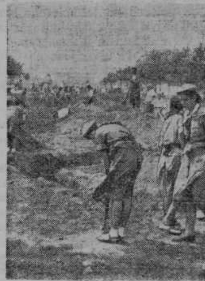
Dekleta kopijejo strelske jarko za obrambo Varšave

je delo naj mirno dalje izvršujejo in po preteku pogodbenega roka se bodo lahko nemoteno vrnili domov. Denar lahko še naprej pošiljajo v domovino po uradni poti. Ta določba velja tudi se-