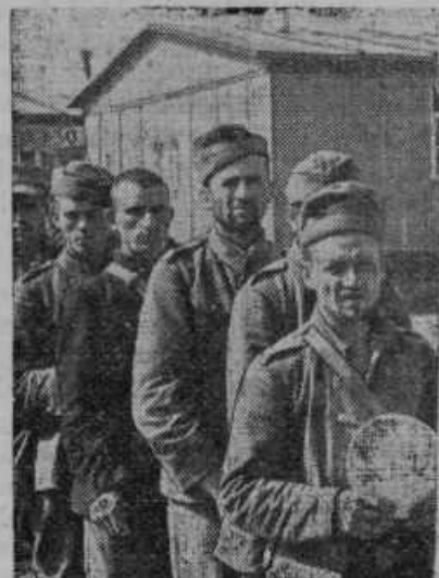
Od Nemcev zajeti poljski vojaki

Sirom Prekmurja. Z odlokom prosvetnega ministra so pred kratkim bili v Prekmurju nastavljeni naslednji učitelji in učiteljice: Nachtigal Gl-