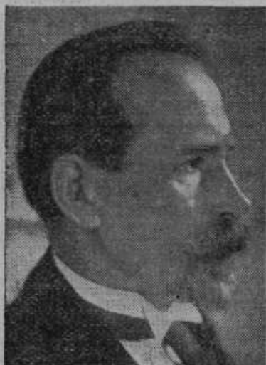
Smetona, predsednik Litve, katero hoče sovjetska Rusija spraviti pod svoje pokroviteljstvo