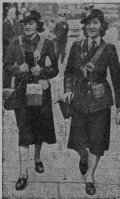
Anglija je vpeljala ženske sprevodnike za omnibuse

daj za one, ki so po nepravilni poti prekoračili državno mejo. Zaslužek naših delavcev je letno večmilijonski in je za prekmurske delavce in vse gospodarstvo življenjskega pomena. Z njim si namreč nabavljajo kmetijsko orodje, gradijo lastne domove in največkrat rešujejo prezadolžena gospodarstva pred davčnimi rubeži. — Če bi se razmere radi vojnih dogodkov v Evropi toliko spremenile, da bi izseljevanje sezoncev bilo onemogočeno, bi država tem tisočem morala preskrbeti primeren zaslužek pri zaposlitvi doma. Toda sedaj nam še ni treba z duhom kloniti, temveč lahko z zaupanjem zremo boljši bodočnosti nasproti.