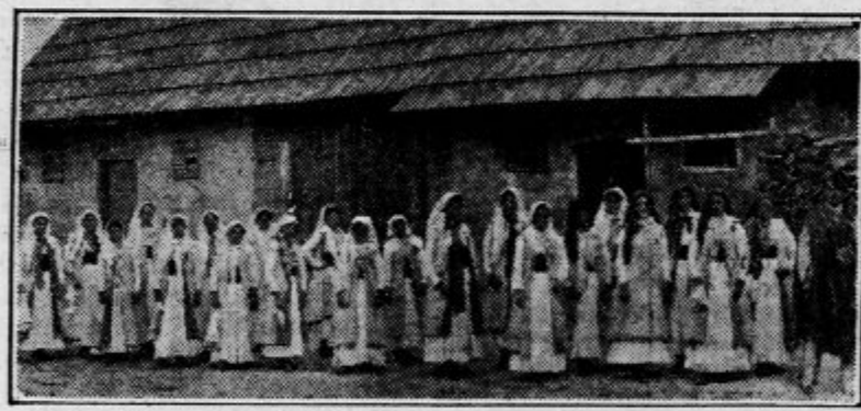
Kočevske žene v domači obleki

Dalje proti vzhodu se razprostira v severnem delu največja visoka gozdna planota Kočevska, Rog (Hornwald, 1100 metrov). Njegov južni odrastek je Poljanska gora, ki dela že zahodni gorski obod ravnoti, nizki Beli krajini. Tod uspeva že vinska trta in breskev in