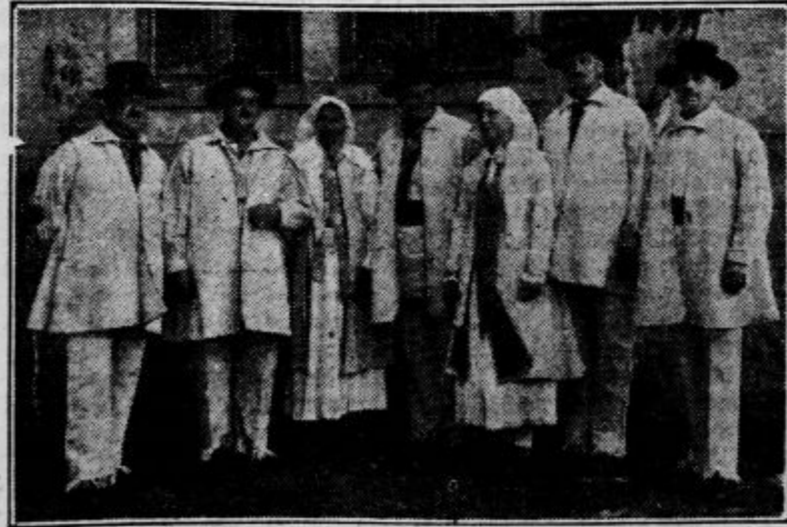
Kočevarji v svojih nošah

Vrste Kočevarjev so se radi tega začele doma vedno bolj krčiti, še bolj pa se je zmanjšalo njihovo število, ko se je okoli l. 1880. odprlo izseljevanje v Ameriko. Ze ljudska štetja, ki jih je vršila bivša Avstrija vsakih deset let od 1869 do 1910, so pokazala grozeče padanje števila doma živečih Kočevarjev, vkljub temu, da je bil med pripadnike nemškega občevalnega jezika prištet tudi marsikateri Slovenec. L. 1880. je bilo na ta način naštetih še 19.029 Kočevarjev, l. 1921. pa je jugoslovensko ljudsko štetje, ki se vrši, kakor po vseh državah kulturnega sveta, na podlagi izpraševanja po materinem jeziku, ugotovilo na tleh kočevskega jezikovnega otoka samo še 12568 prisotnih ljudi nemškega materinskega jezika. Glej članek »Statistika kočevskega nem-