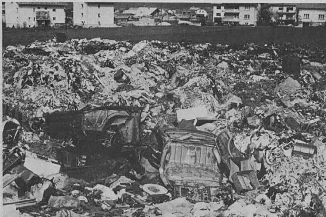
»Cudovita« panorama Žirov

– Nujno bo treba analizirati delo delegacij in delegatov in si prizadevati za utrjevanje in razvoj delegatskega sistema in odnosov.