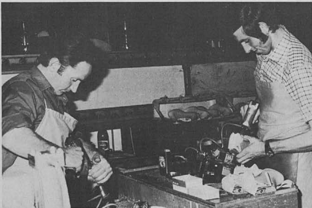
Teškoči trak je povečal produktivnost

Veliko se opaža barvnih kombinacij, posebno pa kontrastnih barvnih vezalk (rumene, rdeče, modre). Pri najnovejših inozemskih izdelkih