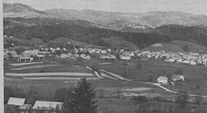
Koliko je ostalo od idilične vasi