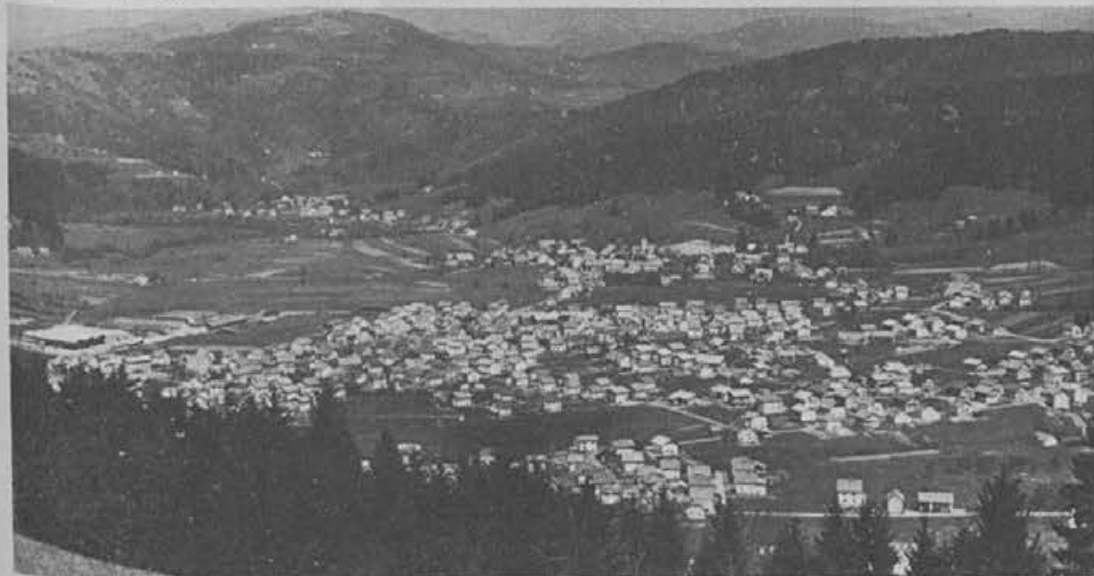
Zirovska dolina se je zlasti razvijala v stanovanjskem smislu

- naloge in obveznosti, ki jih je krajevna skupnost sprejela v dogovoru o temeljih družbenega plana občine.