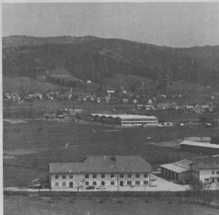
Kako bo s čevljarško šolo v Žireh

segli dohodkov din 3.300 mesečno na družinskega člana, naj se oglašijo v kadrovski službi, kjer bodo vložili zahtevek za priznanje pravice do prejema otroškega dodatka.