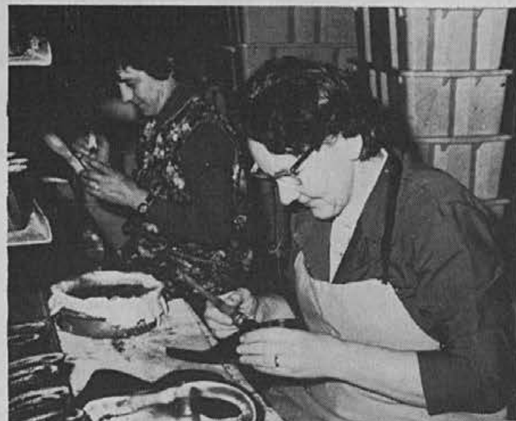
Ali bo dobro držalo?