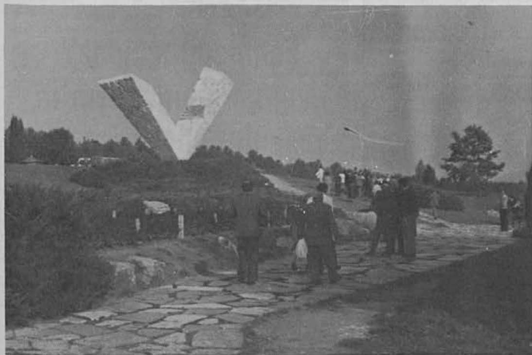
Velika šolska ura v Kragujevcu