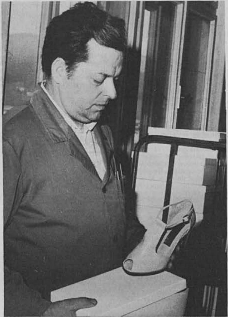
Še delamo napake