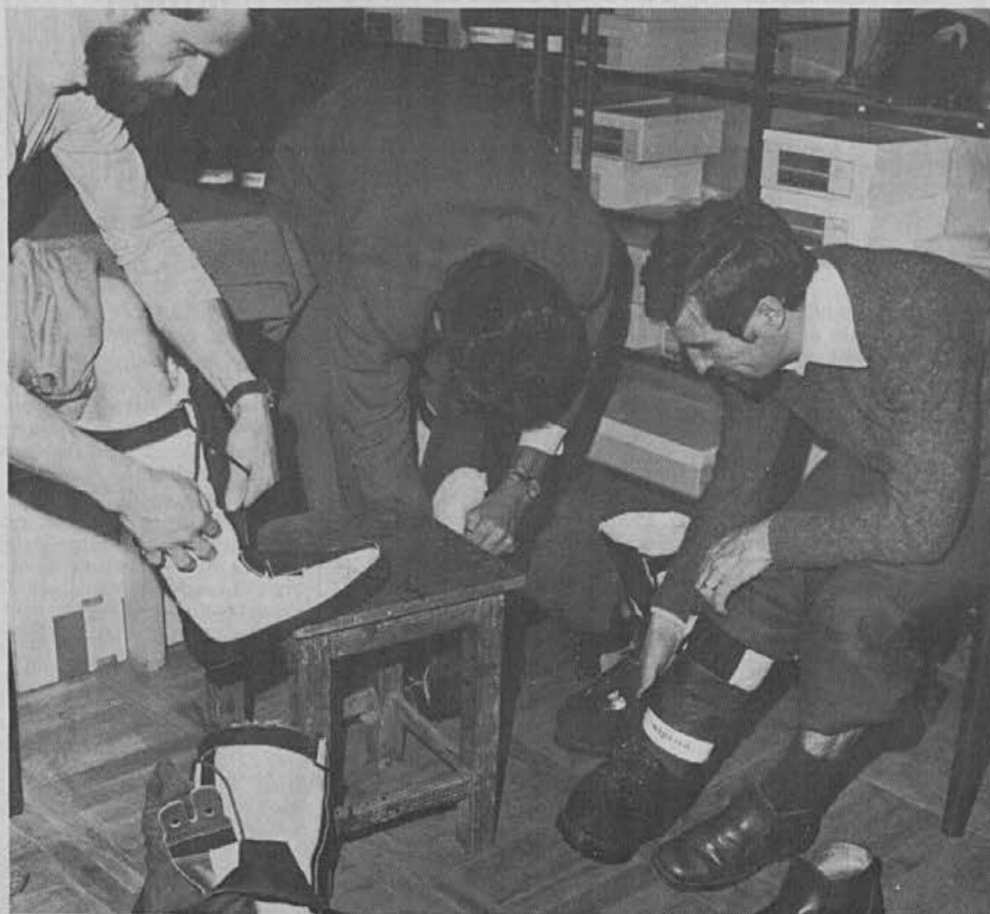
Pred uporabo je bilo treba preizkusiti

Jugoslovanska alpinistična odprava Everest 79 šteje 25 alpinistov in 20 Šerp, skupaj torej 45 ljudi. Za prenos opreme, hrane in ostalega materiala za delo na gori, so potrebovali okoli 700 nosačev, od katerih je vsak nosil cca 30 kilogramski tovor. Odprava je postavila šest taborov. Bazni tabor je pravo veliko šotorsko naselje v katerem imajo kuhinjo in skladišča. Razen baznega tabora je postavljeno še pet višinskih taborov, od katerih se prvi imenuje Alpina.