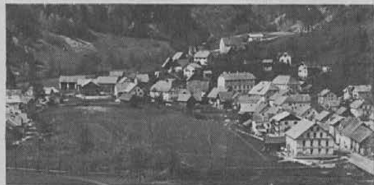
Stare Žiri s Tabrom postajajo spomenik

V našem časopisu pa sproti spremljati vse, kar v tovarni »pogruantamo« in hkrati spodbujati delavce, da se v to vključijo.