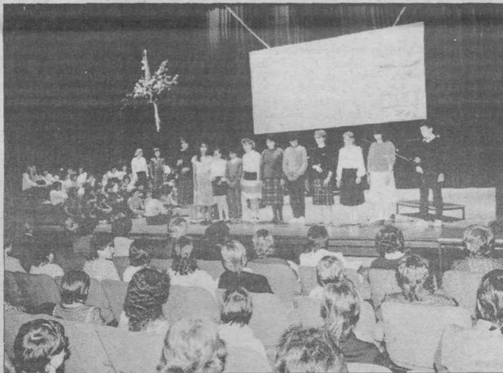
Prizor s prireditve v kulturnem domu Španski borci