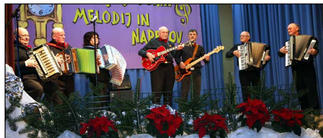
Nastop Vaških godcev iz Andraža

Številni obiskovalci so z burnimi aplavzi nagradili