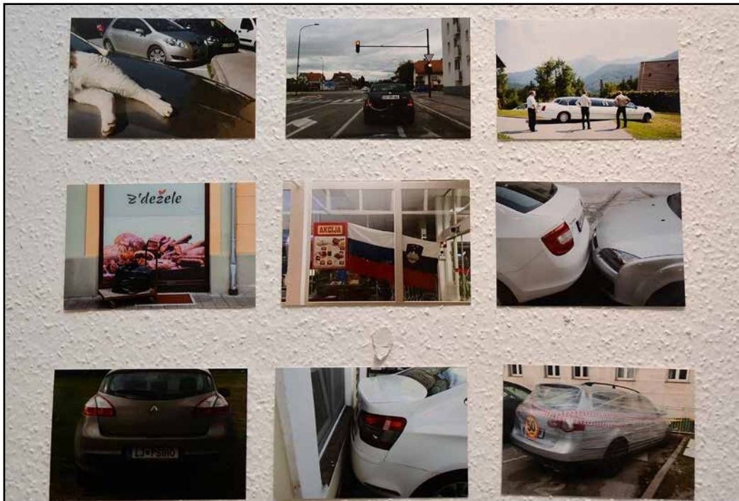
Nekaj razglednic z neobičajnimi motivi