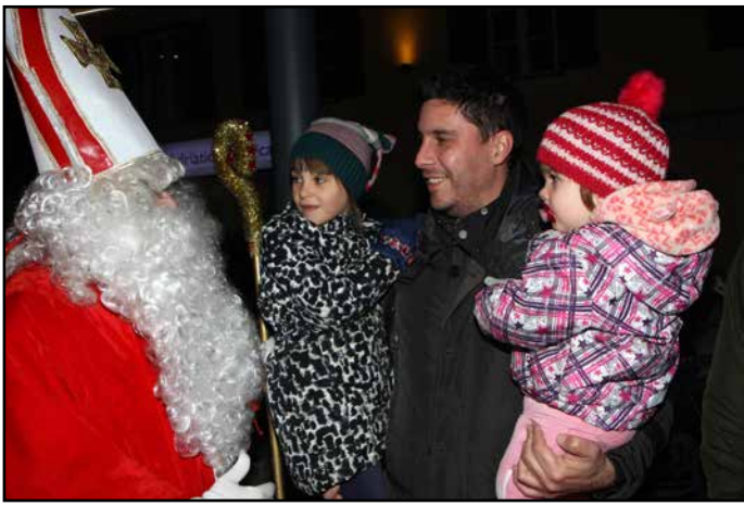
V Žalcu se je Miklavža razveselilo na stotine otrok.