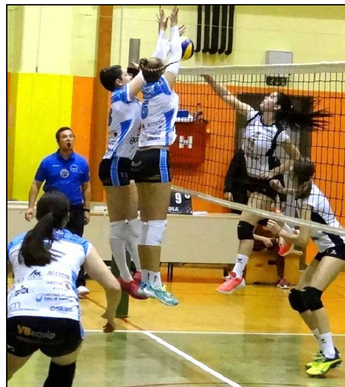
S povratne četrtfinalne tekme med Alianso Šempeter in Kemo Puconci

Polfinalni tekmi in finalno srečanje v Hočah so bile na sporedu po zaključku redakcije, včeraj in danes, 21. in 22. decembra. V polfinalu so odbojkarice Alianse Šempeter igrale proti Novi KBM Branik, odbojkarice ekipe Calcit