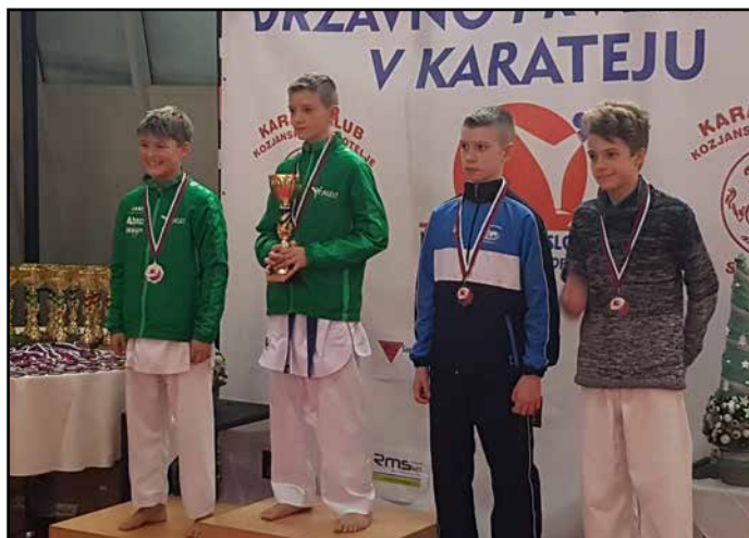
Na zmagovalnem odru