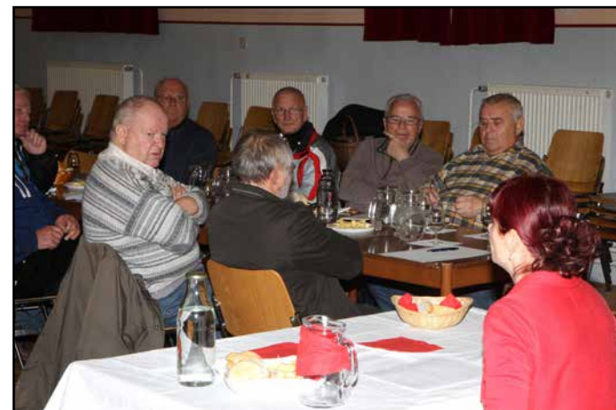
Med delovno pokušnjo vin

Skupno so pregledali 65 vin, večinoma belih sort, med katerimi je bilo kar nekaj vin, ki nakazujejo, da bodo postala odlična vina. Za dokončno oceno je še prezgodaj, to bodo pridobili na ocenjevanju vin aprila naslednje leto. Dobili pa so morda vtis o tem, kakšna vina so letos pridelali, in se seznanili z nekaterimi pomanj-