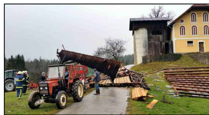
Na kmetiji Vodušek, pri cerkvi sv. Urbana na Dobroveljah, je močan veter odkril del strehe na gospodarskem poslopu.