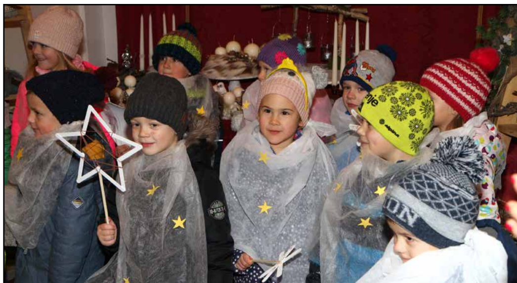
Prazničnega časa se gotovo najbolj veselijo otroci.

Božiček že od prejšnjega vikenda potuje po dolini in obdaruje otroke. Mudil se je že na gradu Komenda na Polzeli. Prav tako je minulo soboto obiskal otroke na kmečki tržnici v Preboldu, nocoj pa bo na prireditvenem prostoru na Šlandrovem trgu obiskal žalске otroke.