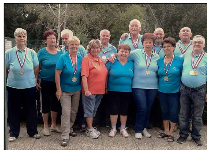
Športniki DU Žalec na enem od letošnjih tekmovanj

Na državno prvenstvo sta se uvrstili ekipa ribičev in ekipa, ki se je pomerila v metu pikada. S tem zaključujejo zelo uspešno športno sezono v DU Žalec, kar je tudi dobra spodbuda za naslednjo tekmovno sezono. D. N.