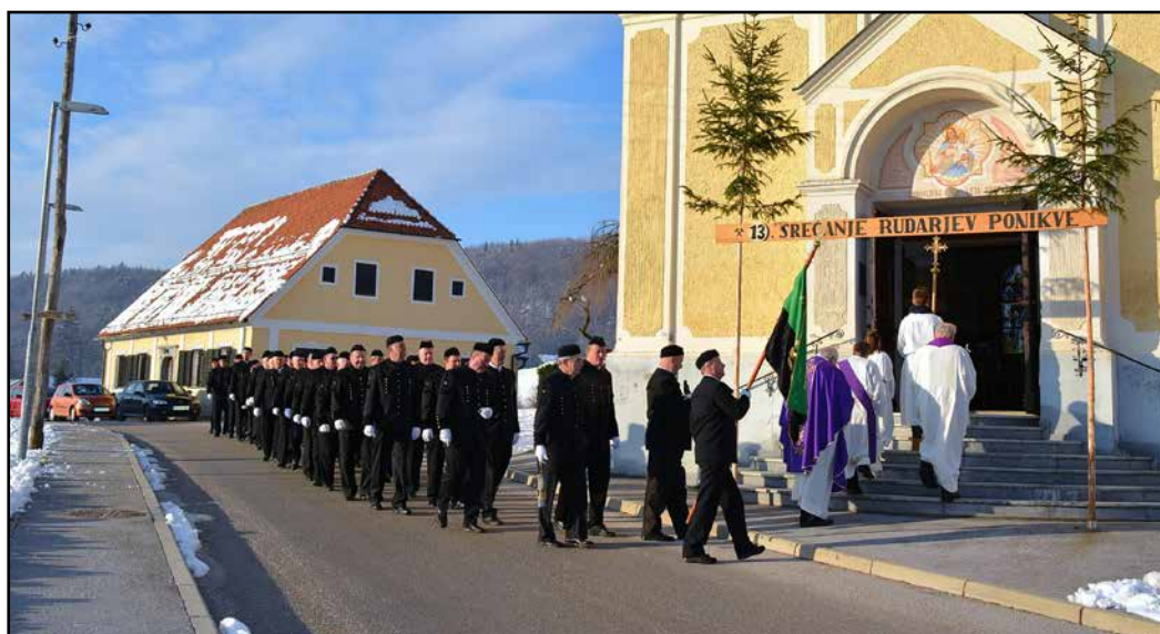
Rudarji so v paradi odšli v cerkev k sveti maši.