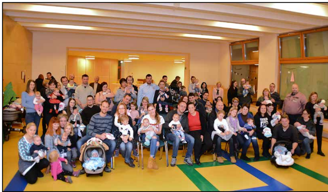
Starši s svojimi novorojenčki in organizatorji srečanja