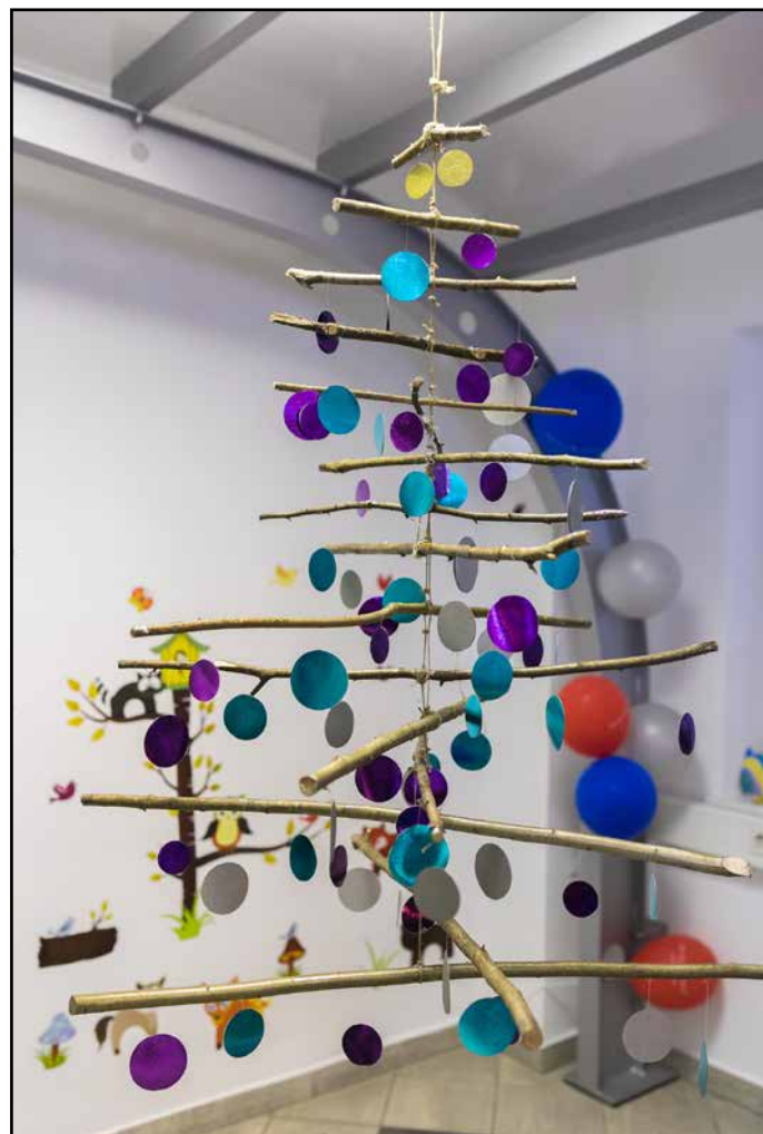
1. mesto si je prislužila viseča smrekica.