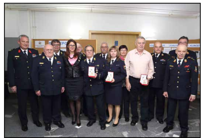
Udeleženci slovesnosti iz savinjsko-šaleške regije z ministrico za obrambo RS Andrejo Katič

Slavnostna govornica je bila ministrica Andreja Katič, ki je v nagovoru poudarila, da so vrednote, kot so pomoč sočloveku v stiski, prizadevanje za strokovni razvoj, tovarištvo, solidarnost, domoljubje, skrb za slovenski jezik in krepitev narodnostne zavesti, vrednote, na katerih te-