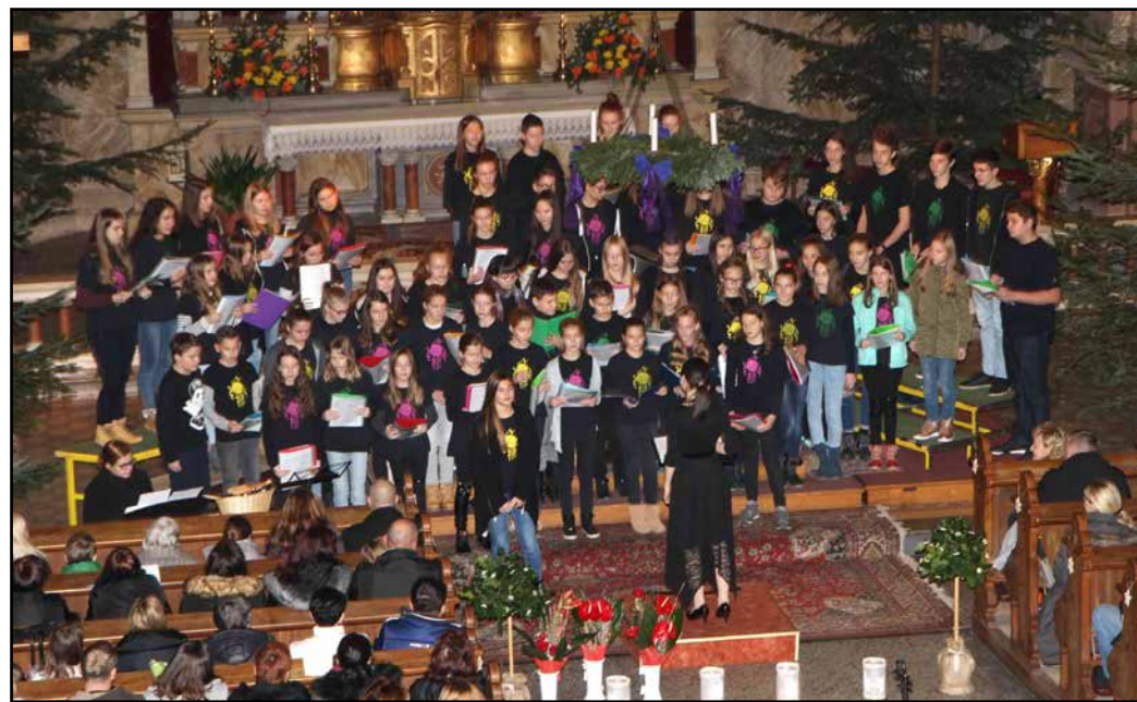
Mladinski pevski zbor I. OŠ Žalec