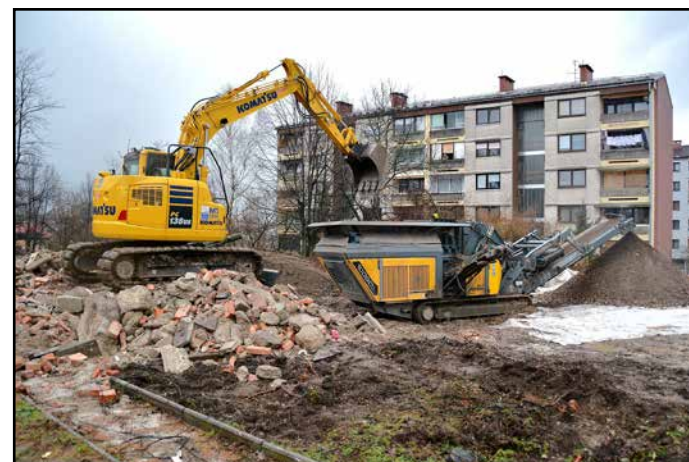
Začeli z odstranitvijo stare zgradbe

V tem predprazničnem času so svojo odločitev že začeli