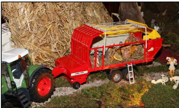
Izvirnost postavljavcev ne pozna meja