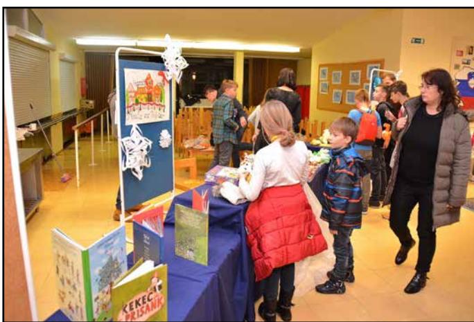
Na prazničnem bazarju so zbrali približno polovico dobrodelnih sredstev.