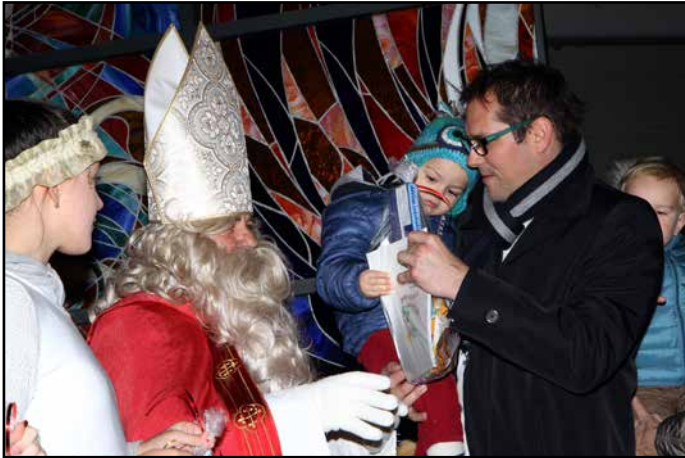
Na Polzeli so otroci letos željno pričakovali s. Miklavža.