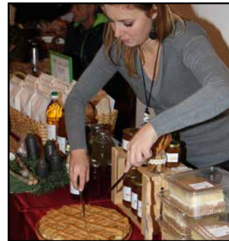
Prazniki ne minejo brez sladkih in drugih dobrot.

Ostale dni do 1. januarja pa si lahko jaslice ogledate po dogovoru na telefonski številki 031 230 021. T. Tavčar