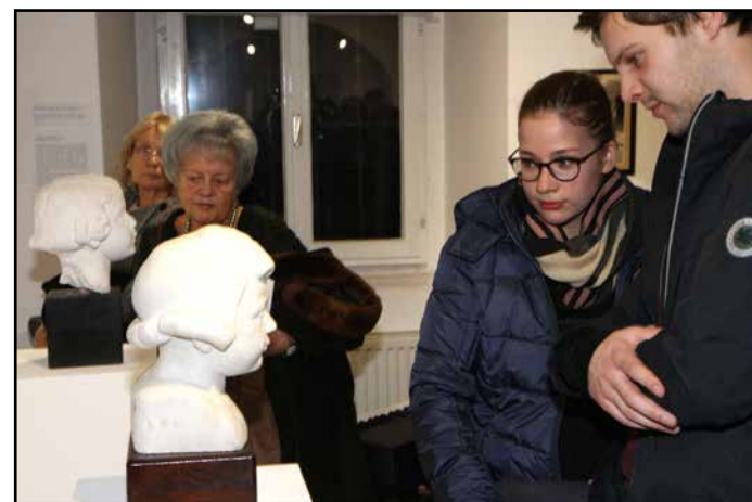
Portreti otrok še danes vzbujajo občudovanje.