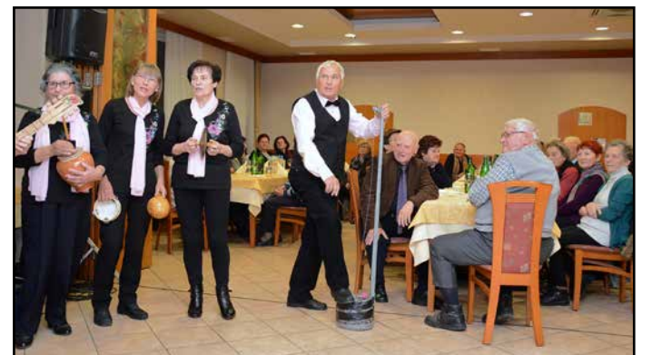
Starejši v Šempetru so uživali ob nastopih šolarjev in glasbi skupine Šembis.