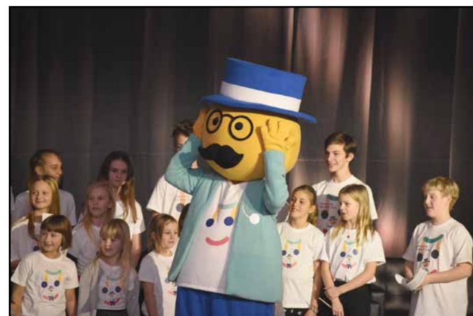
Simpatična nova maskota Savinko bo poslej stalna spremljevalka prireditev.