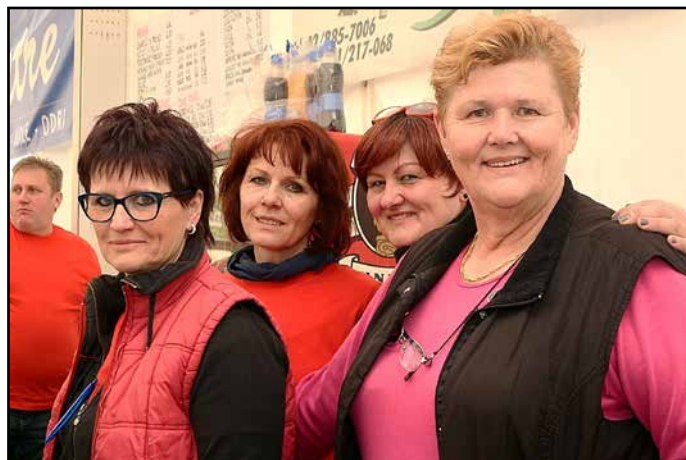
Ramšakovke štiri sestre iz Lok so "gor rasle" pod eno najstarejših slovenskih lip in še vedno držijo skupaj.