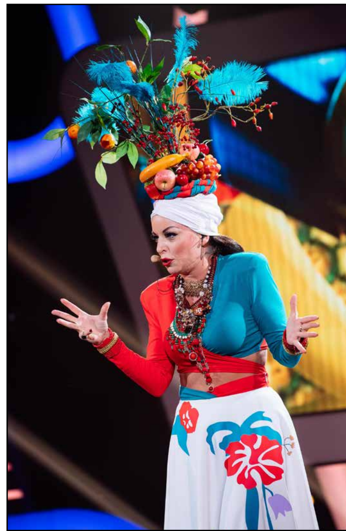
Ena izmed mnogih preobrazb

Za enim samcatim nastopom je ogromno vaj, priznava pevka našega znanega ansambla Zaka pa ne. »Vaj je res veliko. V enem tednu je potrebno osvojiti ko-