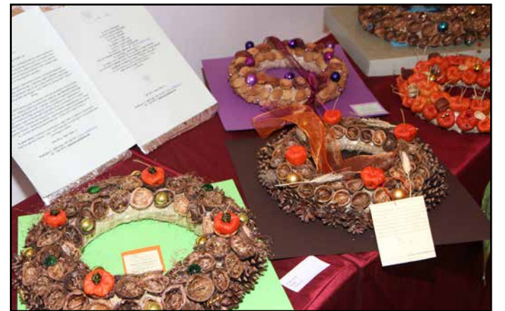
Adventni venčki iz naravnih materialov.