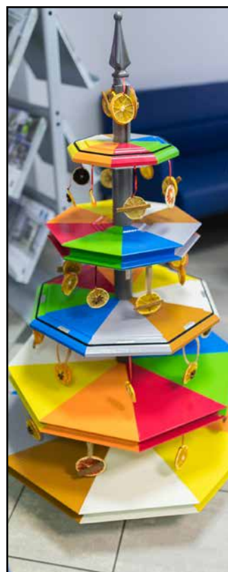
Smreka iz panelov vrat je bila tretja.