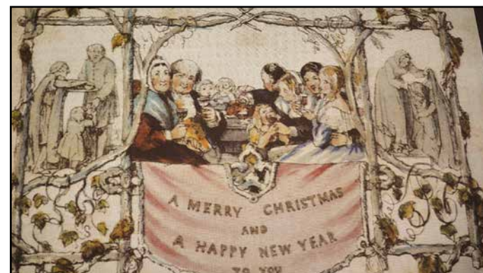
Najstarejša voščilnica iz leta 1843

je za to priložnost izdelal nekaj voščilnic s fotografskimi motivi in jih podaril udeležencem predavanja. V zvezi s pisanjem voščilnic pa je opozoril, da je nevljudno pošiljati neokusne voščilnice, z natisnjenim podpisom, da je nevljudno, če ne odgovorimo na voščilo, če smo preveč domači ali pokroviteljski in humorni z ljudmi, ki nam niso prav blizu, in če želimo zgolj iz vljudnosti srečo nekemu, s komer se ne razumemo dobro. Nekaj besed je namenil tudi pisemski ovojnici, ob tem pa poudaril, da napišemo podatke o naslovniku prostoročno, da nanje ne lepimo nalepk in ne tiskamo naslovov.