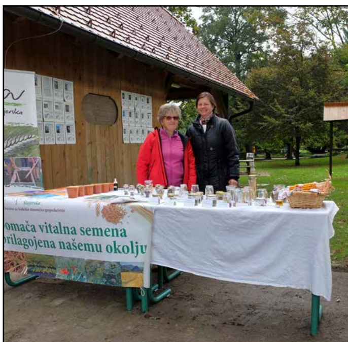
Ena od promocijskih stojnic Društva za biodinamično gospodarjenje Ajda Štajerska

»Vsako leto organiziramo tečaje biodinamike za začetnike. Opravljen tečaj biodinami-