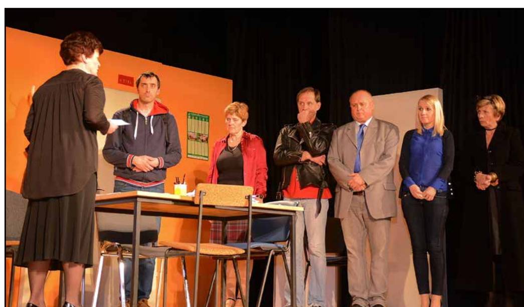
Predstava Ščuke pa ni v izvedbi Amaterskega gledališča Vrba iz Vrbje