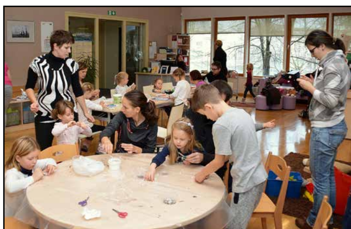
Ustvarjalna delavnica novoletnih okraskov in drugih prazničnih izdelkov