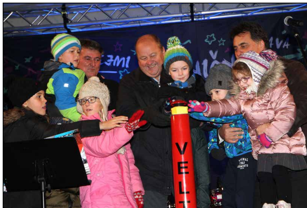
V uredništvu menimo, da je tudi v turizmu, sploh doživljajskemu, zelo pomembno, da ne zanemarimo otroka v sebi in da se znamo tudi igrati.