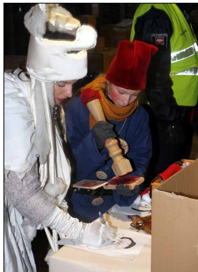
Kdor ne piše Božičku, ne more pričakovati odgovora.

Božiček bo mesto Žalec obiskal že nočjo in gotovo privabil še več obiskovalcev, predvsem