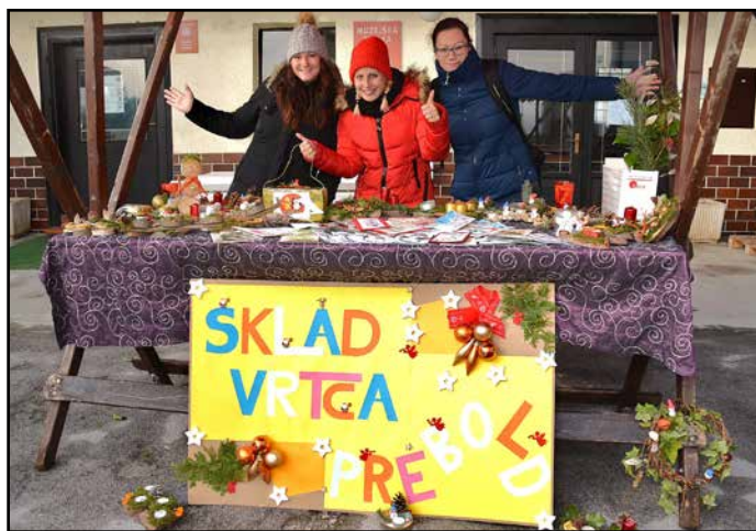
Na kmečki tržnici so prvo decembrsko soboto svoje izdelke ponujale tudi predstavnice vrta, ki so zbirale sredstva za vrtčevski sklad.

V vrtcu se že kar nekaj let tudi na ta način trudijo zbirati sredstva za lepši vsakdan svojih varovancev in jim s tem omogočiti enake možnosti. Lani so se prvič odločili za izvedbo omenjenega projekta in letos so ga z veseljem ponovno izvedli. Predstavniki sklada, starši in strokovni delavci, so združili svoje ustvarjalne moči in se lotili izdelave adventnih venčkov, okraskov, voščilnic in drugih božično-novoletnih aranžmajev.