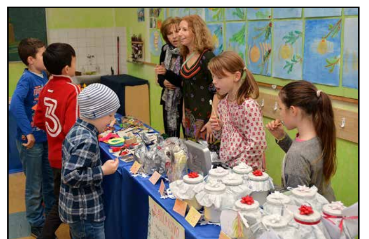
Vsaka učilnica je ponujala nekaj drugega.