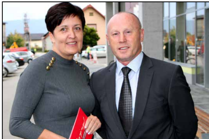
Braslovski župan se dobro zaveda, da tudi v turizmu "brez nje ne gre" ... knjižnice namreč.