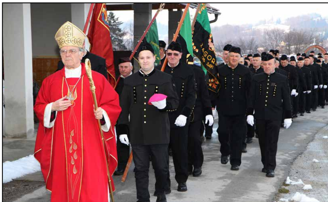
V Andražu nad Polzelo so počastili god svete Barbare.