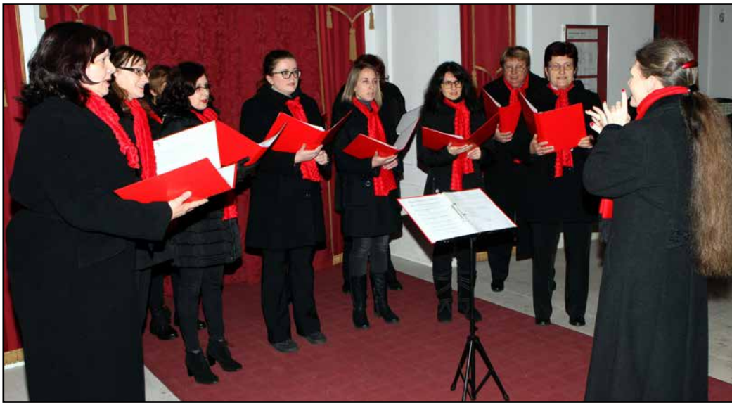
Z adventnega koncerta ŽPZ Griže