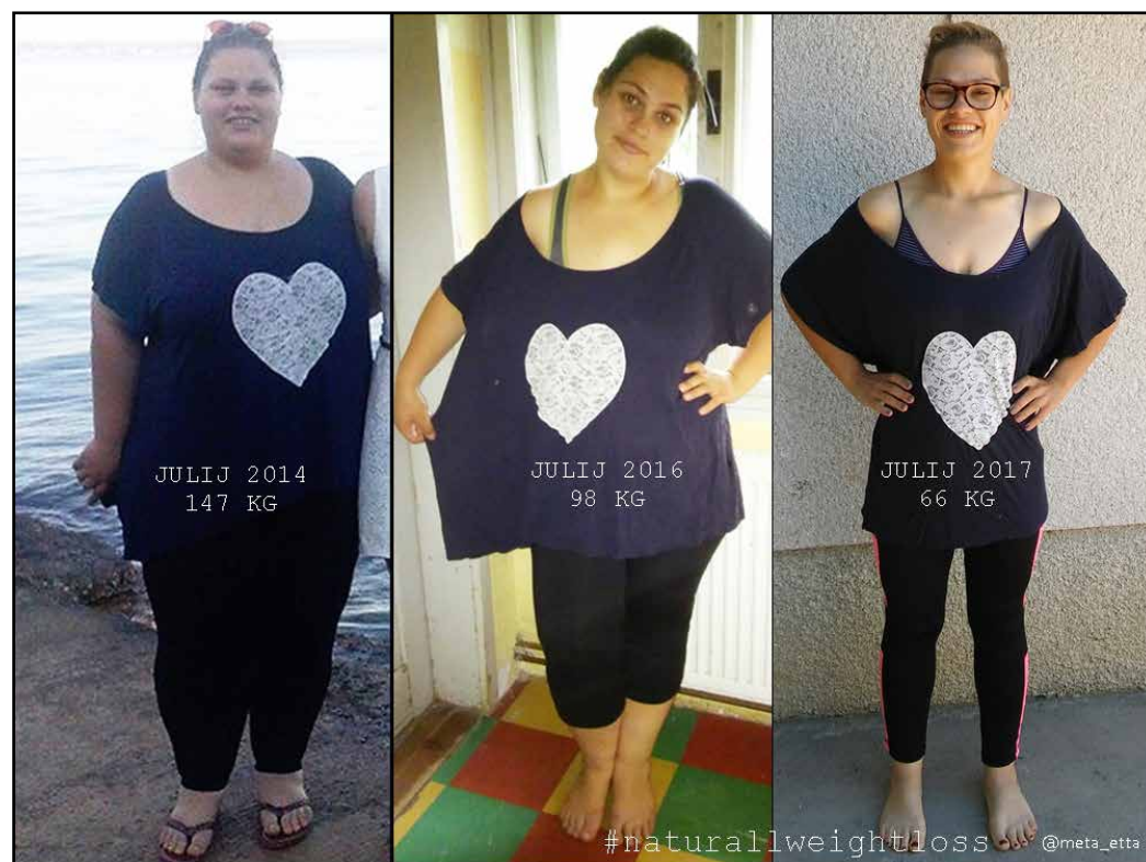
Spoštovanja vredna preobrazba v samo dveh letih.

»Mogoče malo nad povprečjem, ne bi pa rekla, da sem bila debela. Zrasla sem na kmetiji, zato sem veliko jedla, ampak sem se tudi veliko gibala, kot se pač normalni otroci. Bolj sem se zredila šele v srednji šoli in potem na fakulteti. Marsikdo bi rekel, da je to zaradi prekomernega delovanja ščitnice, ampak