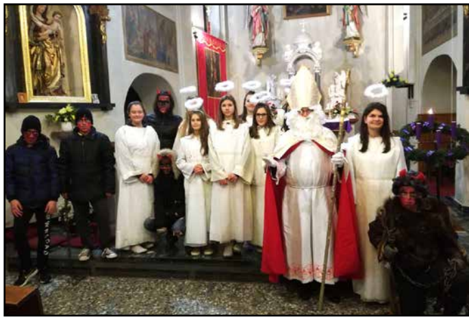
Miklavž na Vranskem je obdaril tudi manj pridne otroke.