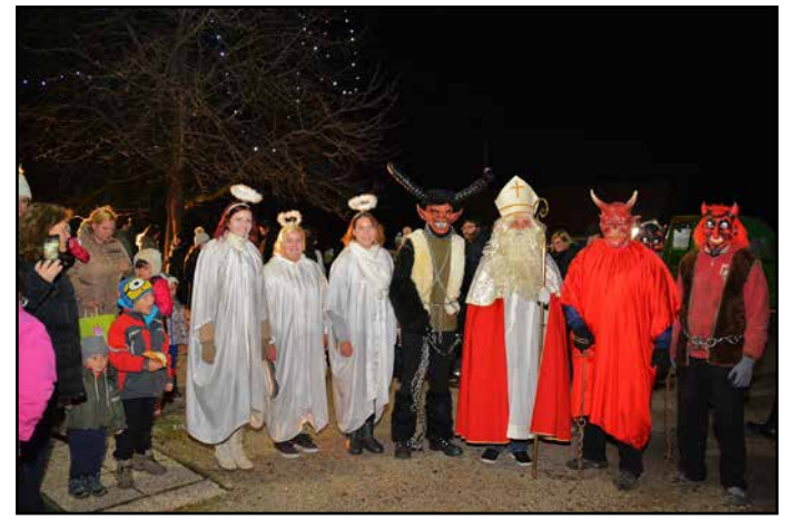
Miklavž je s svojim spremstvom obiskal tudi otroke v Šempetru.