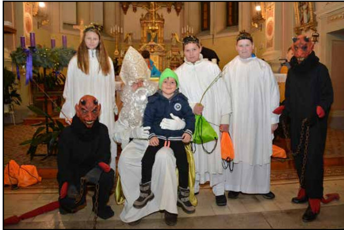
Miklavž je tudi v Preboldu obdaril pridne otroke.