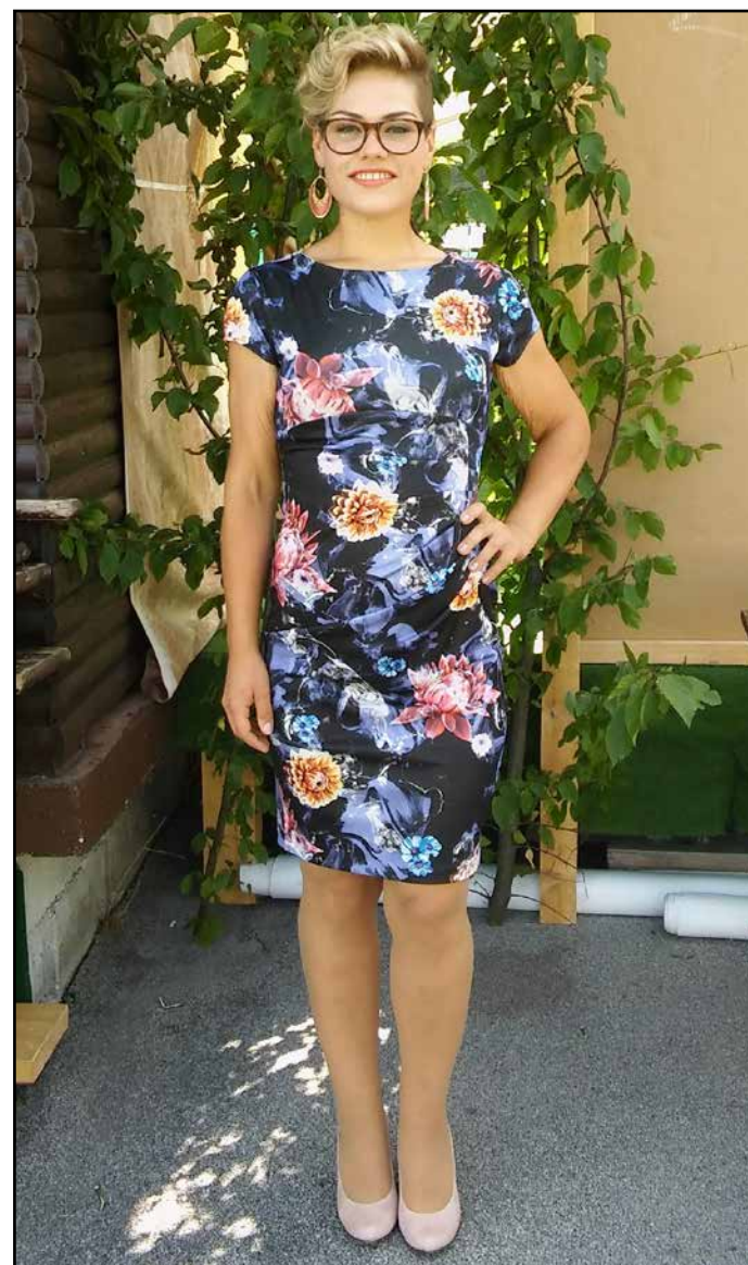
V dveh letih je v celoti zamenjala življenjski slog, a vedno je bila odlično dekleta z notranjo lepoto in jasnim pogledom v prihodnost.