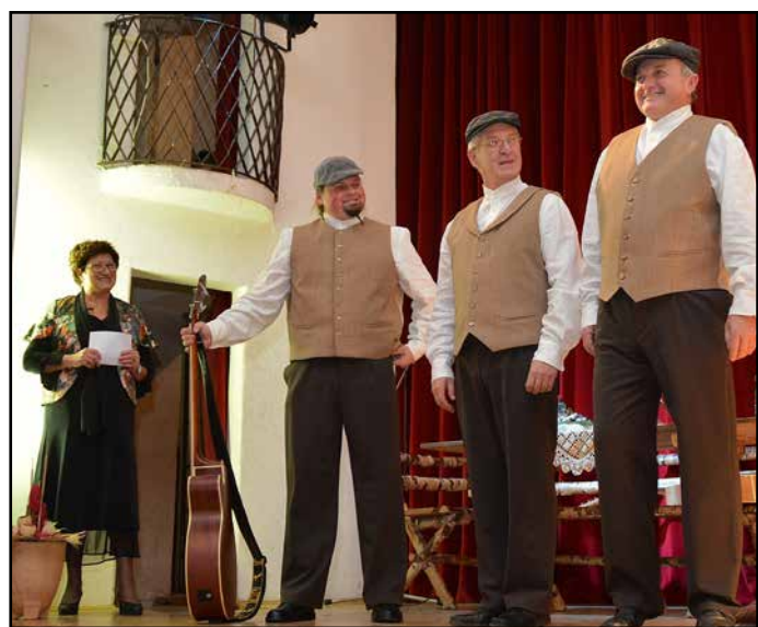
Člani Ubranih strun so v drugem delu koncerta presenetili s stilsko preobrazbo.