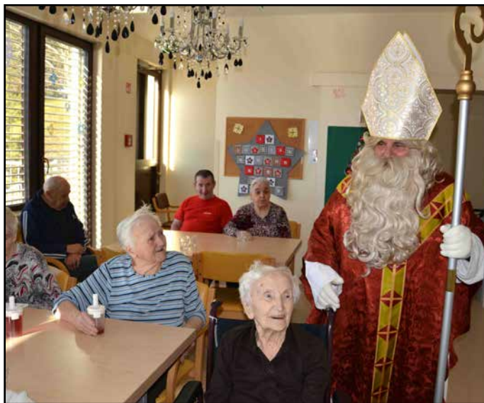
Sv. Miklavž med stanovalci polzelskega doma