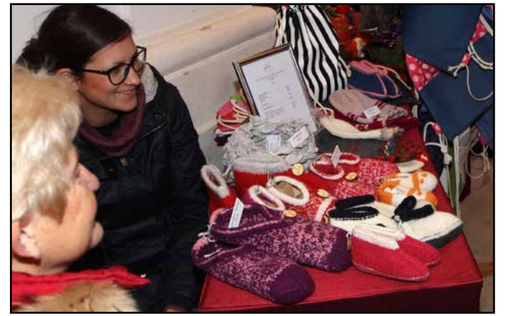
Advent postreže z živo pisanim okrasjem in domačimi izdelki izpod rok domiselnih ustvarjalcev.