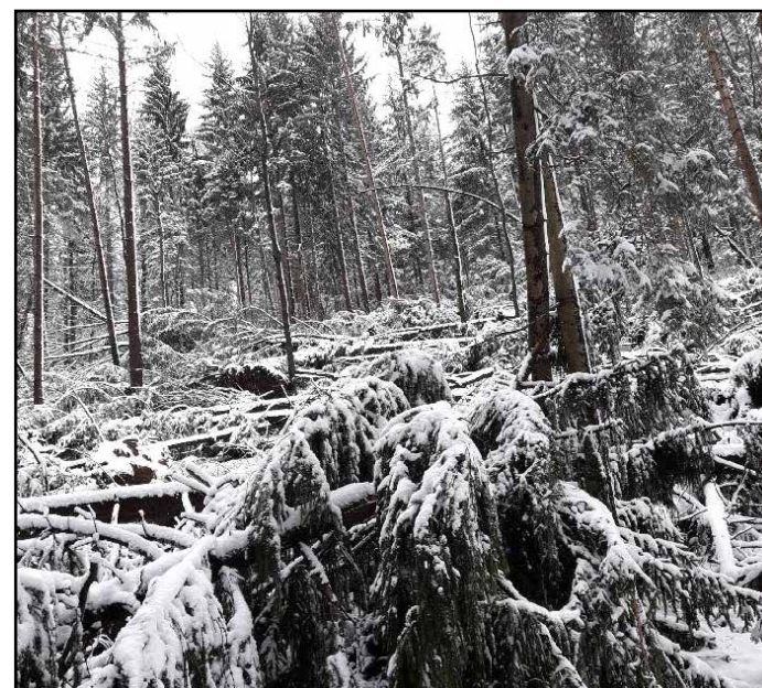
Sneg in veter sta na Dobroveljah povzročila škodo tudi v gozdovih.

oskrbe in storitve, povezane z greznicami, ki veljajo od 1. 1. 2018 dalje.