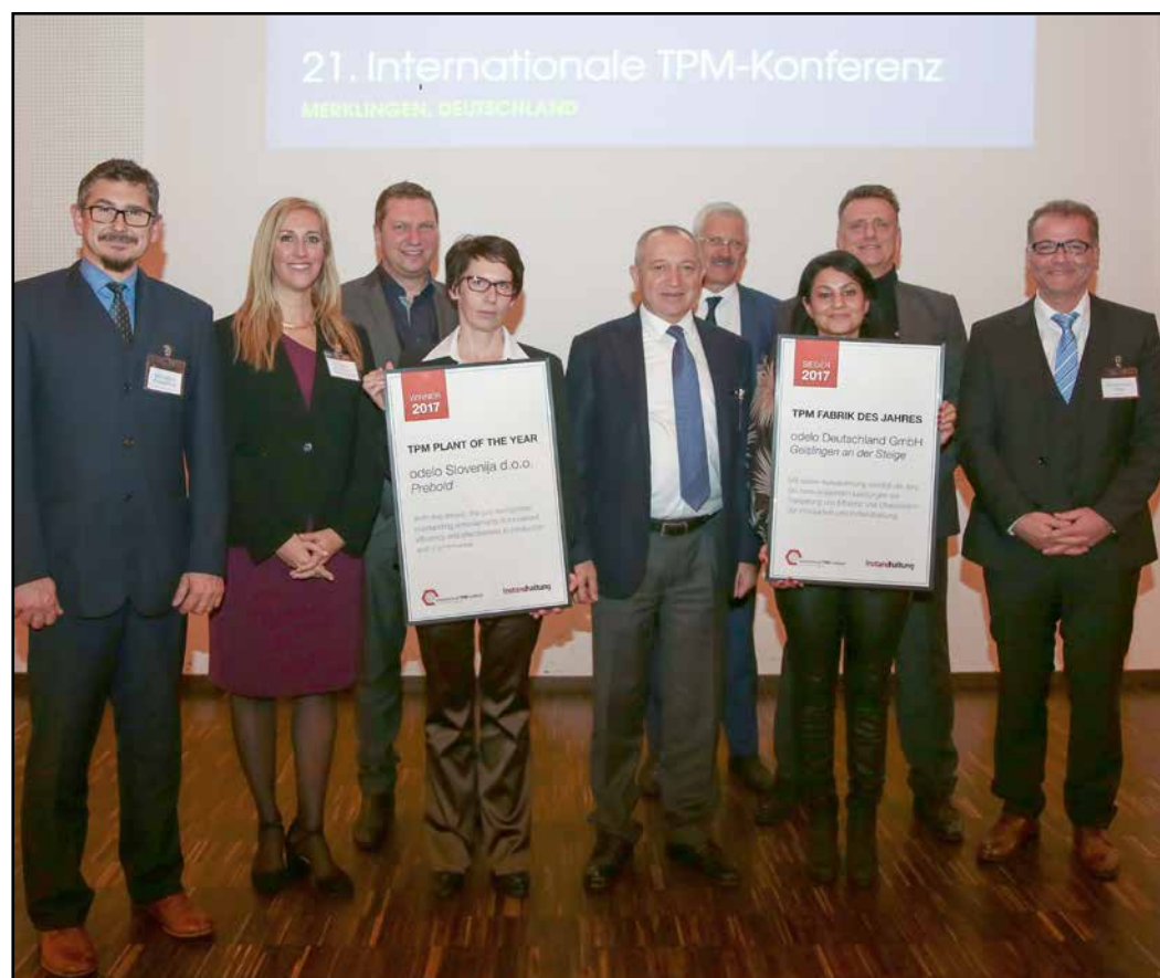
Predstavniki Odelo Slovenija po prejemu nagrade

Podjetje Odelo Slovenija iz Prebolda zaključuje letošnje leto s pomembnimi uspehi. Poleg gradnje 10.000 kvadratnih metrov novih logističnih in proizvodnih prostorov v vrednosti 3,7 milijona evrov