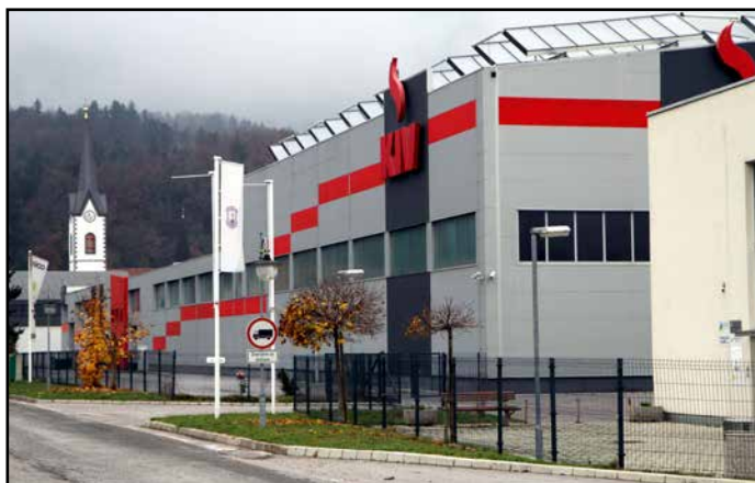
Po stečaju podjetja KIV je kompleks last podjetja Žonta oziroma Sama Feštanja.

Za okoljevarstveno dovoljenje investitor po predhodni odločitvi agencije ni potreboval okoljevarstvenega soglasja in izdelave presoje vplivov na okolje, s čimer je bila iz postopka izločena javnost. Dovoljenje od investitorja tudi ne zahteva nobenega monitoringa emisij v okolje. Občina Vranksko ves čas opozarja, da taka dejavnost, sprva naj bi opravljal le tehnične preglede in prodajal rabljena vozila in rezervne dele, ne sodi v trg Vranksko. Tudi pred časom pridobljeno soglasje zavoda za varovanje kulturne dediščine se je nanašalo samo načasno deponijo vozil. Del obravnavanih nepremičnin je namreč na zavarovanem območju naselbinskega spomenika Vranksko – trško naselje. Inšpektorji, ki so opravili več inšpekcijskih pregledov (po besedah župana pa si niso ogledali notranjosti proizvodne hale), pa niso ugotovili večjih nepravilnosti oziroma so izdali samo ureditvene