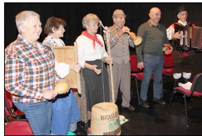
Braslovški Ajnjarji so predstavili svoja glasbila in glasbo.

Z Labirintom šepeta, ki je prvi decembrski petek vabil v Dom kulture Braslovče na spoznavanje tradicije adventa naših dedkov in babic, so v Braslovčah začeli z adventnimi dogodki.