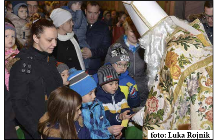
Miklavž v Braslovčah je otroke obdaril s praskanko, kompletom za setev božičnega žita, s prazničnimi okraski, čokolado in jogurtom namesto bonbonov.