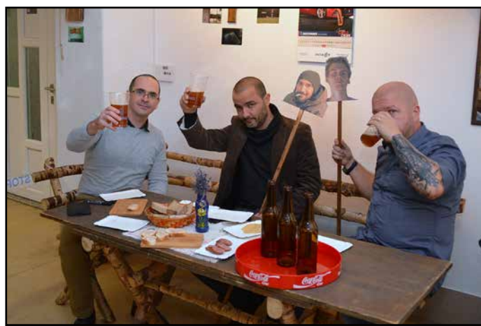
Avtorji razstave so poskrbeli za neobičajno sceno ob tem fotografskem dogodku.

Tokratna razstava Razglednice iz Slovenije odraža kritičen odnos avtorjev do trenutnega stanja v državi. Pestrost motivov lahko uvrstimo v dve širši skupini. Prva skupina obravnava motive, za katere bi si člani skupine želeli, da se ohranijo za naše zanamce, saj imajo pomembno vlogo pri identifikaciji slovenskega