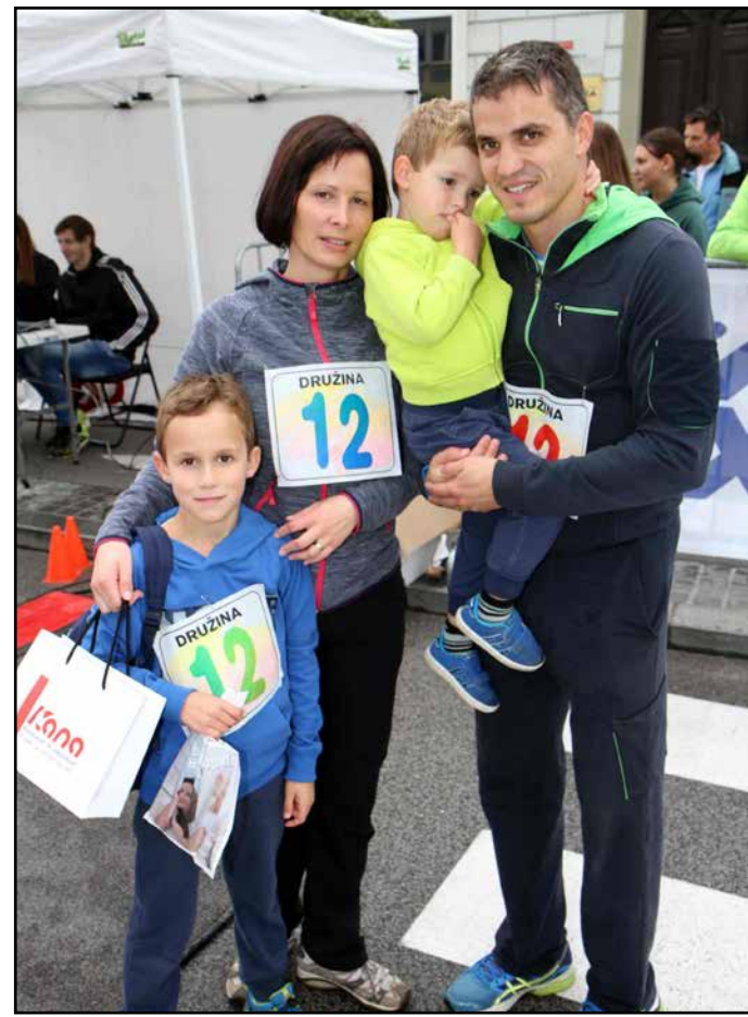
Ko odgovornemu za šport pri ZKŠT Zalec zmanjka tekmovalcev, priskoči na pomoč njegova domača ekipa.