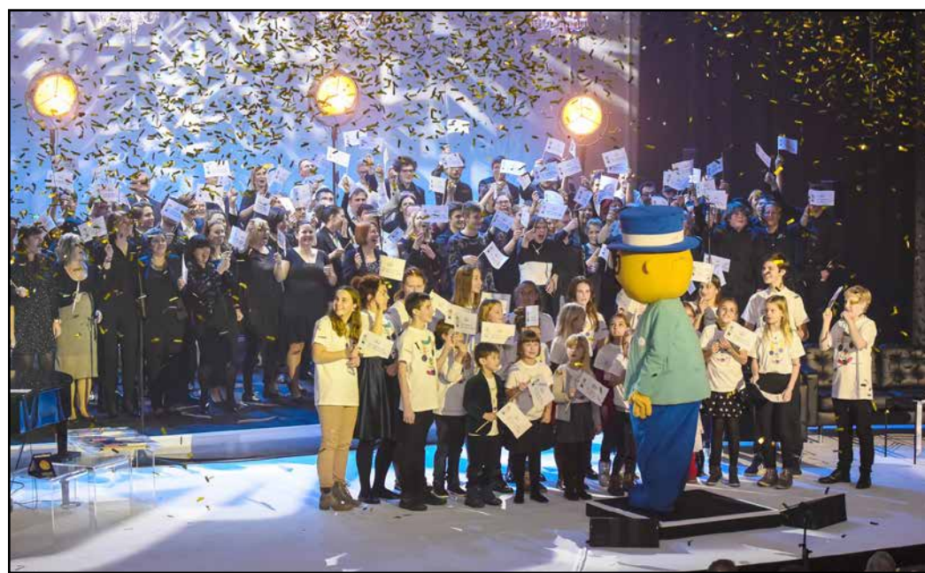
Z zlatimi lističi je bila na koncu posuta družba nastopajočih nekdanjih učencev, ki so se posebej za to priložnost zbrali in nastopili v različnih sestavih.

V dvorani Doma II. slovenskega tabora v Žalcu je v četrtek, 7. decembra, potekal slavnostni koncert Glasbene šole Risto Savin Žalec, posvečen 60-letnici šole. Množica gledalcev je bila navdušena nad odličnim prepletom scene in podobe dogodka ter glasbene vsebine, ki ga je dopolnjevala.