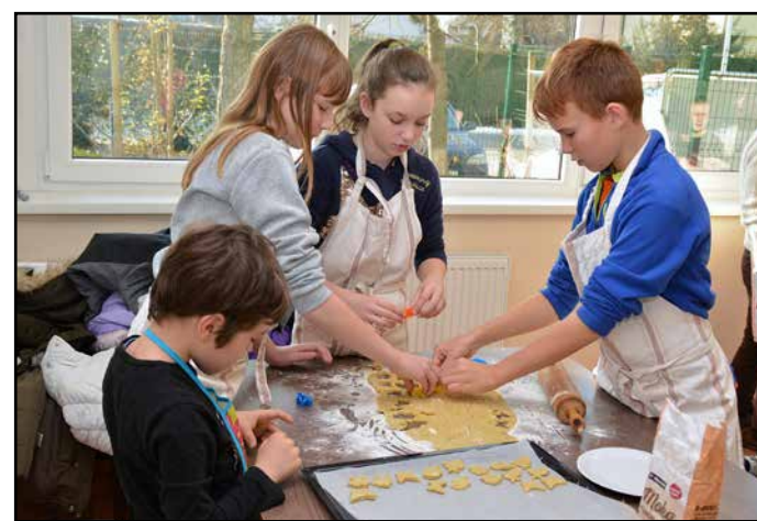
Na eni od delavnic so pripravljali kekse.