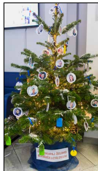
To smrekico krasijo portreti sodelavcev.