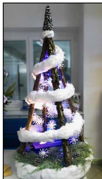
Vsi oddelki so se potrudili.