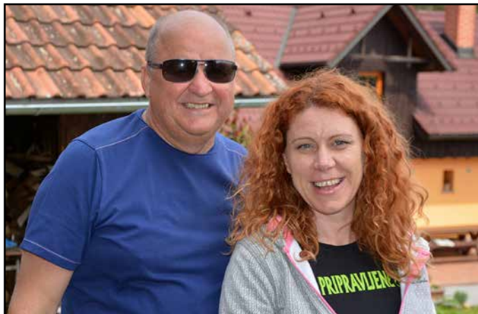
Na najbolj poznano letošnje slovensko turistično mesto je bil letos zagotovo ponosen tudi predsednik mestne skupnosti, kjer stoji fontana, in v tej luči je jasno, da je ponosen tudi na vodjo projekta, ki je dokazala, da je pripravljena.

idejo za alternativne priložnosti turizma ponudili tudi mi. Pravzaprav niti ne, mi smo na teh straneh samo zložili skupaj ideje, ki jih je v letu 2017 ponudila dolina in jih je ujel naš objektiv. Se pa opravičujemo, ker smo gotovo prezrli kakšno še boljše in tudi slabšo. Tisti, ki odločajo, bodo gotovo veseli, če vas spodbudimo k možgančanju in skupaj še kako nagrunamo za leto, ki prihaja. L. K., D. N., T. T.