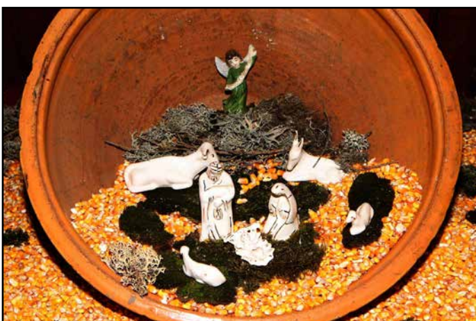
Še ena postavitev jaslic, ki je presenetila.