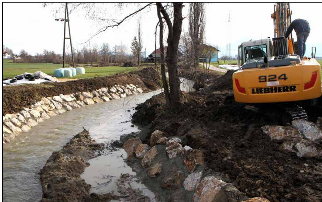
Sanacija nabrežja Ložnice

V polzelski občini urejajo vodotok Ložnica. Dela izvajajo v okviru sanacijskega programa po poplavih avgusta 2016. Sredstva za izvedbo del je Občina Polzela letos dodelila Vladi Republike Slovenije na podlagi popisa škode po poplavi avgusta 2016.