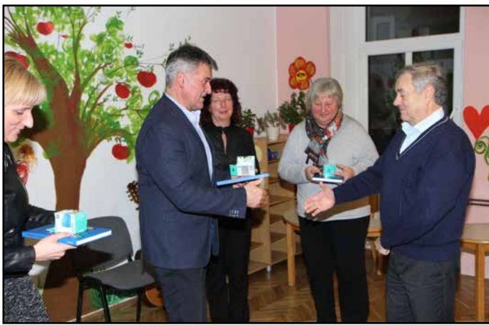
S podelitve priznanj prostovoljcem v Hiši Sadeži družbe Žalec

Največ prostovoljcev je bilo na slovesnosti iz Hiše Sadeži družbe Žalec, ostali prostovoljci so bili člani Društva prijateljev mladine Občine Žalec, Medobčinskega društva invalidov Žalec, Medgeneracijskega društva Mozaik generacij Polzela, Društva Klub zdravljenih alkoholikov Žalec, Medobčinskega društva Sožitje Žalec, Koronarnega kluba Savinjska dolina Žalec, Društva ledvičnih in dializnih bolnikov Celje, Društva Plemenitosti Ljubljana, Centra za socialno delo Žalec, Združenja multiple