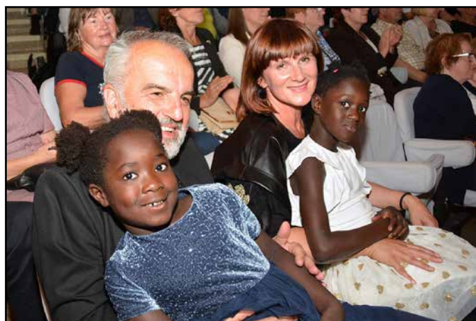
Ni vedno vse črnbelo, je pa lepo in srčno.