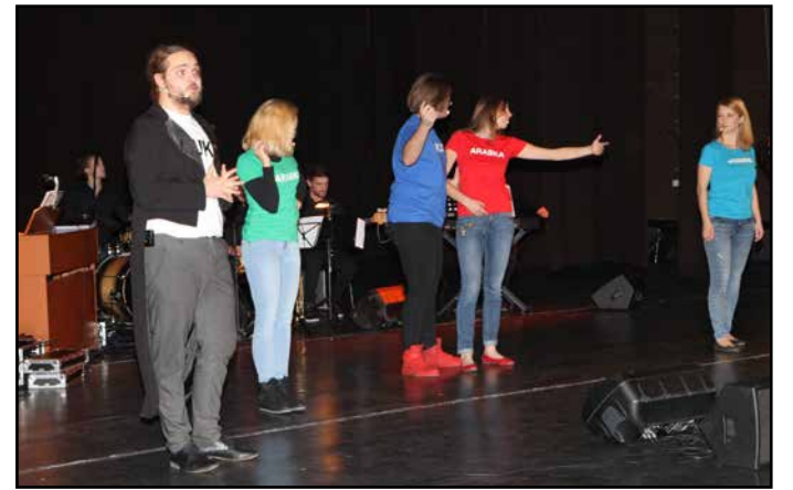
S prireditve v Žalcu

Vsi trije muzikali so v preteklih desetih letih uspešno