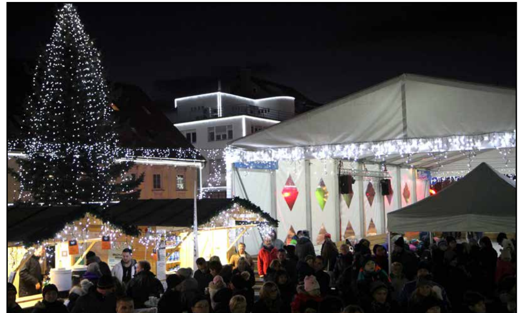
Žalec je od 5. decembra v sijaju prazničnih luči in živžava, ki ga narekuje pestro praznično dogajanje.

Polzelska župnijska Karitas je skupaj s sodelavci na predvečer godu sv. Miklavža v župnijsko cerkev sv. Marjete na Polzeli povabila 350 otrok, v Andražu nad Polzelo pa v cerkev sv. Andreja 40 otrok. Na Polzeli so