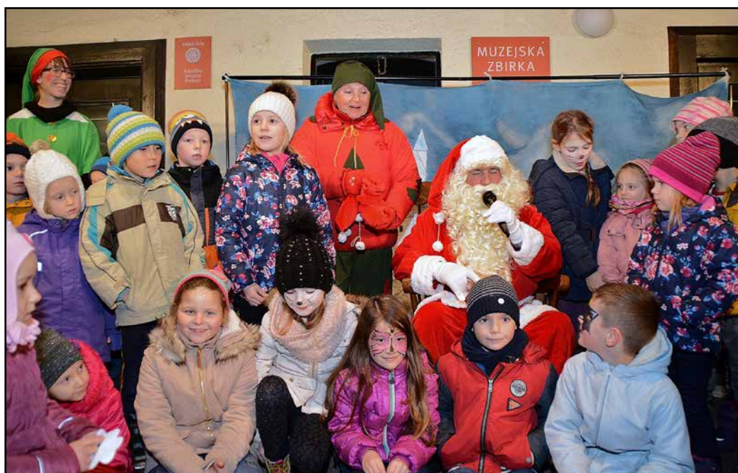
Otroci v Preboldu so Božičku zapeli pesmico.