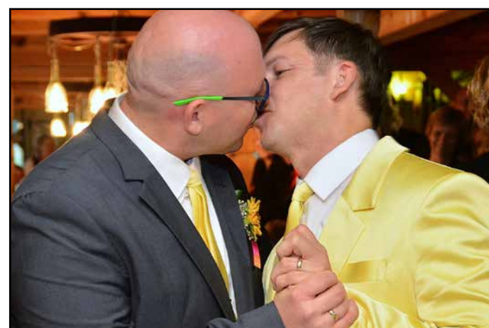
Prva slovenska gejevska poroka govori o tem, da smo Savinjčani odprti za ljubezen.

Ni res, da smo docela pozabili na tiste prave vrednote, kot se zadnje čase velikokrat pritožujemo. Še vedno nekaj pomeni družina. V iztekačem se letu smo srečevali mnoge zanimive družine, v dolini tudi prav, čeprav po srečne, srčne, složne, polne ljubezni in spoštovanja, zadovoljne. Vse se niso pustile ujeti, druge smo spregledali, seveda nenamerno, ampak tiste, ki smo jih ujeli, so dokaz, da je kaj na tem svetu in v dolini tudi prav, čeprav po svoje. L.K., D.N., T.T.