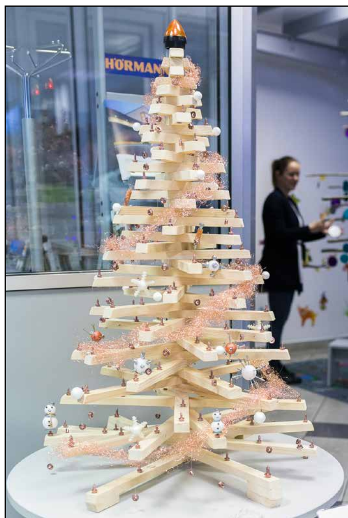
2. mesto si je prislužila smrekica iz odpadnega materiala.