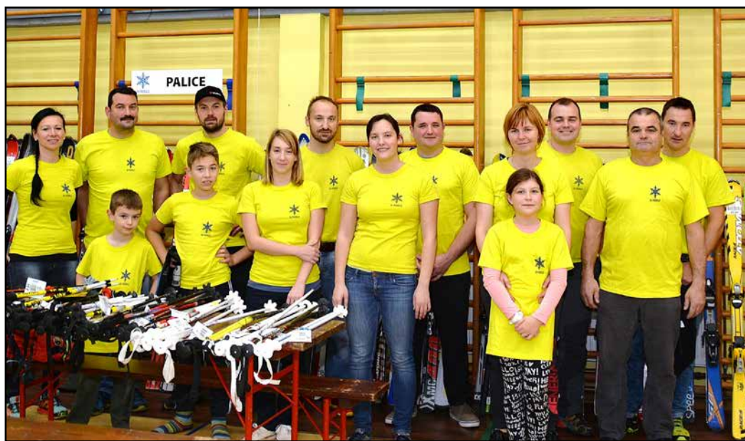
Članice in člani SK Prebold so tudi letos organizirali smučarski sejem.

Smučarski klub Prebold bo v sodelovanju s Športno zvezo Prebold in Občino Prebold tudi letos poskrbel, da bodo otroci lahko uživali v smučanju.