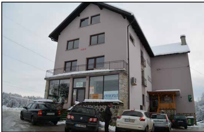
Dom z novo streho in na novo prepleškano fasado

Letošnji 31. maj prebivalcem Ponikve pri Žalcu ni prinesel mirnega spanca, saj je zagorelo poslopje tamkajšnjega združnega doma, kjer pripravljajo razne kulturne in družabne dogodke. Nastalo škodo pa so že odpravili.