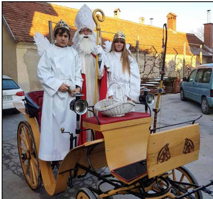
Sveti Miklavž s svojim spremstvom se je v Petrovčah letos pripeljal s kočijo.

Sv. Miklavž je na povabilo članov KUD Grifon in KS Šempeter obiskal tudi Šempeter. V prazničnem vzdušju so ga pričakali na dvorišču pred zgradbo KS Šempeter, kjer so se lahko obiskovalci ogreli s kuhanim vi-