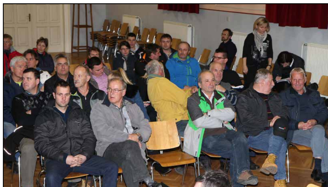
Okrogle mize so se udeležili številni kmetje.