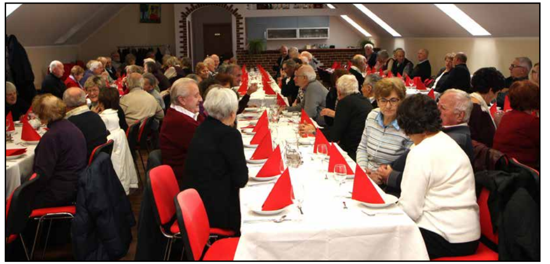
S srečanja starejših v dvorani PGD Gotovlje

Ob zaključku leta v mnogih lokalnih okoljih krajevne skupnosti, KO Rdečega križa in društva po dolini poskrbijo za srečanja starejših krajanov. Ob tej priložnosti jim zaželijo zdravja in lepih trenutkov v prihajajočem letu in jim pripravijo tudi kakšno drobno pozornost. Nekaj takih dogodkov so pripravili že prejšnji mesec, še več pa v zadnjem mesecu leta.