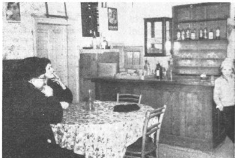
V neprivlačno urejeni gostilni dobra postrežba. Avstrijci niso redki gosti (Na sliki levo)

Nekateri tovariši iz Jurovskega dola menijo, naj bi prihodnje leto začeli z načrtno obnovo kulturnega doma. Predlagajo, naj bi ne vlagali sredstev v zasilno ureditev, ker bi se slej ko prej pokazala potreba po dokončni ureditvi kulturnega doma. Po predlogu naj bi zgradbo obnovili v prihodnjih dveh letih.