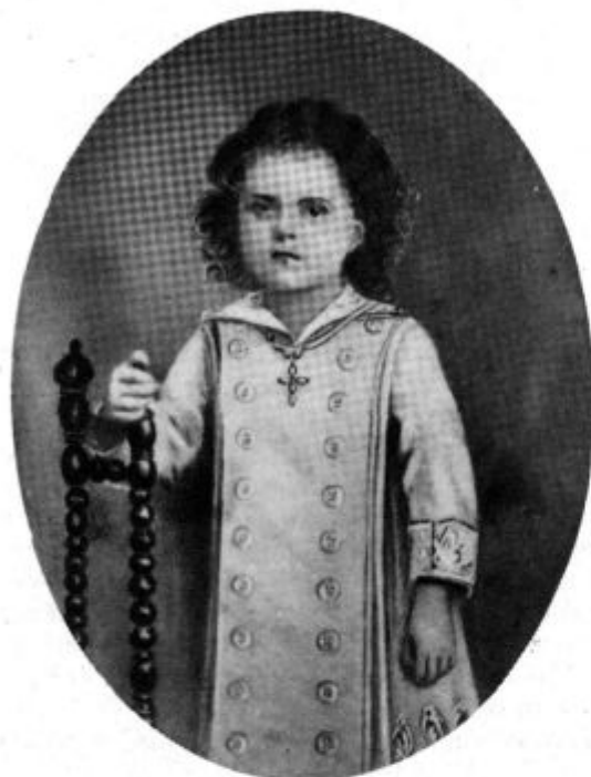
Sv. Terezija Deteta Jezusa.

mного točk, ki so mi bile temne v razvoju proti Bogu, ampak so me tudi opozorila na preizkušnjo, ki sem jo moral prestati, in so mi dajala moči, da ji kljubujem.