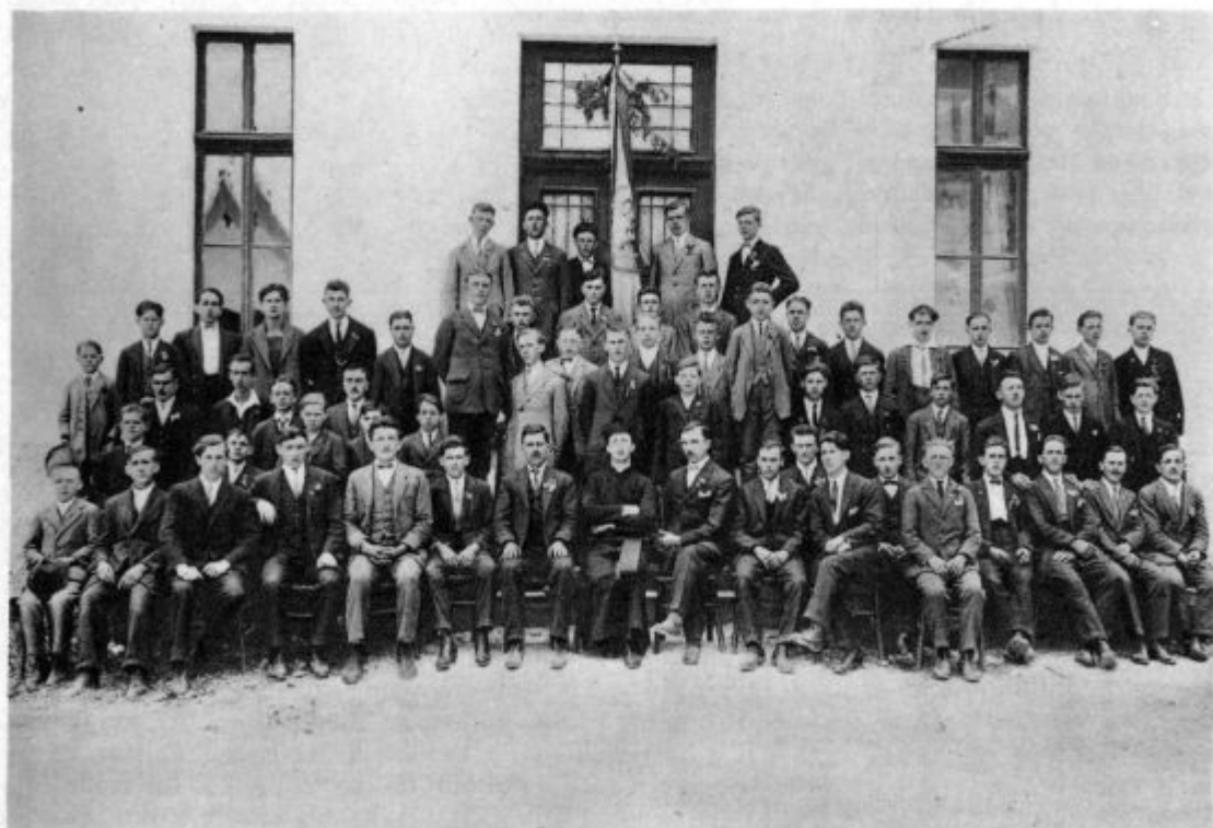
Mladeniška Marijina družba, Sv. Križ pri Kostanjevici.

Takoj, ko je prišel v samostan, je izrazil željo, da bi rad postal redovnik in to željo je potem še večkrat ponovil. Ker je bil še premlad in še ni mogel postati član prvega reda, se je najprej pridružil tretjemu redu in dobil ime Frančišek. Z veseljem je opravljal svoje redovne dolžnosti in s ponosom je nosil znak tretjega reda. Začel je hoditi vsak dan k sv. obhajilu in ostal tej lepi navadi zvest do smrti. Skoraj ves čas svojega bivanja v Škofji