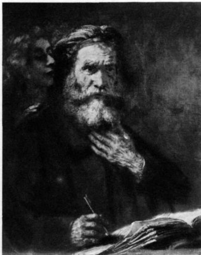
Rembrandt v. Rijn.

hotel obiskati kakega duhovnika, da bi se vsaj posvetoval z njim o svojem dušnem stanju, da me je pa odvrnila bojazen, da me ne razume in tudi strah, da izgubim svobodo. »Mar se ne bi mogel zveličati kar sam?« sem ga vprašal. Razodel sem mu tudi tisti čudni strah, ki mi brani hoditi v cerkev, kakor da se čutim preveč umazanega, da bi moja navzočnost ne žalila Boga.