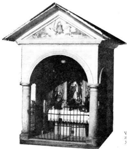
Vaško znamenje sredi Selc z lepo izdelanima zelenima stebroma iz peraiškega tufa. Streha je pokrita s skrilom, najbrž iz nemiljskega skriloloma.

Na Selškem pa le redke domačije in druge objekte krasi pastelno zeleni peraiški kamen, ki sicer daje pečat celi Gorenjski. Že barva nas opozarja, da mora biti kamen nekaj posebnega. In to tudi res je, saj je nastal drugače, kot velika večina kamnin po Selškem oziroma po loškem ozemlju. Material zanj so dali terciarni, ali natančneje, oligocenski ognjeniki, ki so izbruhali poleg lave tudi velike množine pepela, vmes pa še večje in manjše kamnite drobce.