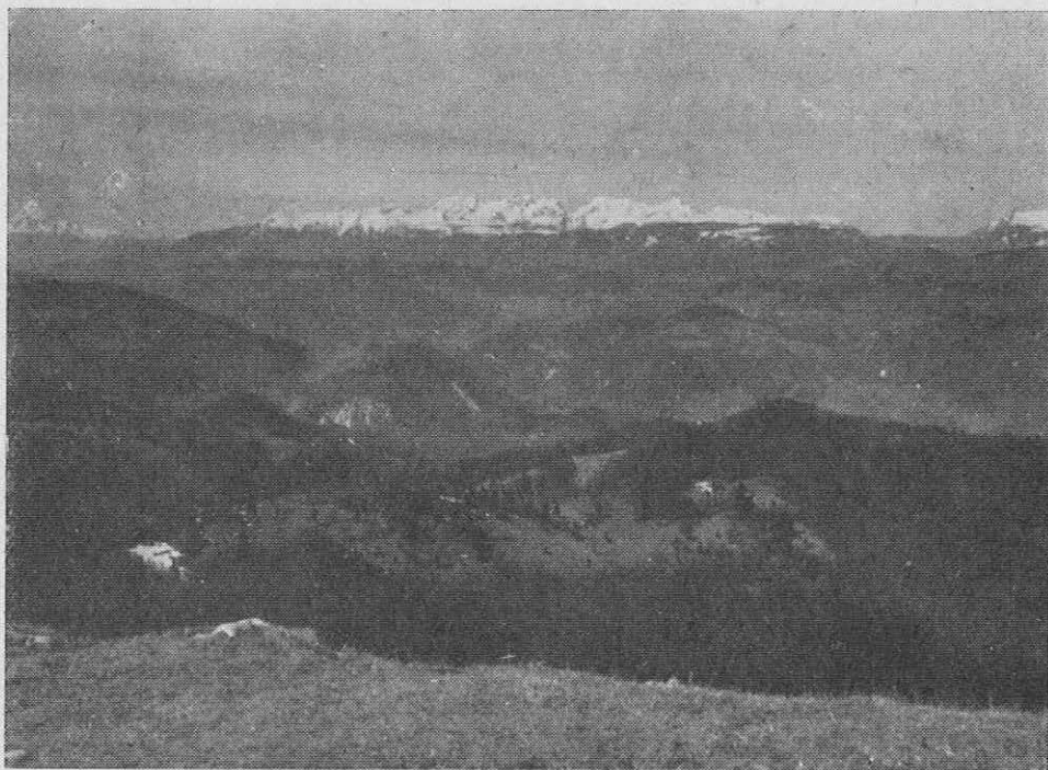
Kamniške planine s Kuma