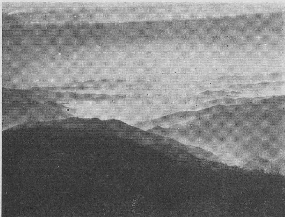
Razgled s Kuma proti jugovzhodu