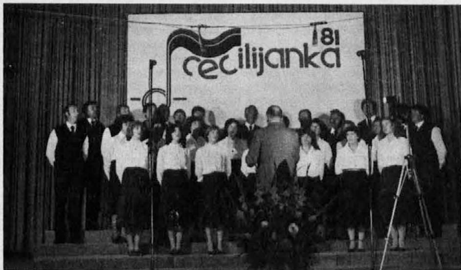
Mešani cerkveni zbor iz Štandreža na Cecilijanki '81