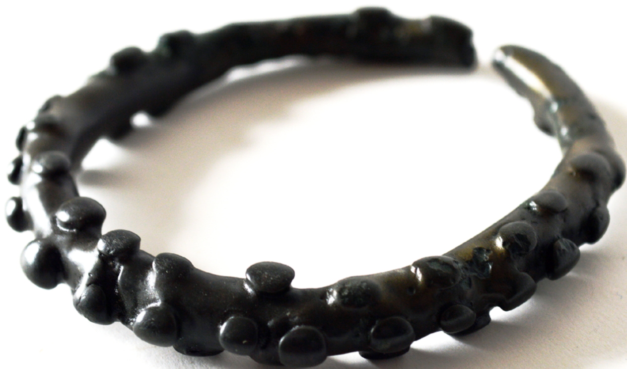
Bradavičast obroček s Panorame.