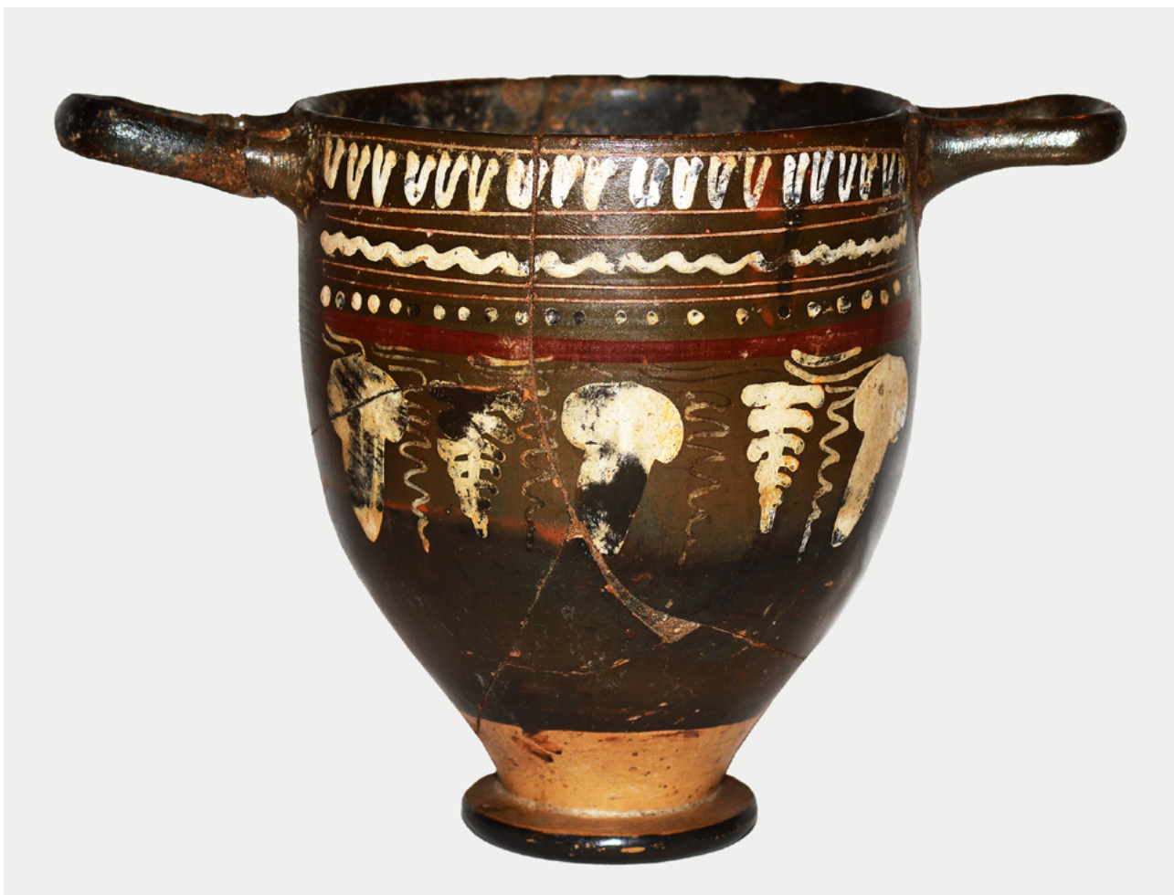
Gnathijski skifos iz Starš na Dravskem polju.