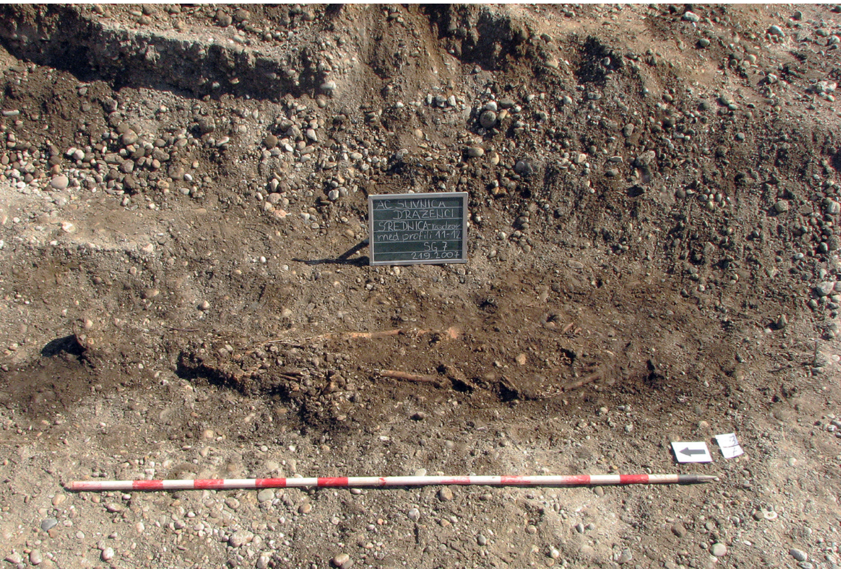
Fotografija skeletnega groba 7 iz Srednice.