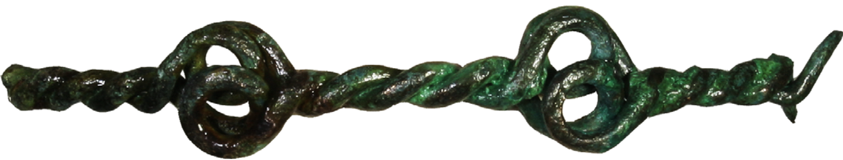
Odlomek zapestnice z osmico iz bronaste žice iz groba 4 iz Srednice.