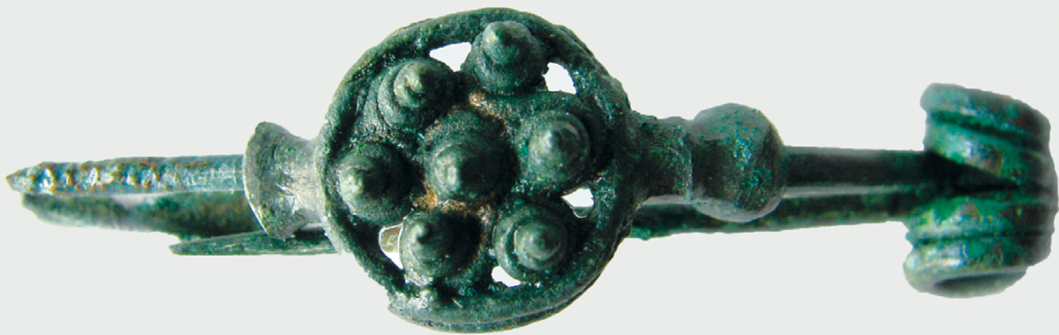
Bronasta fibula s psevdo-filigranskim okrasom iz Formina.