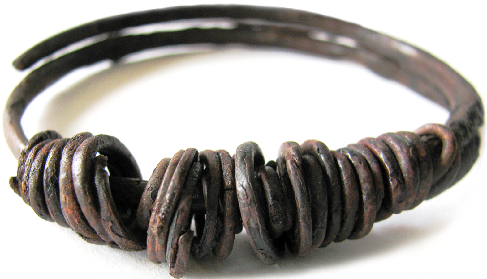
Železna zapestnica z obročki iz Formina.