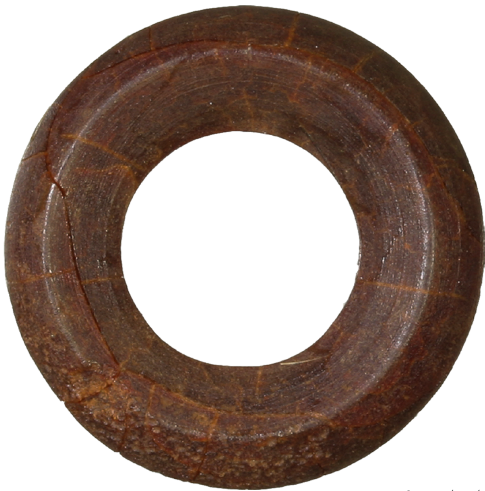
Jantarni obroček iz groba 4 iz Srednice.