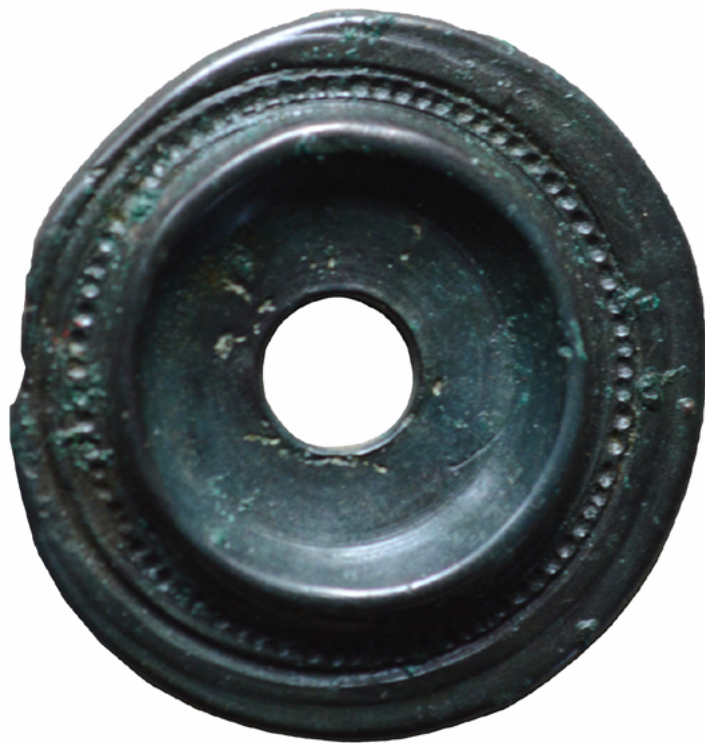
Bronast profiliran obroček iz groba 7 iz Srednice.