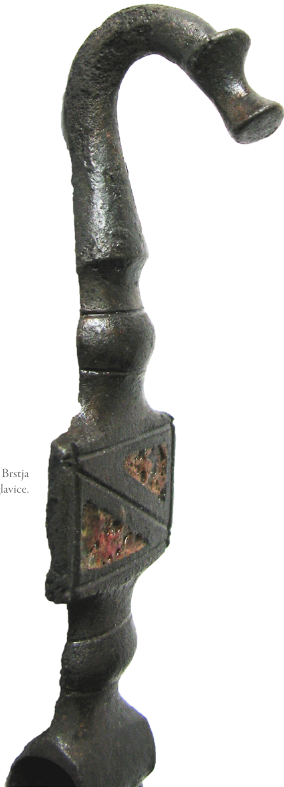
Zaključek pasne verige iz Brstja v obliki konjske glavice.