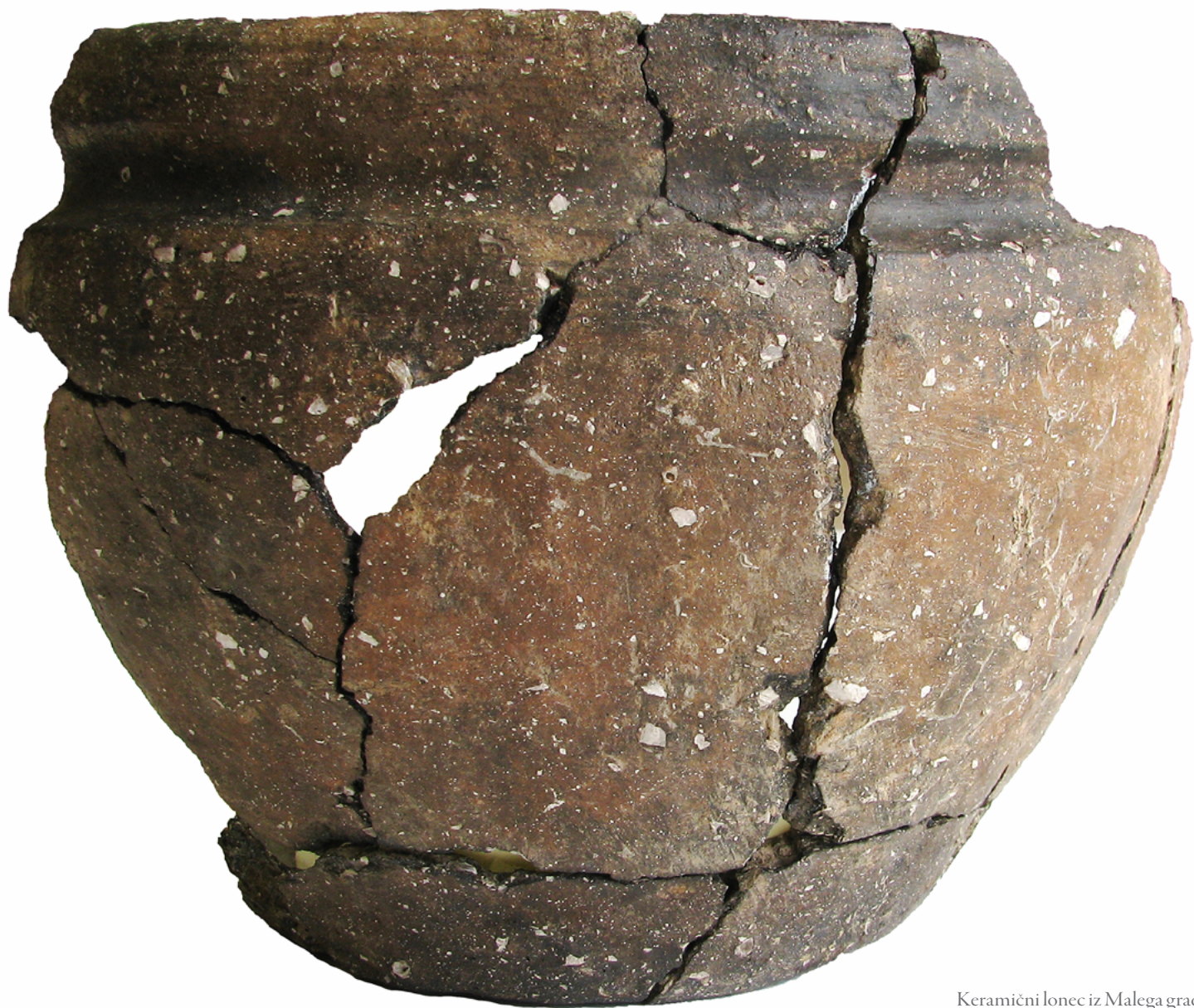
Keramični lonec iz Malega gradu.