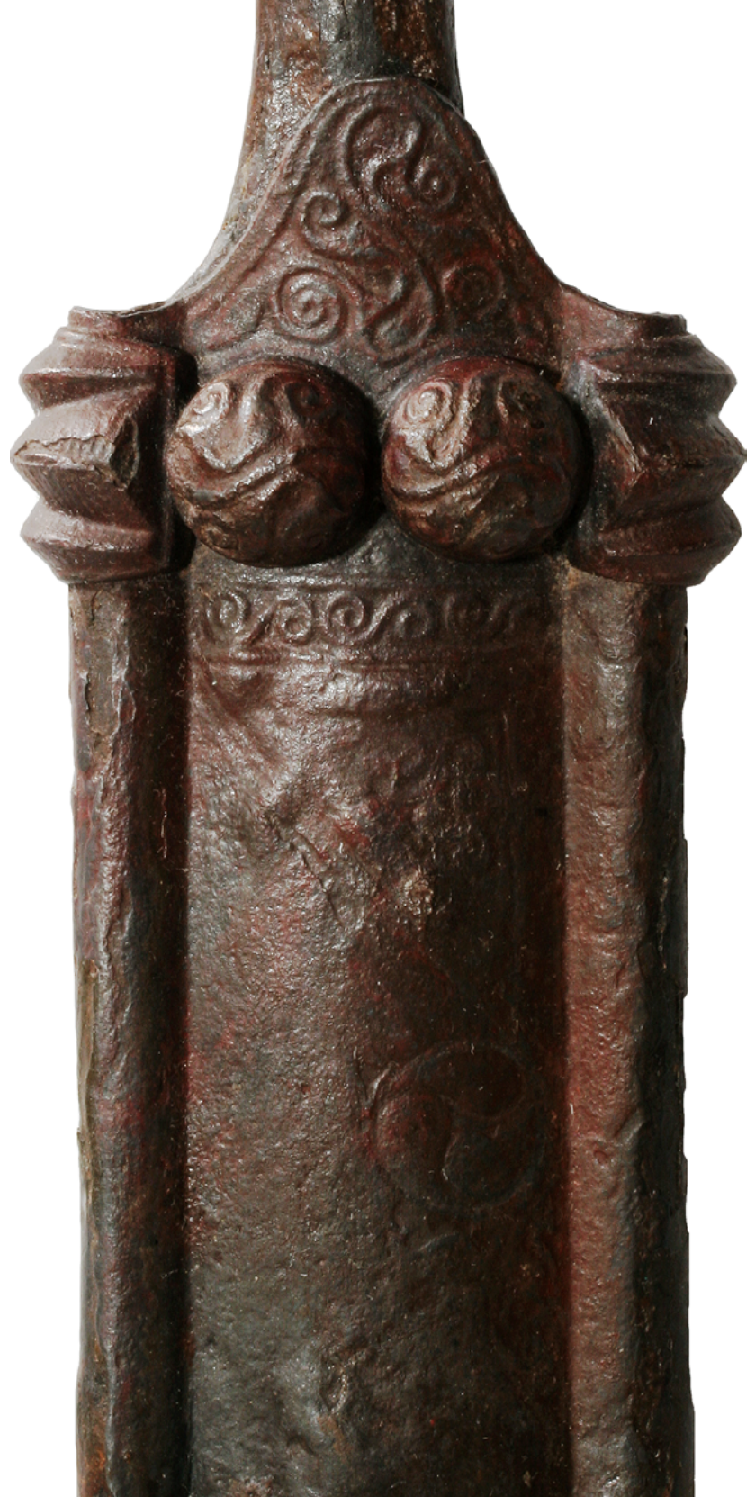
Okrašena prednja stran nožnice meča iz groba 9 iz Srednice.