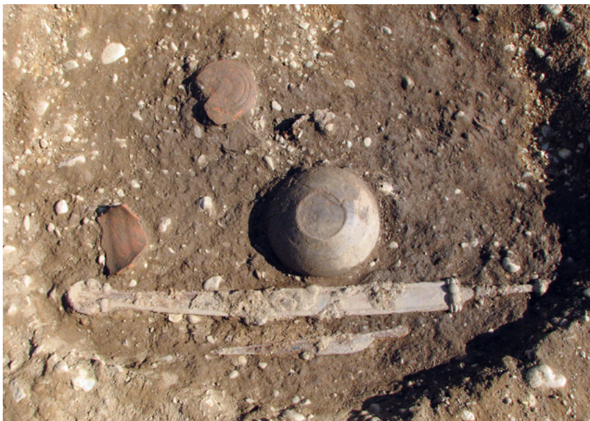
Fotografija žganega groba 9 iz Srednice.

na Madžarskem. Njegovi globoko reliefno oblikovani vlitni konstrukcijski elementi, kot so objemka in okrasni gumbi ustja nožnice, pa ga povezujejo z manjšo skupino podobnih mečev, ki se je razprostirala na prostoru od Graškega bazena na severu do Blatnega jezera na vzhodu in do področja Ptujja na jugu.