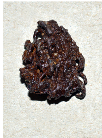
Obročki verižnega oklepa s Turnirskega prostora.

Dve najdbi, odkriti na Turnirskem prostoru, pričata o nemirnem času prvega stoletja, v katerem se je področje Ptuja ponovno znašlo v vrtincu zgodovine. Dobro stoletje po tem, ko so v regijo prvič prikorakali »okovanani sandali«, je naselbina postala Colonia Ulpia Traiana Poetovio , mesto v katerem se bodo še stoletja srečevale in prepletale različne kulture.