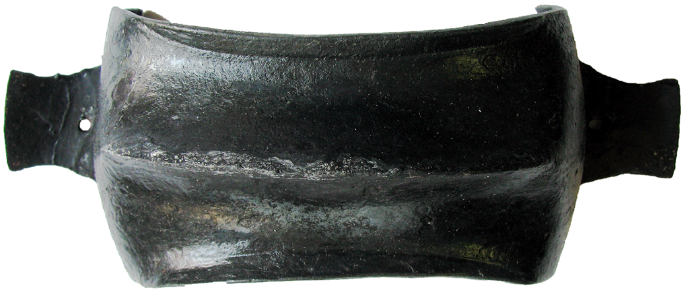
Železna ščitna grba iz Formina.