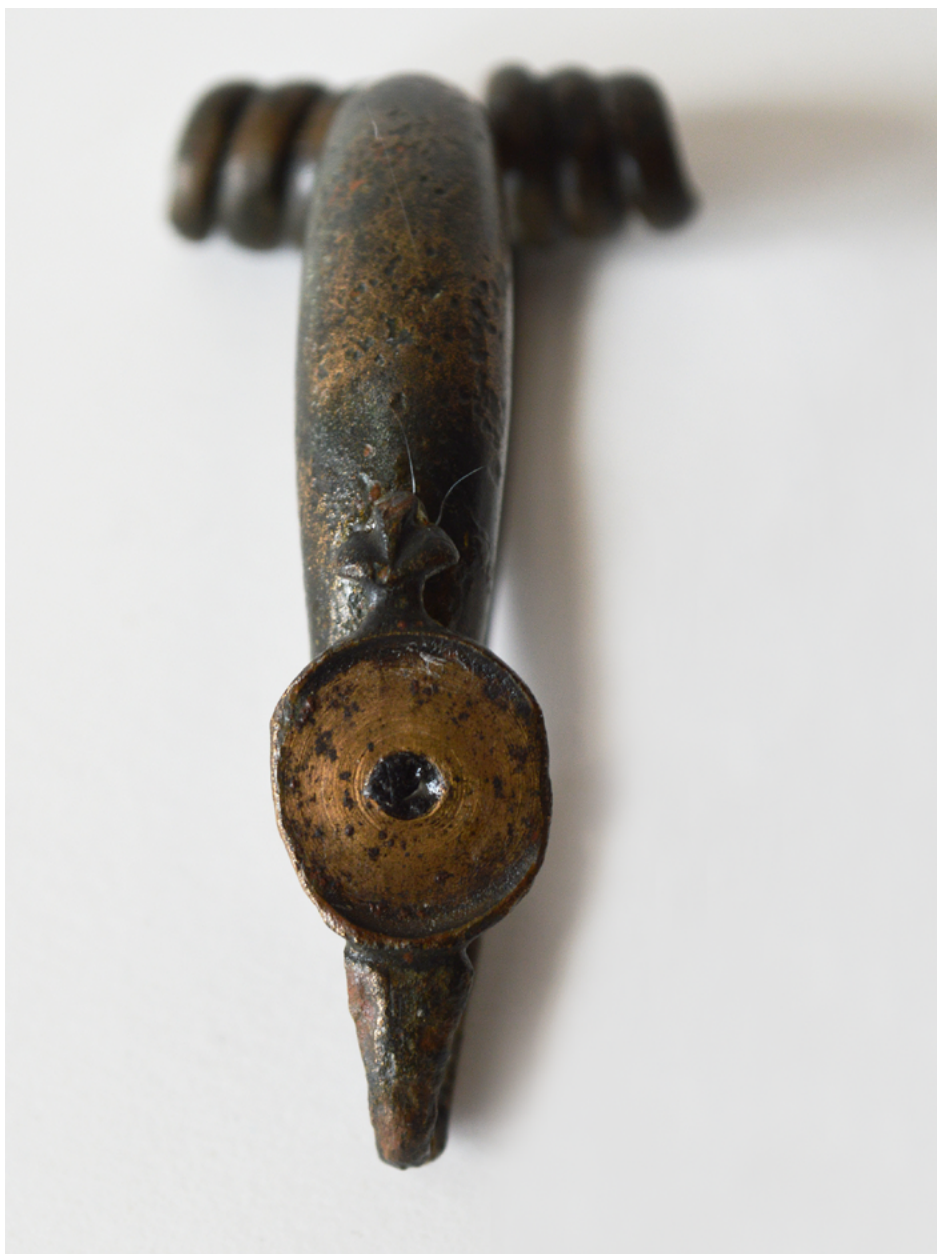
Fibula tipa Münsingen.