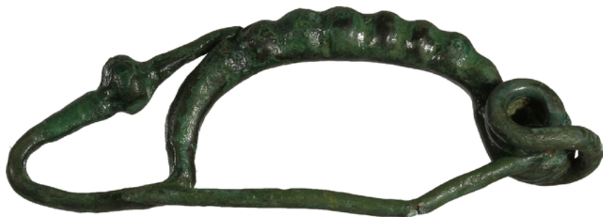
Odlomek zapestnice z osmico iz bronaste žice iz groba 4 iz Srednice.

postavljene posameznice nosile kot obeske na ogrlicah. Značilna nakitna oblika vzhodnih Keltov, ki je postala del širše mode, pa je tudi bronasta fibula tipa Duchcov z narebrenim lokom.