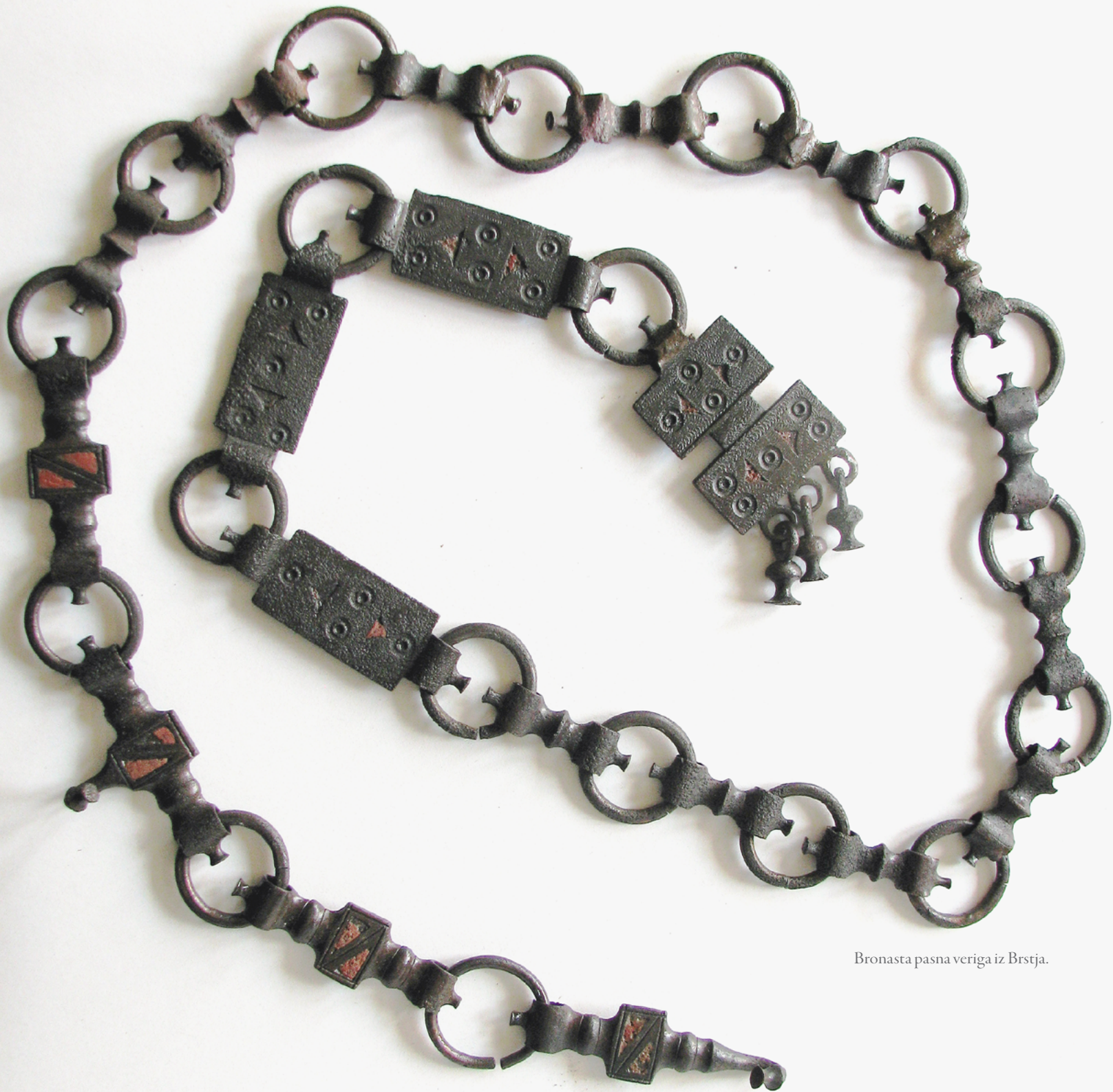
Bronasta pasna veriga iz Brstja.