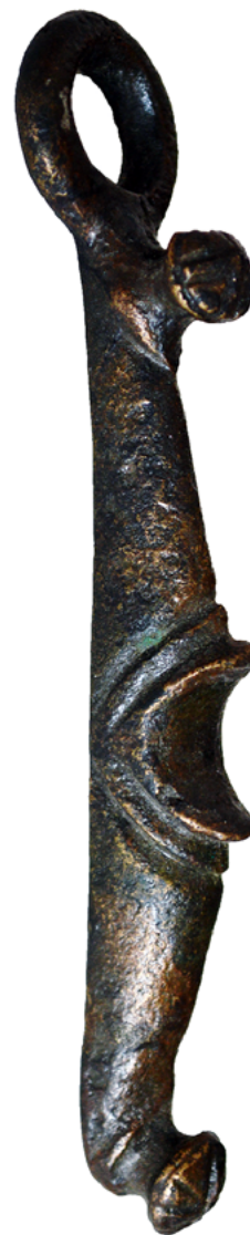
Bronast paličast predmet s Turnirskega prostora.

V isti čas sodi tudi bradavičast obroček, odkrit na Panorami, ki zraven keramičnih najdb kaže, da je bila poseljena tudi druga nekoliko povzdignjena lokacija, ki bo svoj največji pomen dobila šele z izgradnjo rimskega mesta. Podobne najdbe izvirajo iz ženskih grobov na Dolenjskem, kot tudi naselbinskih kontekstov iz krajev, kjer grobov ni. Glede na lego v grobovih pa so jih najverjetneje ženske nosile na ogrlicah z jagodami ali drugimi obeski. Prav zaradi njegovega apotropijskega pomena lahko domnevamo, da sodi v del osebne opreme žensk posebnega statusa, bivajočih v hierarhično pomembnejših naselbinah v regiji.