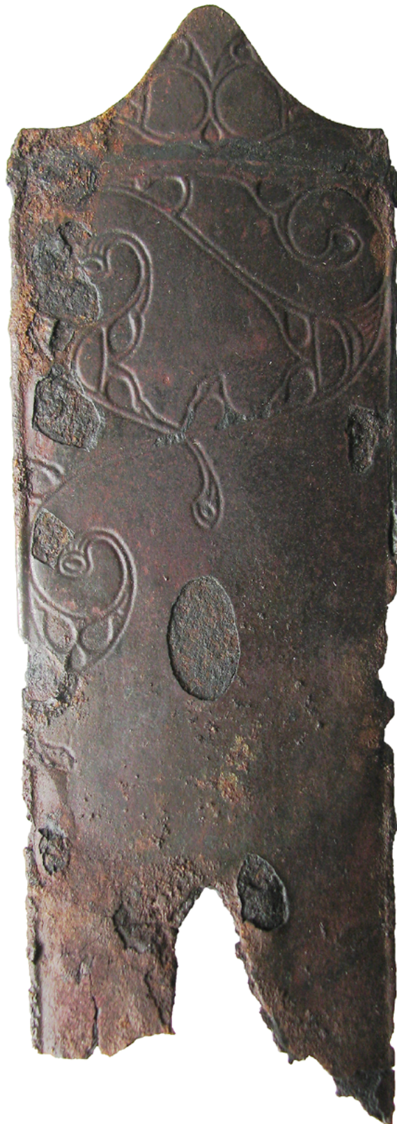
Okrašena prednja stran nožnice meča iz Formina.