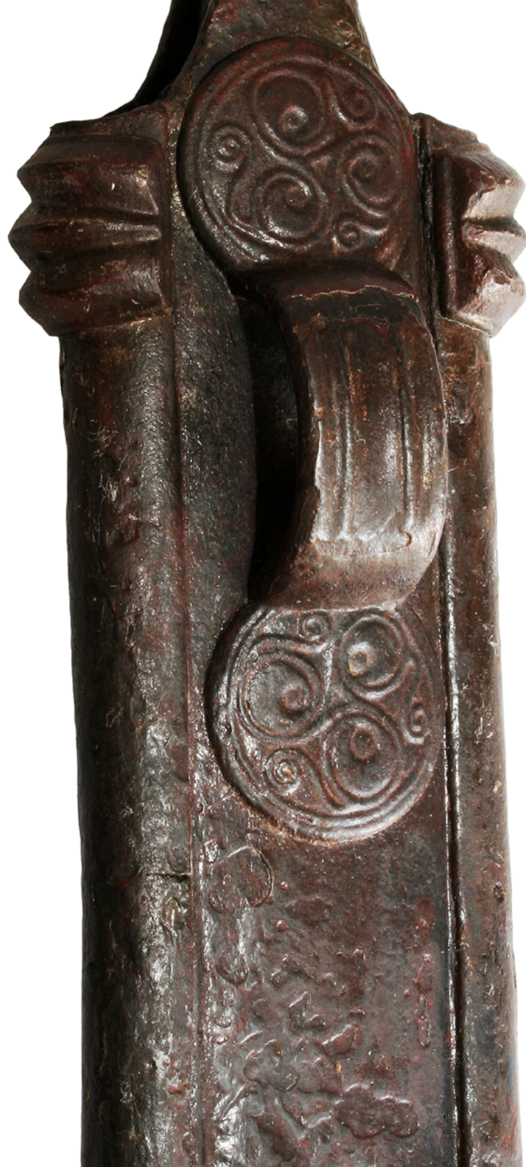
Okrašena zadnja stran nožnice meča iz groba 9 iz Srednice.