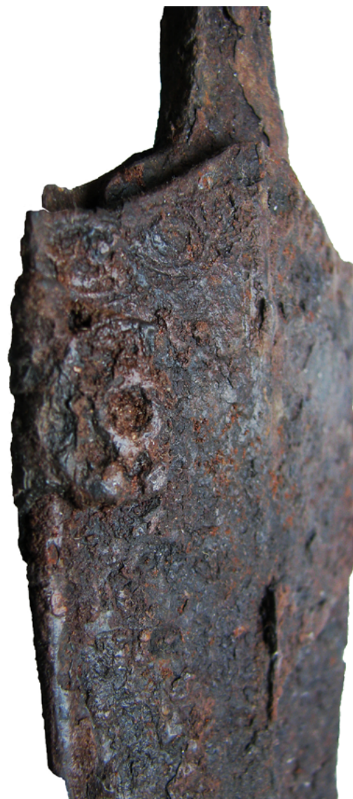
Okrašena prednja stran nožnice meča iz Formina (obe sliki).

Okraši nožnic mečev iz Formina pričajo o slogovni raznolikosti, prepletanju tradicij in inovacij, prehodnosti slogovnih elementov iz Alpskega in Panonskega prostora in izjemnem kreativnem potencialu delavnic vzhodnih Keltov v času konca 4. in začetka 3. stoletja pred našim štetjem.