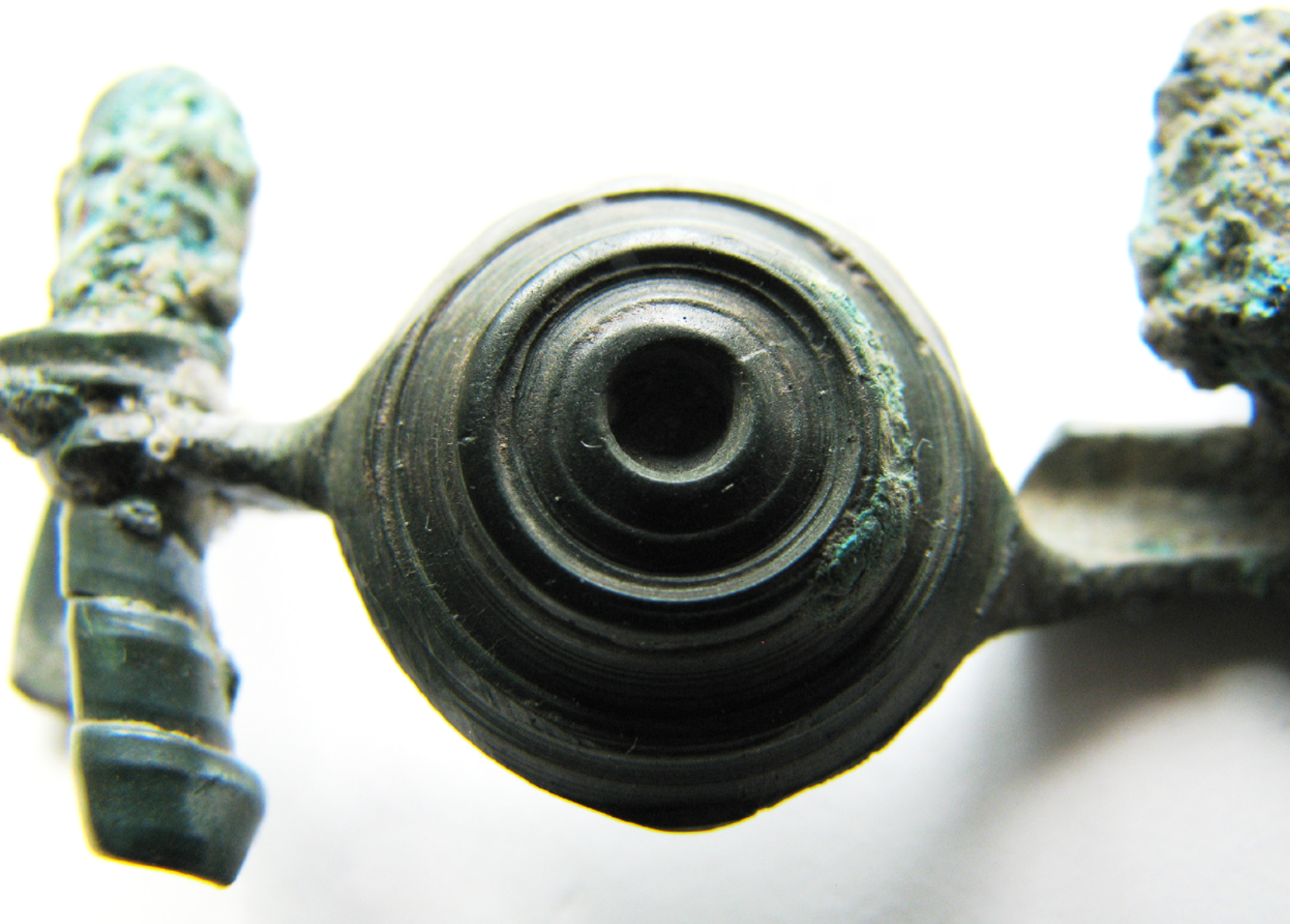
Detajl pavkaste fibule.