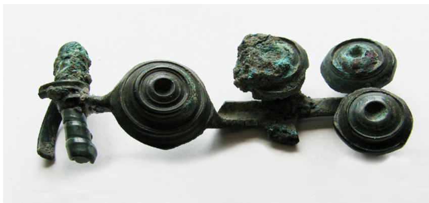
Pavkasta fibula iz Malega gradu.

omrežjih stikov ob koncu starejše železne dobe. Predstavljeni prostor se je nahajal na meji med kulturnimi omrežji, ki so se raztezala na eni strani preko Dolenjske, Posočja in severnega Jadrana vse do Tirolske, ter na drugi strani preko zahodne Madžarske in vzhodne Avstrije preko Moravske vse do češkega sredogorja. V obeh primerih najdbe s Ptuja ne kažejo v tem času obstoja velikega prazgodovinskega centra, ampak prej skrajni domet, zadnjo točko povezano v omrežje stikov med skupnostmi.