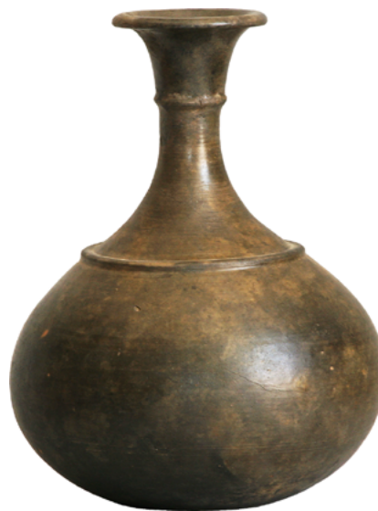
Keramična posoda iz groba 4 iz Srednice.

Drugo novost v grobovih pa predstavljajo tudi majhne železne fibule, ki so bile odkrite na prsih pokojnic, kot na primer v grobu 7. Zraven fibul je pokojnica dobila v grob še manjši železen nož in bronast prstan ter dve ovalni bronasti ploščici. Prva, gladke oblike, predstavlja starejšo obliko pasne garniture in je poznana predvsem z najdišč na Češkem. Druga, ki pa je bila na površini profilirano okrašena in v sredini predrta, pa glede na kanal, izdelan na spodnji strani ploščice, predstavlja del ploščate fibule značilne za obdobje začetka mlajše železne dobe s področja osrednjih Alp. Kljub dokaj arhaičnemu videzu vseh predmetov odkritih v tem grobu, lahko upravičeno menimo, da gre v primeru slednje ploščice za star predmet, ki se je dolgo časa nahajal v uporabi. Oziroma, ga lahko interpretiramo kot star družinski predmet, ki je bil šele veliko kasneje priložen v grob. Gre za pokop ženske, katero lahko glede na pridatke proglašimo za čuvarko tradicije ter lastnico predmetov, ki ilustrirajo zgodovino in pot prvih priseljencev.