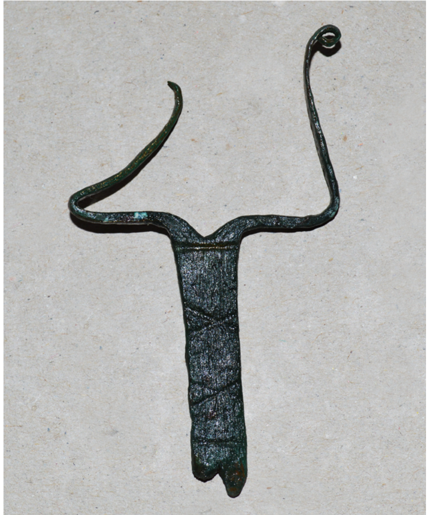
Nosilec perjanice z rimske čelade s Turnirskega prostora.