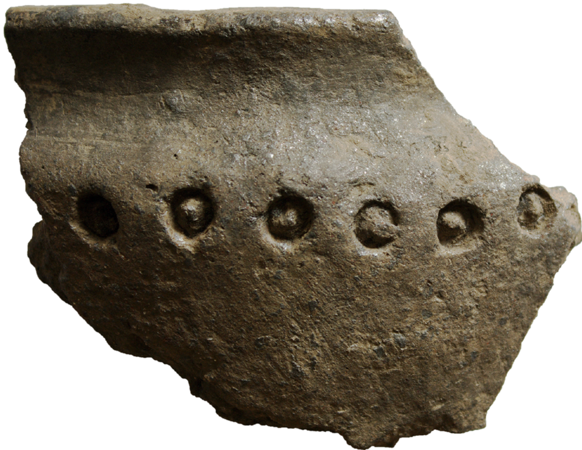
Odlomek grafitne keramike s Turnirskega prostora.