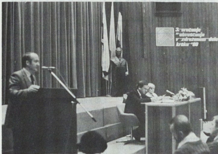
Otvoritev srečanja organizatorjev obveščanja v Krškem.