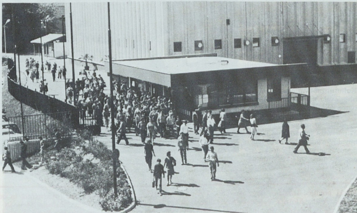
Vsakanji prizor: Ob 13. uri pred našo tovarno