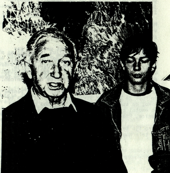
AVGUST DELAVEC NA MUZEJSKEM DNEVU V MOJSTRANI DNE 12. oktobra 1991

LETNA ČLANARINA 1992 250 SLT za člane 100 SLT za dijake, študente in upokoјence