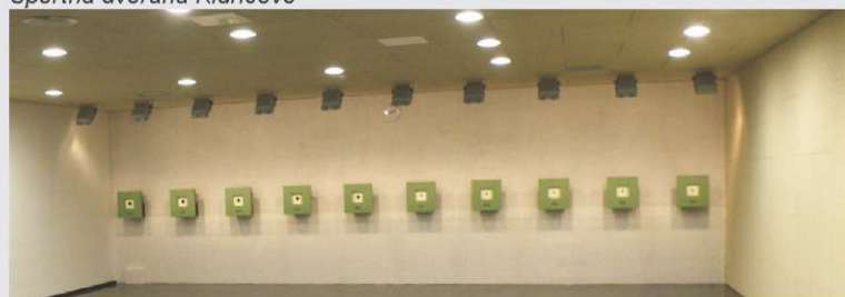
Strelišče v Športni dvorani Kidričevo