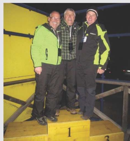
Najboljši med mlajšimi veterani