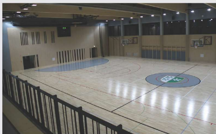
Športna dvorana Kidričevo