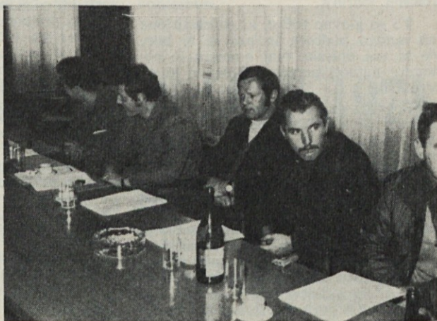
Pletla se je nit prijateljstva