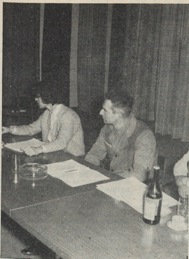
V sejni sobi se da dolgo v miru delati