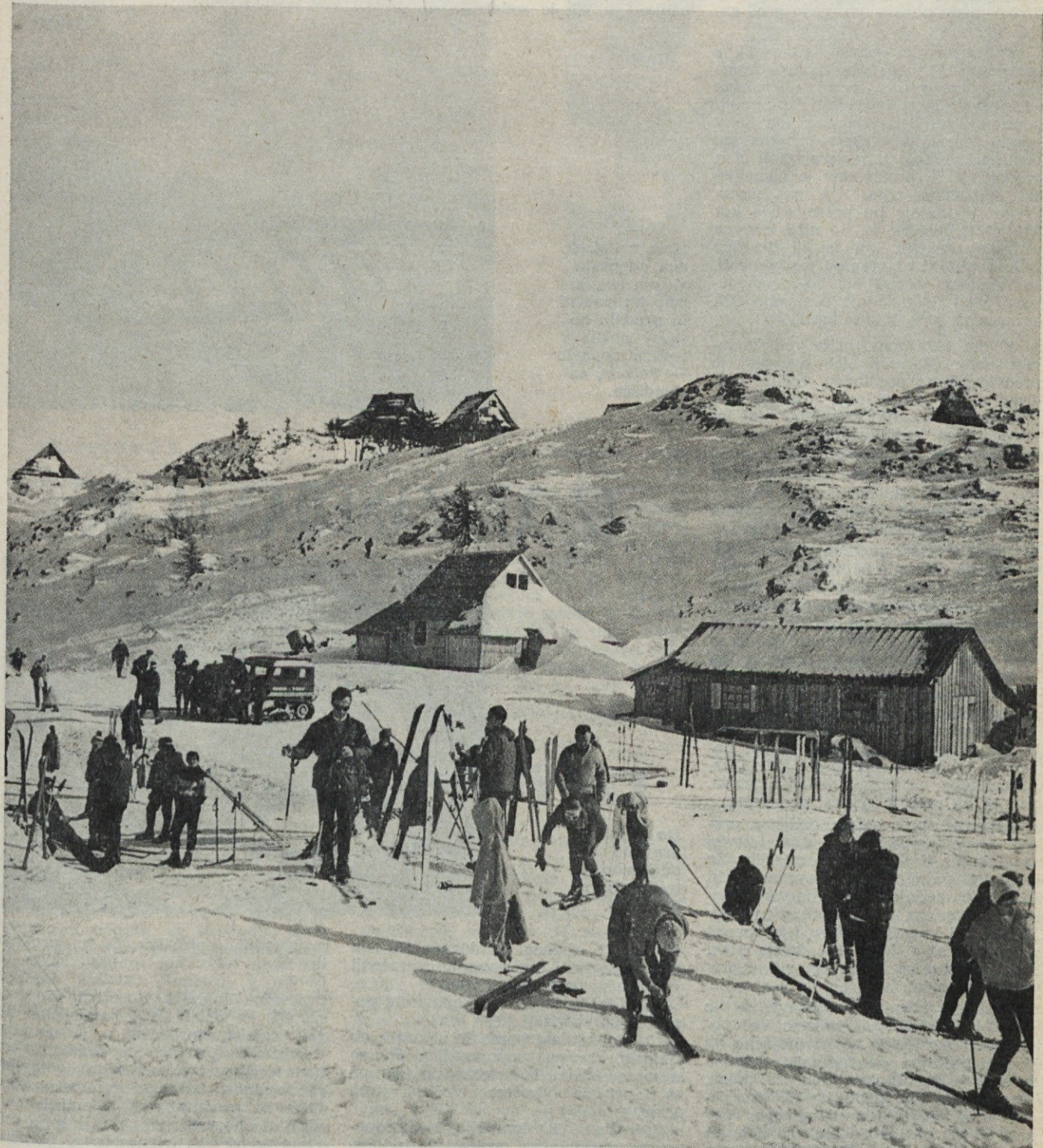
Tima bela - vedno lepo vedno privlačna - kdo bi se mogel upizati njenim čarom?