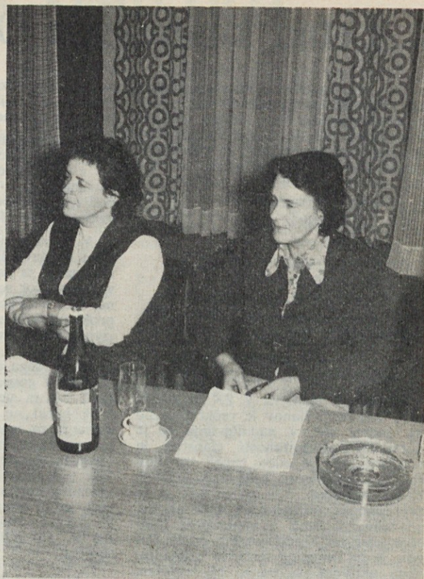
DS — sprejemanje plana