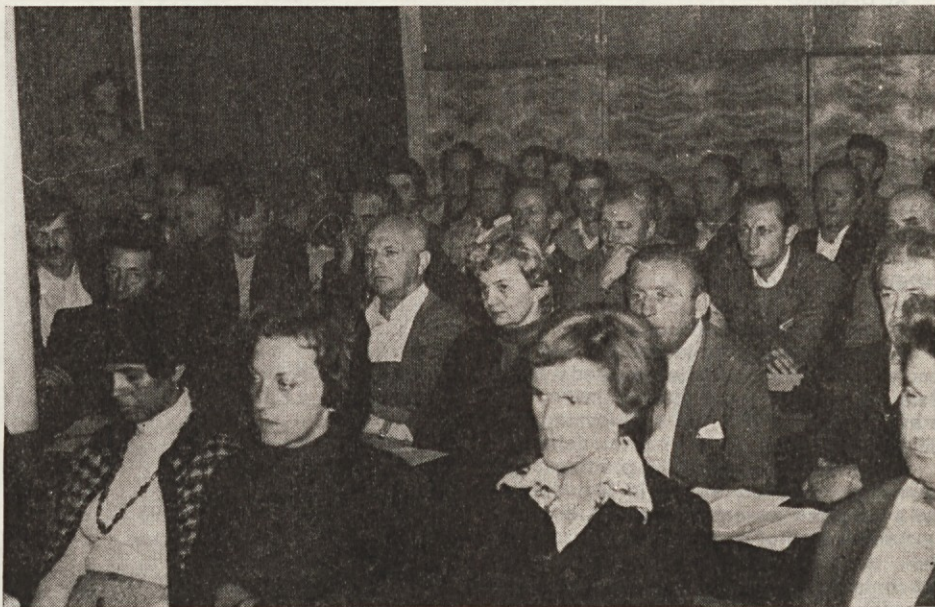
Poleg članov komisije za vrednotenje dela sodelujejo v usklajevalnem postopku vsi sodelavci v podjetju. Prizor s sestanka v mali dvorani v KD na Duplici