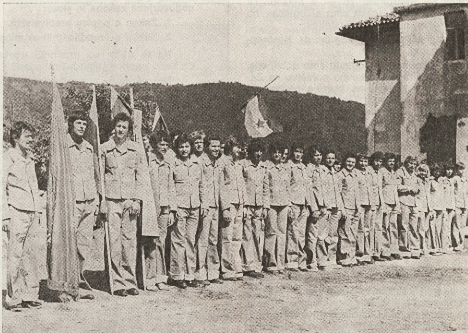
Prepoznajte naše sodelavce v delovni brigadi »Kožbana 76«?

Tudi komunisti so v brigadah organizirani v aktivne komunistov. Naj pričem pri akciji Kamniško sedlo. Sodelovalo je 15 brigadirjev. Od tega sta bila 2 brigadirja iz Domžal in dva iz Kraljeva. Bri-