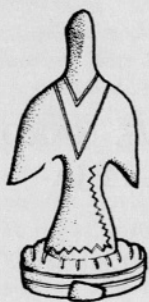
Sl. 1. Ulita bronasta fibula v obliki goloba

3. Sledita dve fragmentirani bronasti zapestnici z verjetno neskle- njenima koncema.