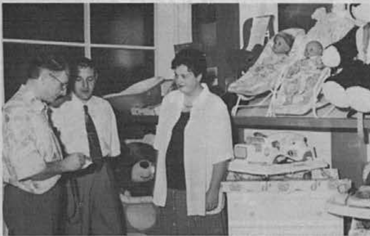
Čenča v novih prostorih v Koflerjevi hiši