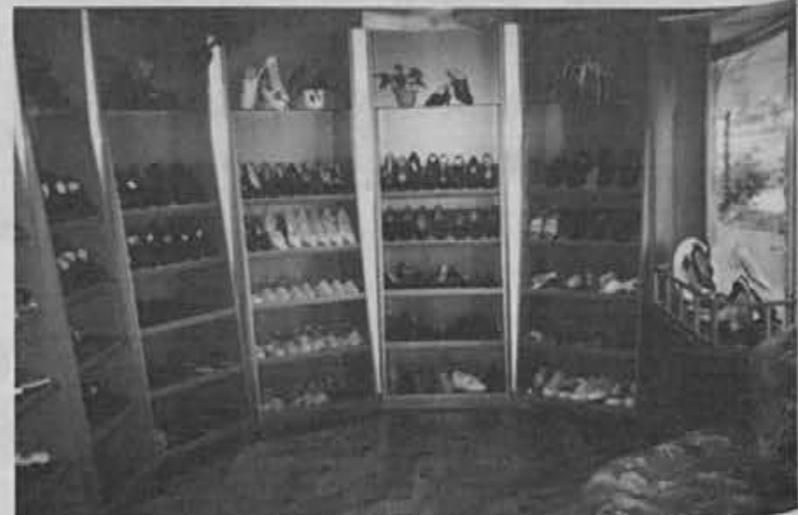
Takole izgleda funkcionalno urejena prodajalna