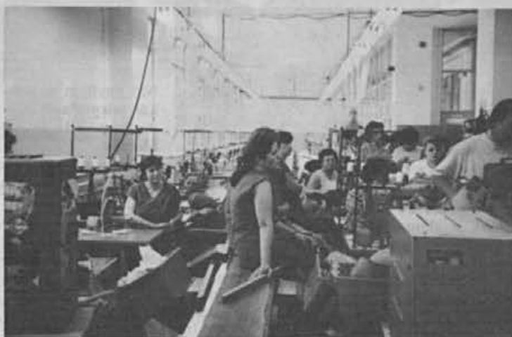
Iz proizvodne hale na Kalu