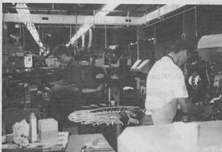
Cvikanje opetja in cvikanje konic

Skupaj je naša dnevna proizvodnja 2800 do 3000 parov. Nihanja so seveda zelo odvisna od vrste obutve oz. zahtevnosti izdelave, pa seveda tudi od tega, kako je proizvodnja pripravljena in oskrbovana.