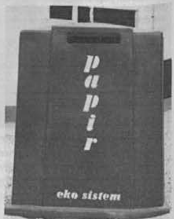
Odlagališče za papir je lepa pridobitev za kraj, še boljše bi bilo, da bi odpadke sortirali že doma