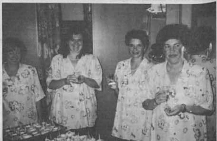
Zadovoljne prodajalke v prenovljeni prodajalni v Šentvidu