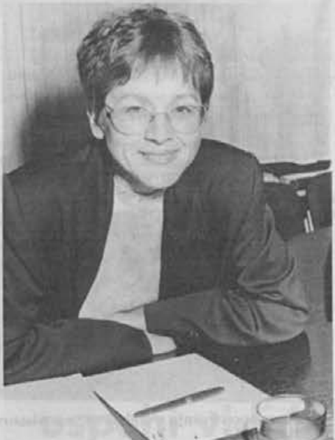
Direktorica sektorja za splošne in kadrovske zadeve

Ko bodo delovna mesta oblikovana, opisana, pride na vrsto ocena njihove zahtev-