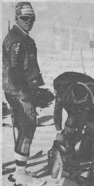
S treninga naših smučarjev

Komerciali naj sprejmeta toliko naročil, kolikor jih lahko naredimo