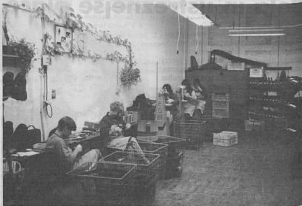
Na obrezu po vlivanju v oddelku termoplastov