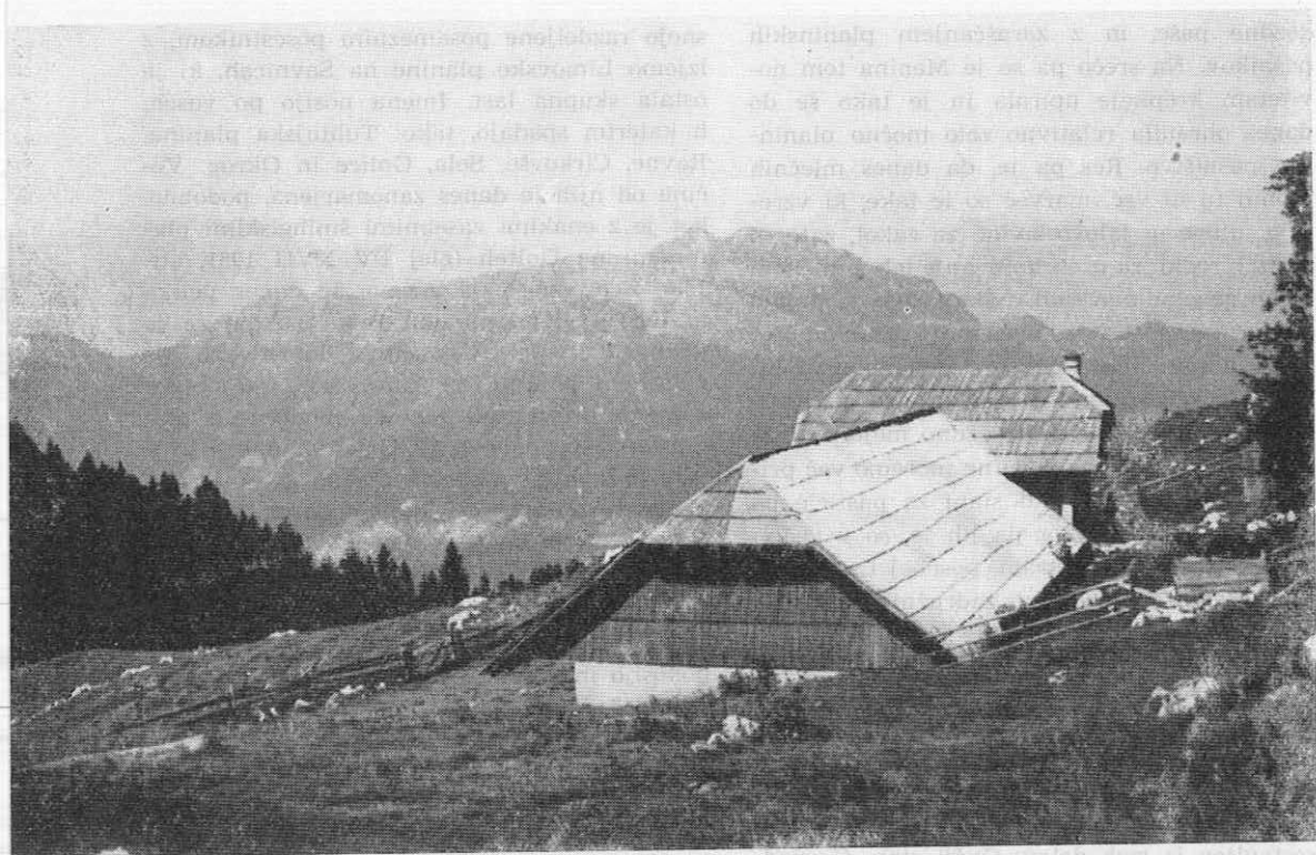
Mogočen stan in hlev na planini Travnik je znak močne planinske živinoreje. Idealna lega za planinski dom s širokim pogledom na Lepenatko in Vel. Rogatec (v sredini), na Dleskovško planoto z Ojstrico (levo) in Raduho (desno)