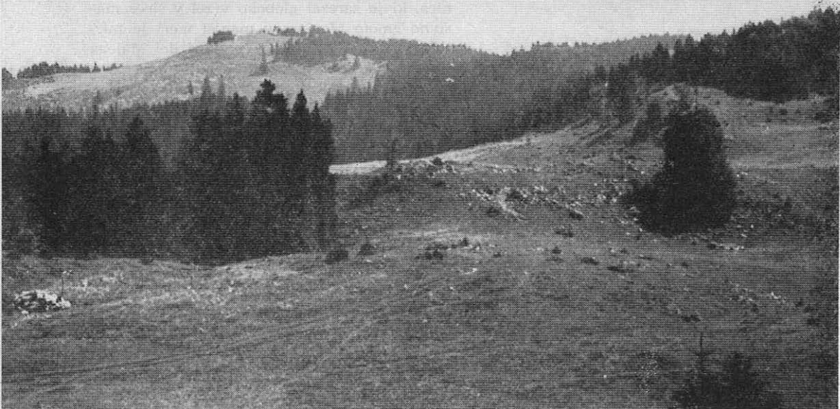
Tipična podoba, kakršno srečujemo na vsakem koraku na zakraseli planoti Menine. Planina se vrsti za planino, pasovnik za pasovnikom