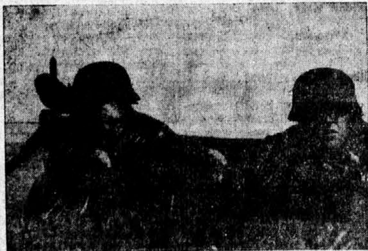
Nemški poljski mitraljez na frontnem položaju. Pri napredovanju pehote se je izkazal mitraljez tudi v tej vojni kot najbolj nevarno morilno orožje

Ko zvečer srečate avto, ki vam požene z odprtimi žarometi snop svetlobe v oči, vam gotovo ni kaj prijetno. Avto je že zdavnaj mimo, vi pa se še vedno napol »oslepljeni« lovite po temi, ki vas je spet zagrnila. Jezite se, včasih kolnete in zdrobili bi ta hip brezobzirnega šoferja v prah in pepel, če bi ga dobili v roke. Toda kje je že možakar, medtem ko se vi polagoma spet razgledavate in tipate skozi temo. V duhu kličete na pomoč oblast, hudujete se, ker še ni izdala drakonske uredbe proti avtomobilskim vozačem itd. itd. Kaj vam vse to pomaga? Prav nič! Saj sami veste, kako je. Ko pa boste drugič spet srečali avto, ki vam bo podil v oči scemečo svetlobo, tesno zamižite z enim očesom. Ko bo avto mimo, ga odprite. In videli boste, da niste izgubili orientacije, kajti na oko, s katerim ste zamižali, vas žaromet ni »osleplil«.