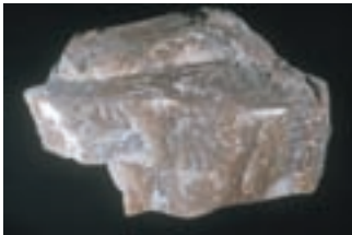
Siv anhidrit; 13 x 8 cm. Najdba in zbirka Jožeta Bediča, Gornjesavski muzej Jesenice.

Geološka sestava Karavank je zelo pestra, kar so najbolje občutili graditelji med vrtanjem predora, saj so naleteli na različne kamnine: apnenice, dolomite, laporje, breče, konglomerate, peščenjake, razne glinene kamnine, vmes pa so našli tudi nekaj mineralov. Močna tektonika je te plasti nagubala in prelamljala, tako da jih večina ni več v prvotni legi. Predor so vrtali skozi zgornjekarbonske, spodnje- in srednjepermske in triasne plasti. Le vstopni del je zgrajen v moreni, kvartarnem pobočnem grušču in v morenskem tillu.