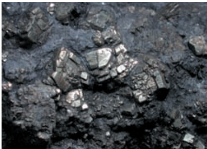
Skupki kristalov pirita: 30 x 25 mm. Najdba in zbirka Jožeta Bediča, Gornjesavski muzej Jesenice.

dolžini 800 m, vendar v presledkih. Najdaljši odsek je med 315 in 933 m, ki ga sestavljajo rdeči glinavci, laporovci, rdeči oolitni apnenci in rumenkast dolomit, vmes sadra v lečah in polah. Odsek srednjetrojstanskih plasti je dolg le 60 m, v zgornjetrojstanskih pa ponovno od 2.851 m prek državne meje na avstrijsko stran. Dolomit prehaja v črn karnijski laporovec.