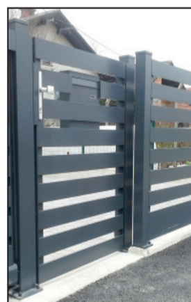
ALU OGRAJE IN VRATA