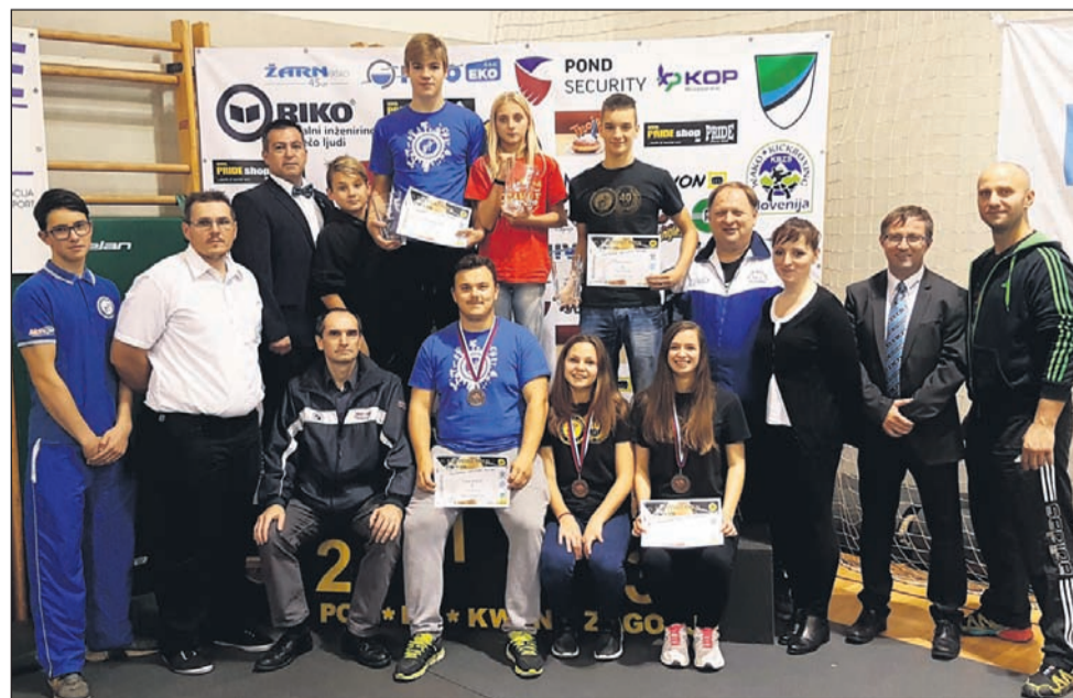
Ptujčani v Zagorju