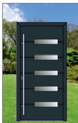
ALU VHODNA VRATA