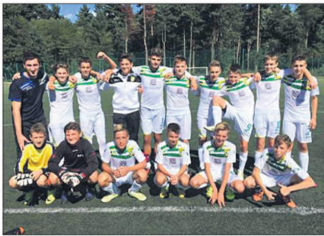
Ekipa U-15 NŠ Zavrč

»Vsa zgodba, kar se tiče nogometa, bo šla naprej. Z mladimi se bomo v Zavrču še intenzivneje ukvarjali, zadnje dogajanje okrog članske ekipe pa za nas pomeni neke nove možnosti, predvsem v obliki prihoda