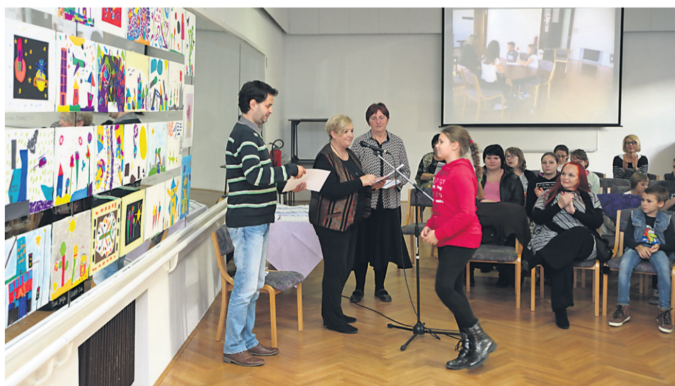
Vsak udeleženec letošnjega Mihčevega festivala je prejel priznanje ter zbornik z vsemi nastalimi kolaži in najboljšimi besedili.