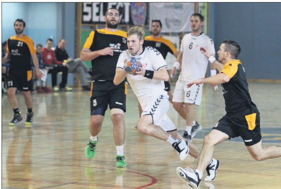
Rokometaši Drave so imeli proti ekipi Dol TKI Hrastnik velike težave z realizacijo.