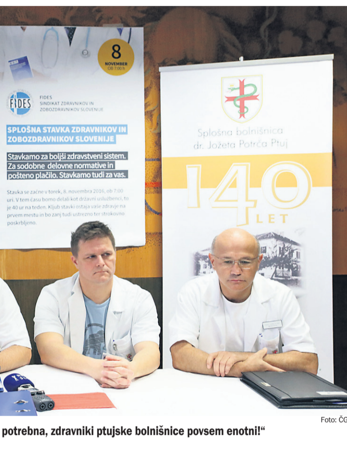
potrebna, zdravniki ptujske bolnišnice povsem enotni!"

so v torek zdravniki začeli napovedano stavko. Od takrat naprej delajo kot preostali javni uslužbenci 40 podhranjene. Po le treh dneh stavke se je izkazalo, da imata bolnišnici v Ptuju in Brežicah največjih težav. Bolnišnica v roku dveh tednov zaprla svoja vrata.