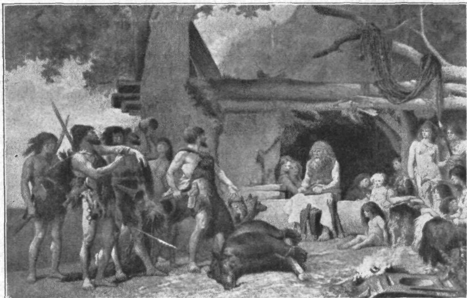
Naši davni predniki.

Človeško zobovje precej sliči zverinskemu, vendar pa je ustvarjeno tudi za premlevanje rastlinske hrane. Sicer pa ne najdemo tudi med zvermi, če izvzamemo mačke, nobenih, ki bi se hranile izključno in vse življenje le z mesom. Pa celo med mačkami dela izjemo domača mačka, ki se tu pa tam zadovolji z rastlinsko hrano. Naj omenimo samo naše bližnje znance ježa, lisico in medveda! Vse tri prištevamo roparjem,