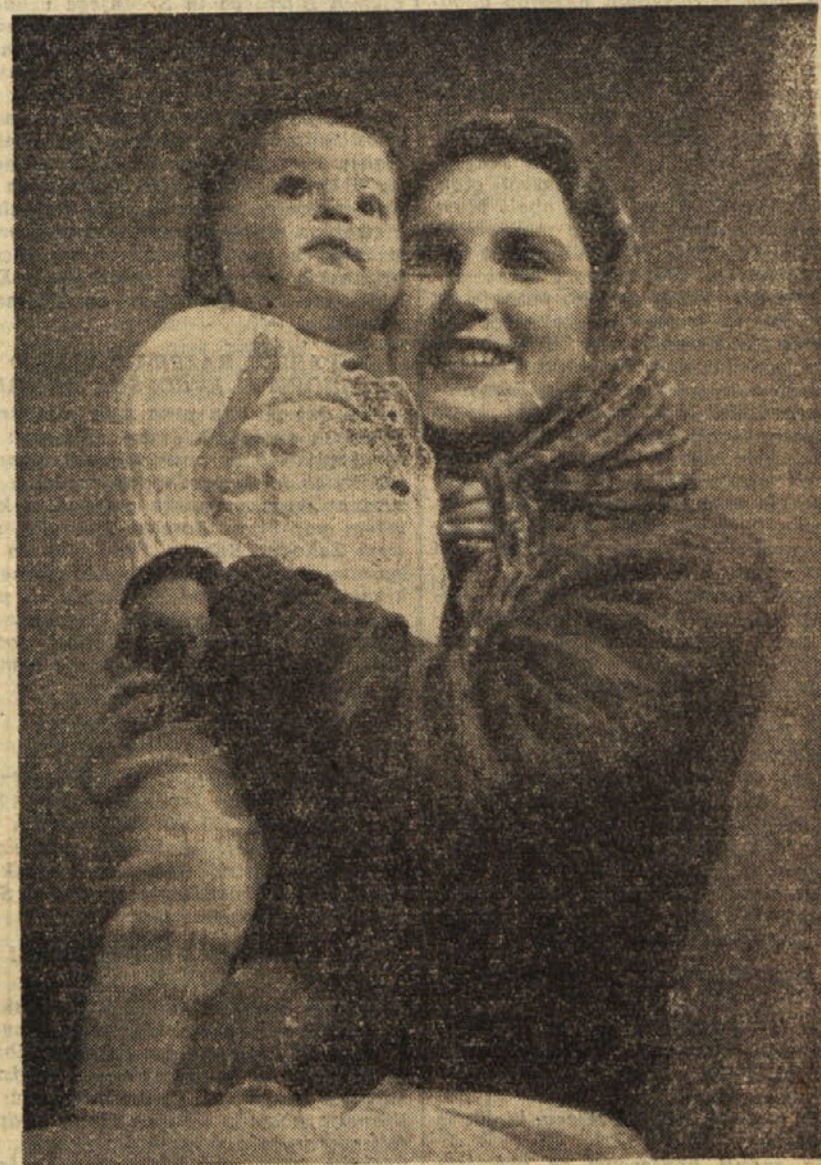
Zdrav, krepak, trden in veder mora biti naš mladi rod. Zakaj ta rod bo dedoval velike ustvaritve naših rok. — Smelo zre mati v lepo prihodnost svoje družine, svojih otrok ob letošnjem novem letu