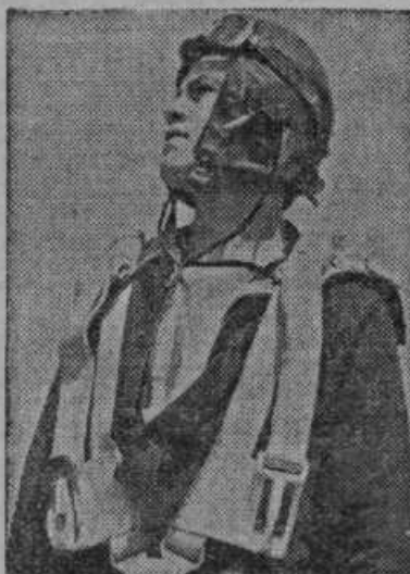
Obličina angleških letalcev