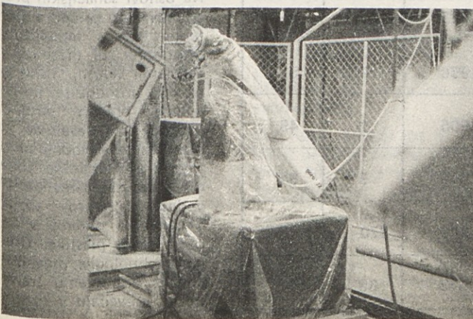
Goro 102 v proizvodnji emalirnice tozda Štedilniki – več na 3. strani

Delovni ljudje in občani občine Velenje so doslej nakazali za sanacijo Gorenja TGO 8.646.377,50 dinarjev, samoupravne interesne skupnosti občine Velenje pa 39.089.835 dinarjev. Skupni prispevek občine Velenje za sanacijo Gorenja TGO znaša torej do 30. 6. 1984 47.736.212,50 dinarjev.