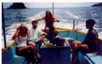
Z ribičem okrog Liparov

Po duhovni hrani, ki smo jo črpali ves dan, človek postane tudi lačen in žejen. Ali bomo pico za 35000 lir ali za 2000? Sedaj pa še spanje! Pri iskanju poceni prenočišča nam je pomagala cela skupina domačinov, vendar smo se na koncu odločili (23h!!), da bomo prespali kar zunaj, na praznem parkirišču zraven policije. Pa še čudovite palme so nas skrile medse. Čeprav velja Napoli in njegova predmestja za najbolj nevarno mesto v Italiji, je noč minila mimo, kar je bil dober znak za naprej.