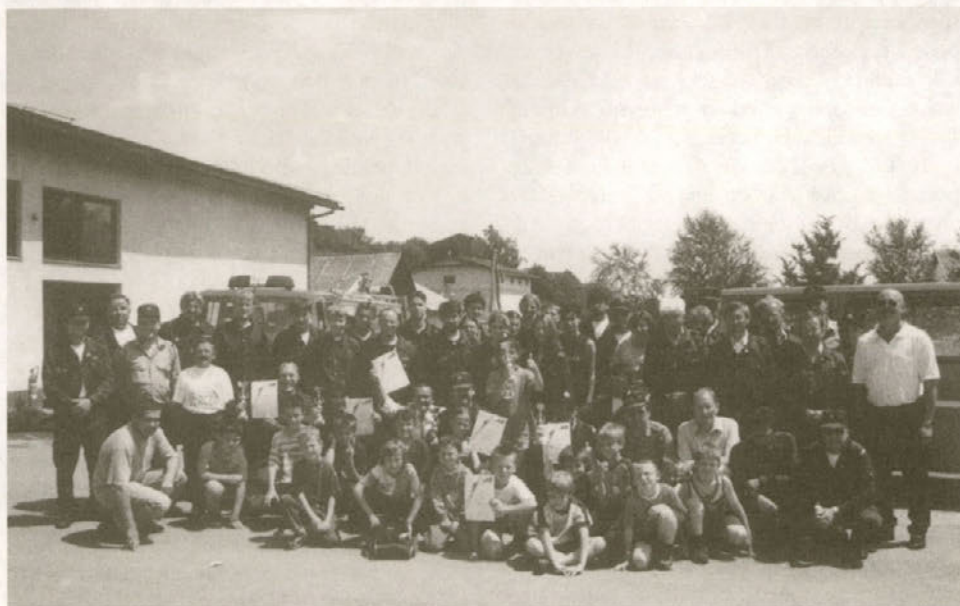
Skupinski posnetek letošnjih tekmovalnih desetih PGD Biš