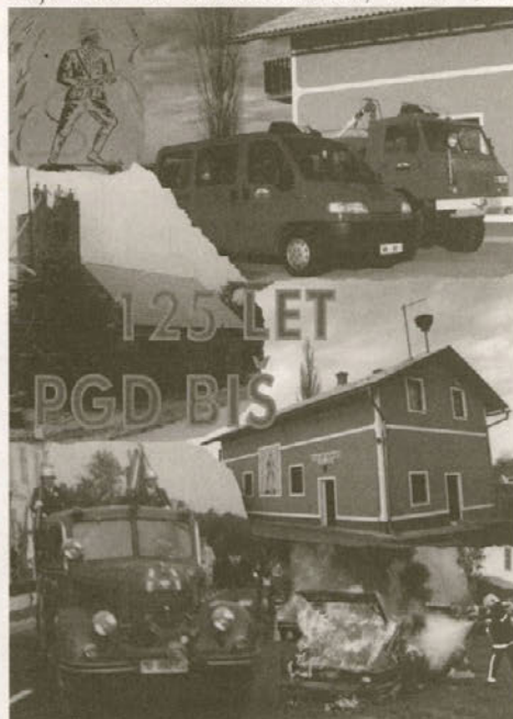
Naslovnica knjižice, ki je izšla ob 125-letnici PGD Biš