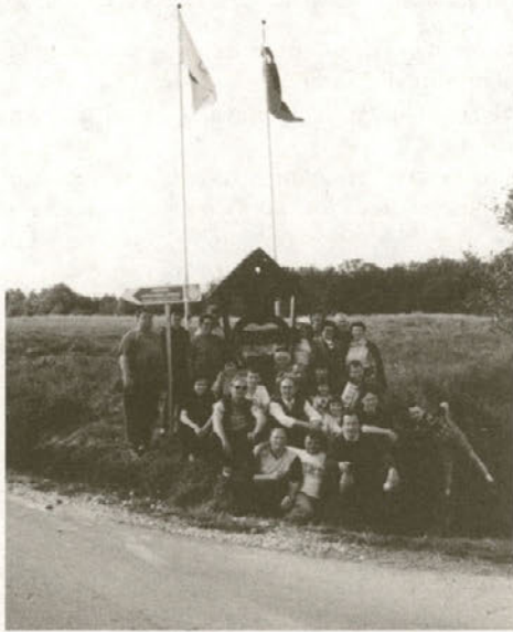
V nedeljo, 29. aprila 2001, dan pred prvim majem, smo se zbrali vaščani Sovjaka na