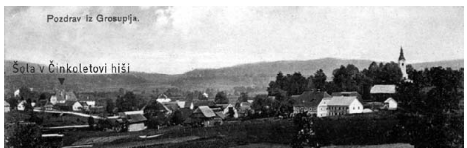
Grosuplje pred letom 1928, ko še ni bilo zgrajene šole ob sedanji Adamičevi cesti, nekoč Veliki cesti, pa tudi Glavni cesti.