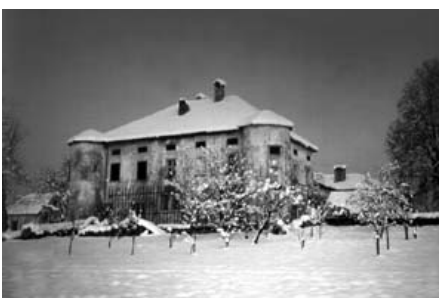
Knepov stari oče je kupil nekaj zemlje od praproških graščakov.

Letos v začetku novembra so me poklicali poliški gasilci, če bi lahko objavili v Grosupeljskih odmevih čestitko in nekaj stavkov o tovarišu Martinu. (Tu je treba povedati, da se gasilci med seboj že več kot stoletje nazivamo s tovarišem in da to naslavljanje nima nikakršne zveze s polpreteklim značajem "na pol" propadlega družbenega sistema.) "Seveda," sem jim odgovoril, "pa še sam bom nekaj dodal, ker vem, da bo njegova zgodba zanimiva". Pač! Tudi zato, ker veliko stavim na intuicijo.