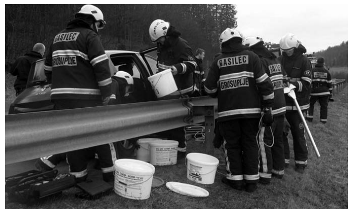
... in v intervenciji na avtocesti.