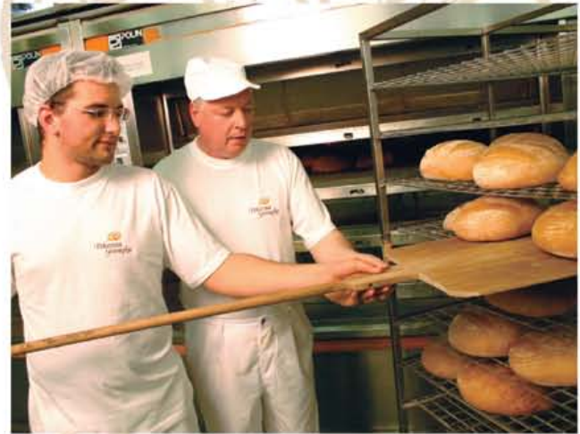
Peki Mercatorjeve domače pekarnice prenašajo znanja z generacije na generacijo.

Neposreden sestavni del družbe Mercator je Pekarna Grosuplje postala leta 2008. Prevezela je skrb za Mercatorjevo interno proizvodnjo živil in s svojimi krušnimi izdelki oskrbuje preko 500 Mercatorjevih živilskih prodajal po vsej Sloveniji.