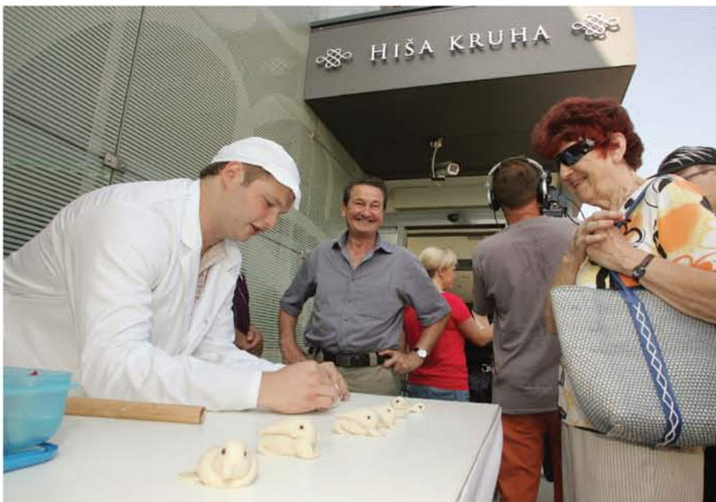
Hiša kruha je lani odprla svoja vrata na sedežu Mercatorjeve Pekarne Grosuplje v Grosupljem.

Ob zaključku jubilejnega leta v Pekarni Grosuplje zagotavljajo, da bodo tudi v prihodnje ohranjali pestrost ponudbe in razvijali nove, zdrave krušne izdelke. Ob tem pa bodo še naprej skrbeli za visoko varnost živil in dobro poznavanje okusa Mercatorjevih kupcev.