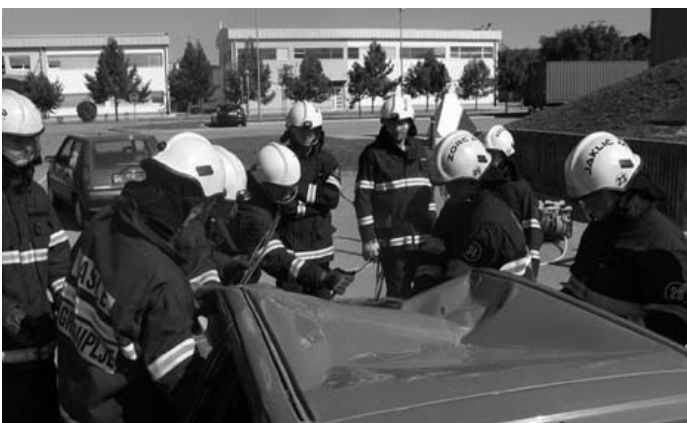
Grosupeljski gasilci na vaji pred gasilskim centrom ...

Ali v prihodnosti zato razmišljate, da bi bilo zavoljo rasti primernejše organizirati poklicno gasilsko dejavnost, ali imate dovolj trdno podporo v bazi prostovoljnih društev?