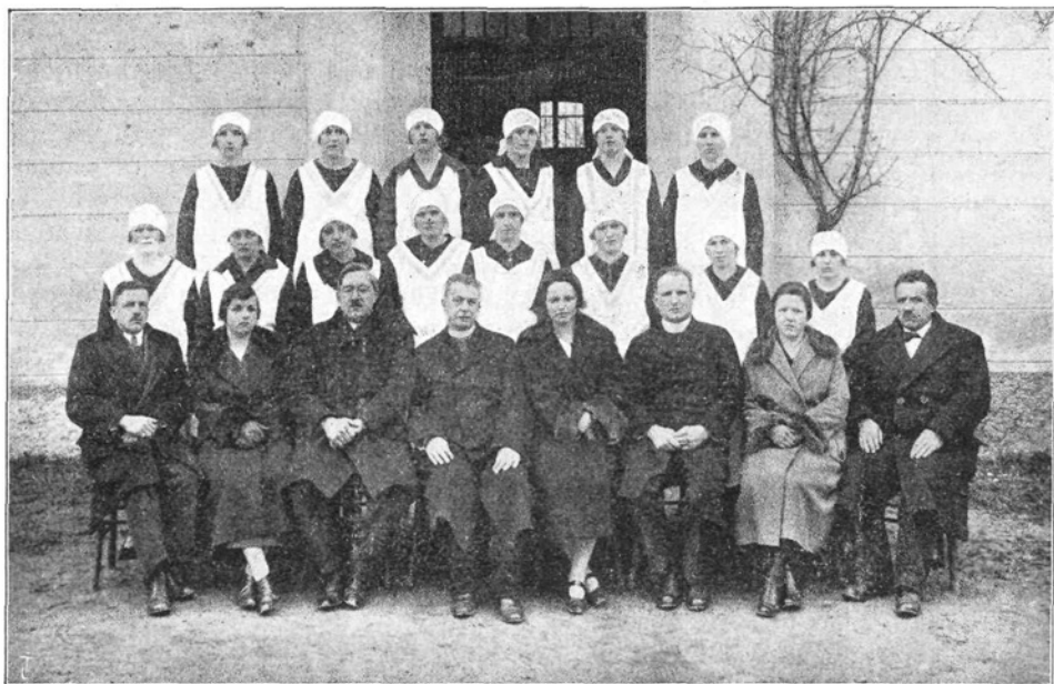
Udeleženke gospodinjskega tečaja v Moravčah.

Zadnje dni pred razstavo pa postane v tečaju nenavadno živahno. Načrt za razstavo je že izdelan; pri tem se je bilo seveda treba ozirati na razstavne prostore. V šivalnici se dogotavljajo zadnji predmeti za razstavo. V kuhinji se skrbno izbirajo in pripravljajo kuharski izdelki za razstavo in sestavlja jedilnik za poslovilni obed.