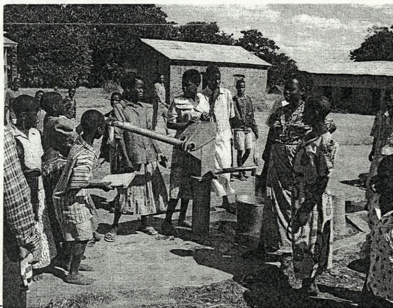
Vodnjak pred šolo vasi Lisasadzi