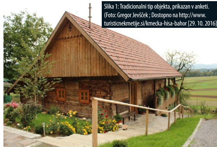
Slika 1: Tradicionalni tip objekta, prikazan v anketi.

tega se je kar tretjina vprašanih opredelila do tega, da bi, če bi še enkrat gradili, zgradili manjšo in nižjo hišo, 25,5 % vprašanih bi si zgradilo enako hišo, vendar z nekaj izboljšavami, 23,5 % pa sodobno, vendar s tradicionalnim pridihom. Na podlagi visokega deleža »pozitivnih« opredelitev vprašanih na odgovore razumemo, da večina anketiranih ceni in prepozna identiteto prostora, slednje tudi razberemo iz odgovorov na vprašanje »Ali obstaja v Beli krajini več tipov oblikovanja tradicionalnih hiš?« na katerega je pritrdilno odgovorilo kar 68,6 %, na podlagi česar sklepamo, da uporabniki razločijo značilnosti oblikovanega v prostoru. Vendar bi kljub temu bilo potrebno zastaviti še podrobnejša vprašanja v zvezi z oblikovanjem objektov ter šele na podlagi teh odgovorov narediti dokončne zaključke o dojemljanju in odnosu do identitetnega stavbarstva.