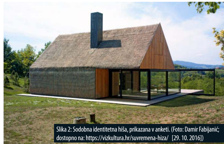
Slika 2: Sodobna identitetna hiša, prikazana v anketi.