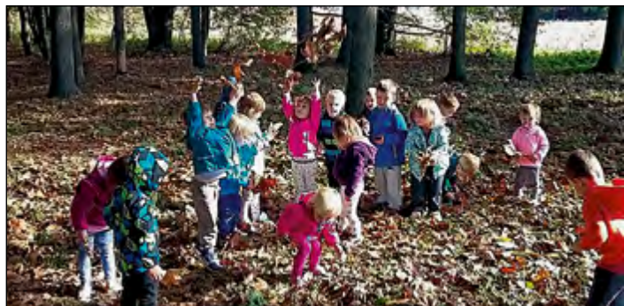
Otroci iz zelene igralnice so se podali na sprehod v gozdiček, kjer so se poigrali z jesenskim listjem.