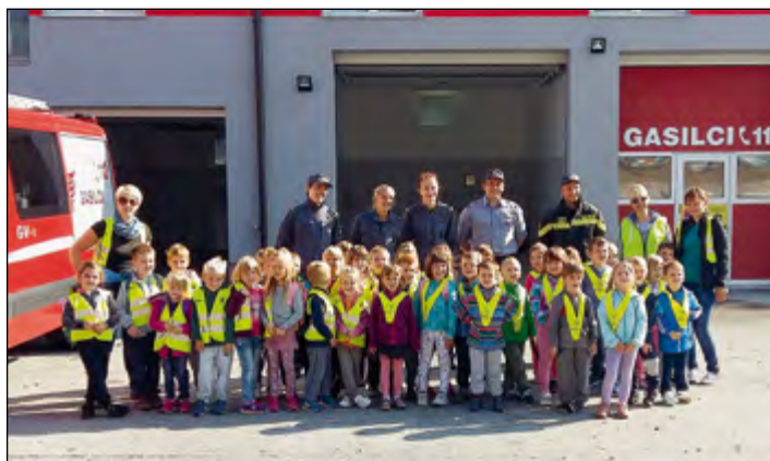
Otroci rdeče in rumene igralnice med obiskom PGD Hajdoše

Na lep jesenski dan smo se otroci rumene in rdeče igralnice vrtca Hajdina odpravili na daljši pohod do gasilskega doma v Hajdoše. Pričakali so nas gasilci in gasilke omejenega gasilskega društva. Prikazali so nam delo gasilca. Otroci so se preizkusili tudi v škropljenju z vodo. Ogledali so si gasilski avtomobil, gasilske pripomočke za gašenje in po pripovedovanju izkušenih gasilcev spoznali, kako zahtevno in odgovorno je njihovo delo. Za lepo preživet čas se zahvaljujemo gasilcem in gasilkam iz Hajdoš.