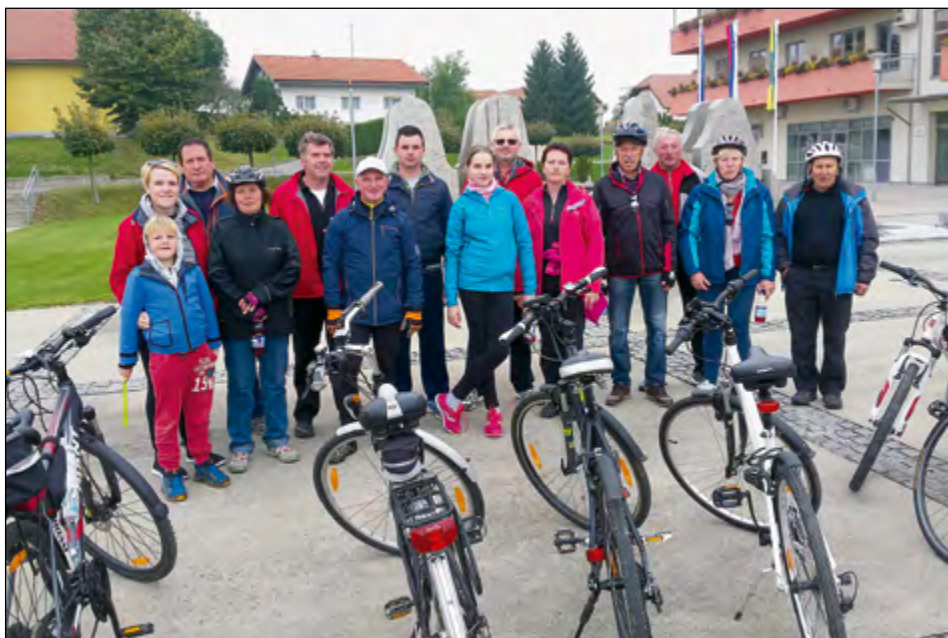
Postanek za skupno fotografijo je bil na osrednjem občinskem trgu.

Kolesarji, letos se jih je zbralo precej manj kot minula leta, so se na re-kreativno kolesarsko vožnjo podali