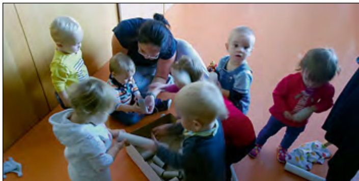
V oranžni igralnici (1–2 leti) smo se igrali z naravnimi in odpadnimi materiali ter jih tako raziskovali.