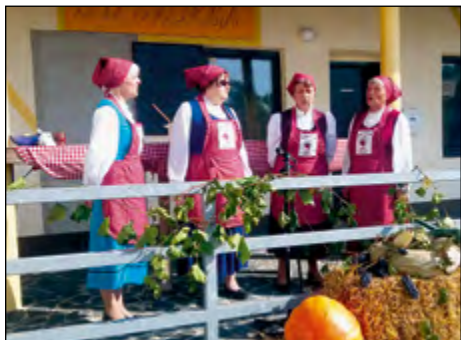
Prireditev so popestrile tudi ljudske pevke.

Tudi letos je v Skorbi potekala že tradicionalna prireditev Skorba trga in preša. Vaščani in vaščanke so se zbrali prvega oktobra, tudi vreme jim je bilo naklonjeno, saj je sonce že zjutraj pozdravljalo dan, za jesenski čas je bilo skoraj prevroče.