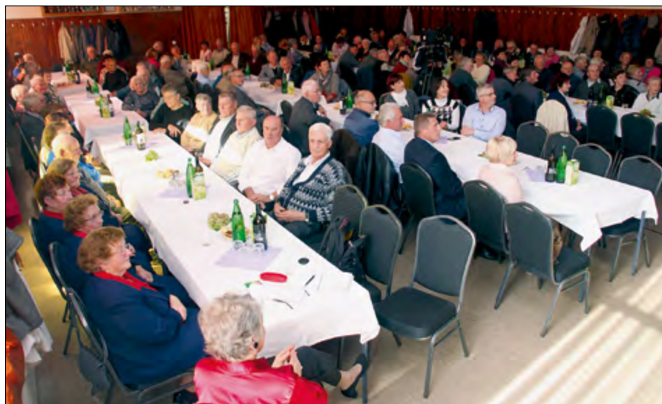
Prijetni utrinki s srečanja v Skorbi ...

Župan je med drugim dejal, da je vesel in ponosen, da je srečanje vsako leto zelo dobro obiskano ter da se lahko v občini tudi na tak prijetni način občanom častitljive starosti in v tretjem življenjskem obdobju zahvalijo za njihovo milo delo in doprinos