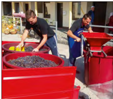
Pubeci pri delu