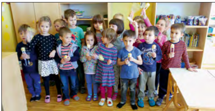
V rumeni igralnici smo si naredili tudi ropotulje in jih uporabili za spremljavo ob prepevanju jesenskih pesmi.