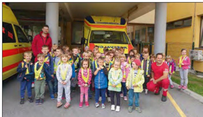
Otroci rdeče in rumene igralnice vrtca Hajdina pred Zdravstvenim domom Ptuj

Otroci rdeče in rumene igralnice vrtca Hajdina smo se v okviru načrtovanih aktivnosti v septembru odpravili na Ptuj. Za otroke je bila to izjemna izkušnja. Nekateri izmed njih so se prvič peljali z avtobusom. Med vožnjo so opazovali naravo in pri tem zelo uživali. Najprej smo si ogledali PP Ptuj. Ogled avtomobilov, policijskih prostorov in pripomočkov pri delu policistov je bil zanimiv. Otroci so policistu postavili različna in zanimiva vprašanja. Po končanem ogledu smo peš odšli proti zdravstvenemu domu. Tam nam je zobna asistentka prikazala, kako si pravilno umivamo zobe. Sprehodili smo se še po prostorih nujne reševalne ekipe. Na kratko so nam predstavili svoje delo in nam pokazali, kako je opremljeno reševalno vozilo. Otroci so si lahko ogledali notranjost reševalnega vozila, kar je bilo še posebej zanimivo. Pri samem ogledu in predstavitev so otroci aktivno sodelovali ter postavljali vprašanja, na katera so seveda dobili tudi odgovore. Menim, da bodo