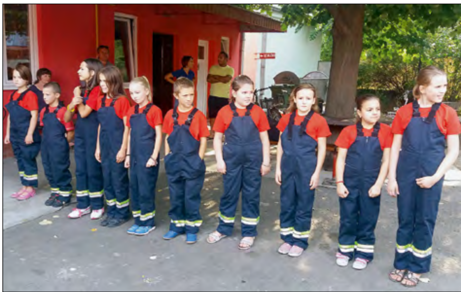
Mladi gasilci DVD Petrovaradin ob našem obisku

Gasilci iz gasilskih društev OGZ Ptuj, tudi iz občine Hajdina, smo se sredi septembra odpravili na strokovno ekskurzijo v Novi Sad. Novi Sad je v primerjavi z našim Ptujem pravi »mladenič«, saj nima niti 400 let. Je glavno mesto Vojvodine in tudi njeno upravno središče. Leži ob reki Donavi. V mestu živi 24 različnih narodnosti. Prav zanimivi so trgi in ulice, ki so bili v zadnjih letih prenovljeni.