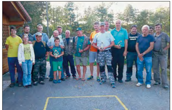
Utrinek s podelitve v Dražencih