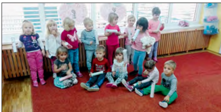
Otroci iz modre igralnice so za popestritev vrtčevskega dneva naredili svoja glasbila iz odpadnih materialov, ki jih starši pridno prinašajo v vrtec. Ob petju pesmic in igranju na svoja glasbila bo dan otrokom ostal v lepem spominu.