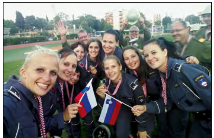
Utrinek z gasilskega tekmovanja v Pulju, kjer so hajdoške gasilke kot gostje osvojile zlato medaljo.