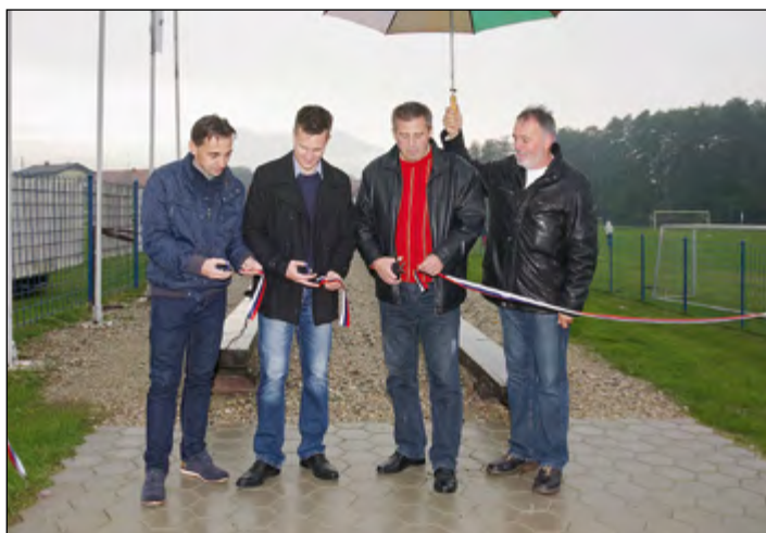
Svečani trenutek prereza vrvice ob vhodu na novo tribuno v Športnem parku Sp. Hajdina