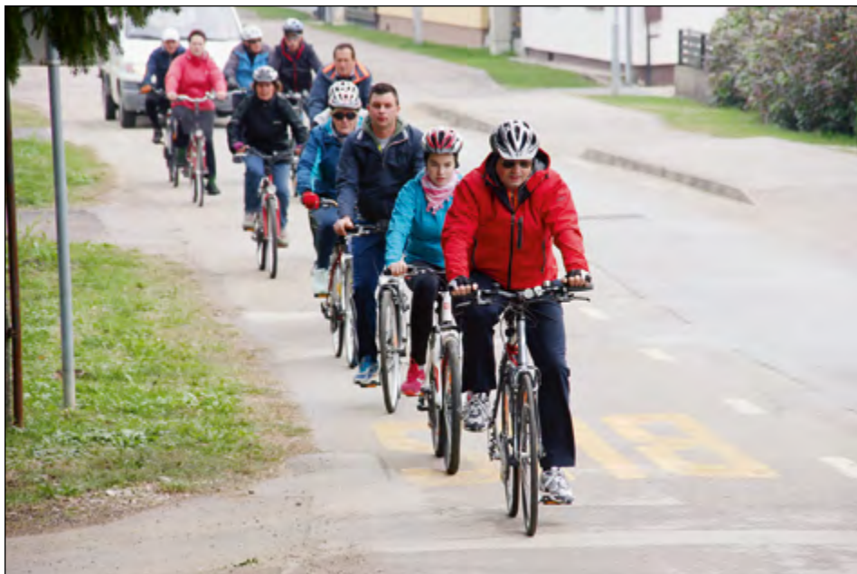
Kolesarje smo v objektiv ujeli v Gerečji vasi.

Vaški odbor Slovenja vas in PGD Slovenja vas sta v počastitev občinskega praznika organizirala tradicionalni kolesarski dogodek, ki ga je letos spremljalo oblačno vreme, a temperature so bile kot nalašč za vožnjo s kolesom.