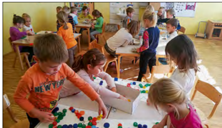
Otroci rdeče igralnice so bili zelo aktivni. V zastavljenih dejavnostih so z zanimanjem in veseljem sodelovali.