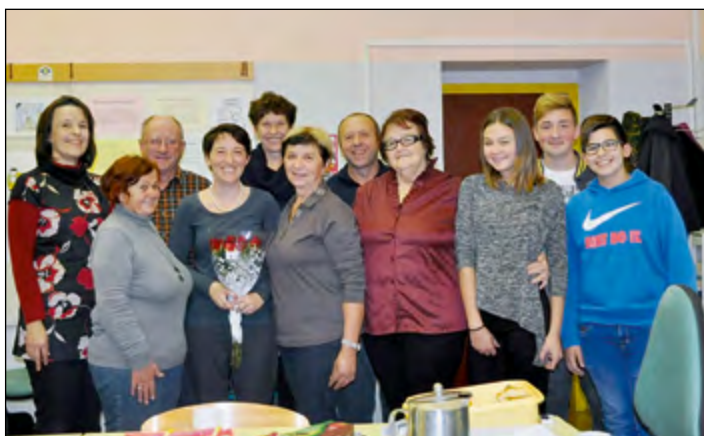
Tradicionalna Simbioza na OŠ Hajdina uspešna tudi v letošnji izvedbi

Tradicionalno smo tudi letos izvedli Simbiozo – prostovoljski projekt, v katerem učenci prostovoljci postanejo učitelji, dedki, babice in drugi starejši občani pa so spet v vlogi učencev. Cilj je usvojiti ali nadgraditi svoje znanje in rokovanje s tehnologijo, ki jih obdaja in s katero se vsak dan hote ali ne hote srečujemo.