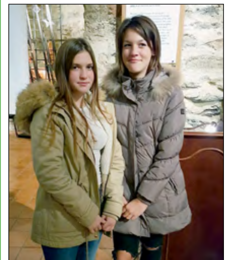
Hajdinske učenke na natečaju Pokrajinskega muzeja Maribor