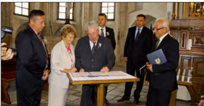
Zlatoporočenca sta po petdesetih letih obnovila poročno obljubo in to potrdila s svojim podpisom.