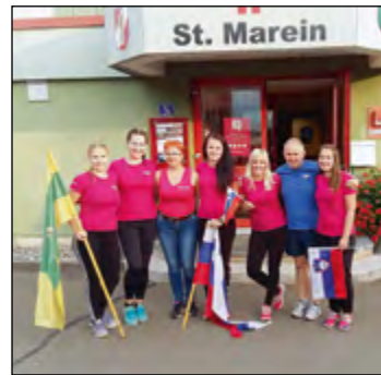
Od 9. do 11. septembra so članice A PGD Hajdoše nastopile na državnem gasilskem tekmovanju v sosednji Avstriji.

Članice A PGD Hajdoše so številnim dosedanjim uspehom dodale še dobro predstavitev na državnih gasilskih tekmovanjih v Avstriji in na Hrvaškem. Na obe pomembni tekmovanji so se odpravile na povabilo Gasilske zveze Slovenije in z veseljem so izkoristile priložnost, da se kot olimpijske prvakinje in večkratne zmagovalke državne lige in številnih drugih tekmovanj predstavijo v najboljši luči. To jim je nedvomno tudi uspelo.